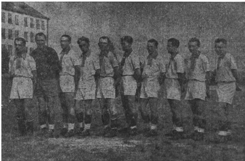
Дружина УССК-у Мюнхен репрезентує український футбол столиці Баварії

Замовлення на журнал надсилати до Кооперативи «Кос».