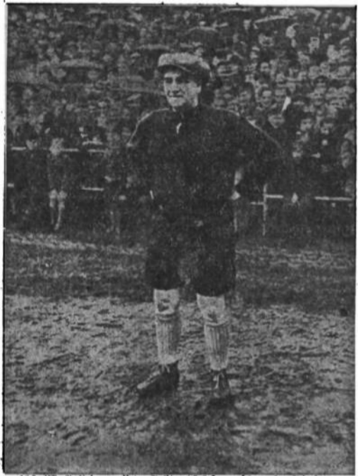
Гаррі Шіль відомий фільмовий автор і спортсмен, як воротар збірної акторів підчас змагань проти журналістів в Гамбурзі.

плавацькій. В суперництві чоловіків переміг МСФ Мюнхен, в суперництві жінок «Баяерн 07» Нюрнберг. Матч у водному полью закінчився вислідом 5:5. Позем змагань високий.