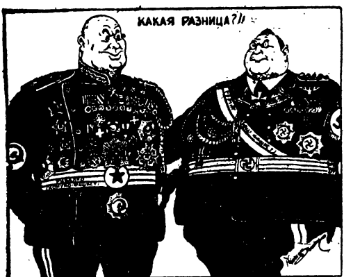
Гуков і Герінг, два символи імперіалізму, що «визволяли» Україну. («Амеріка»)