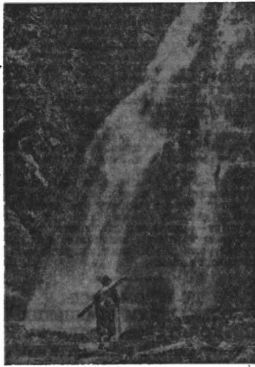
Там де літо зустрічається з зимою

Чудо в Люрд. З Парижа повідомляють, що в славній французькій відпустовій місцевості Люрд сталося нове чудо: в чудотворний спосіб повернув собі зір молодий хлопець Франсуа Паскаль. Урядове свідоцтво про надприродне уздоровлення хлопця підписано одинадцять французьких лікарів.