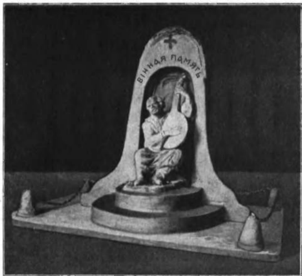
Один із проєктів пам'ятника.

І під каменем отсим посадимо з мармуру витесаного козака-бандуриста, хай до їх камінного сну грає на камінних струнах те, чого доля не дала їм почути—пісню будучої слави нашої вітчизни України, пісню грядучої лучшої долі