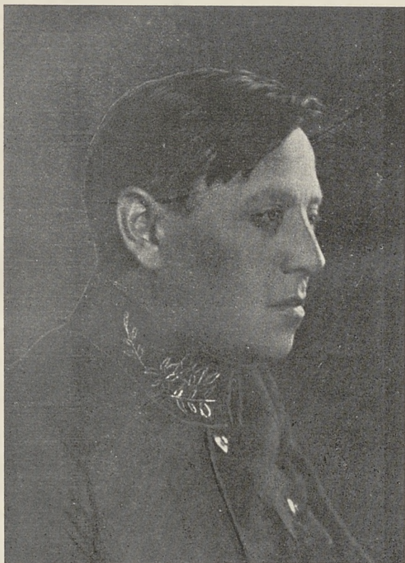
ГОЛОВА ДИРЕКТОРИІ ГОЛОВНИЙ ОТАМАН ВІЙСЬКА І ФЛЬОТИ У. Н. Р. СИМОН ПЕТЛЮРА † 25 ТРАВНЯ 1926 РОКУ