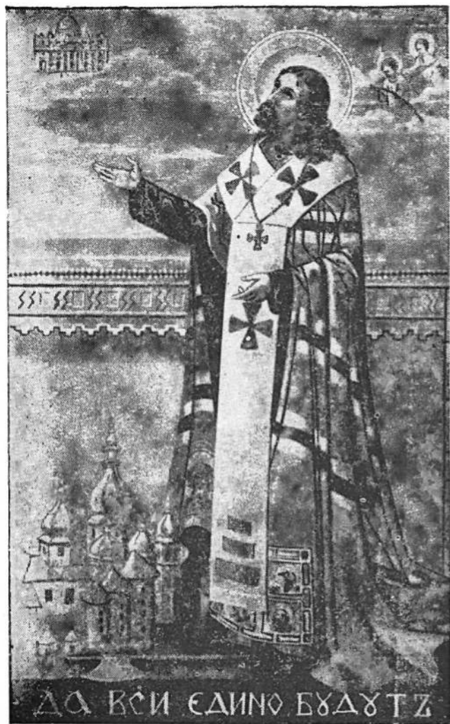
Св. Йосафат, Мученик за св. Одність.