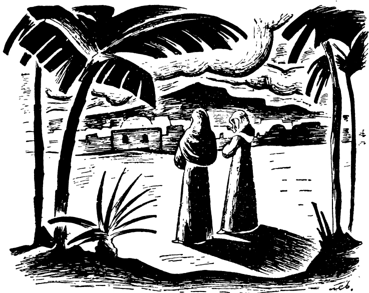
Прибули вкінці в св. Землю... (стор, 61)

монастир. Тут небаром і постриглися в черниці.