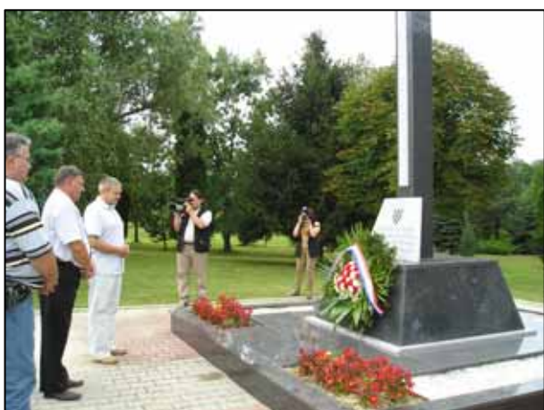
Покладання вінків у Липовлянах