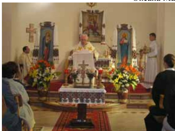
Владика кир Славомир Мікловш