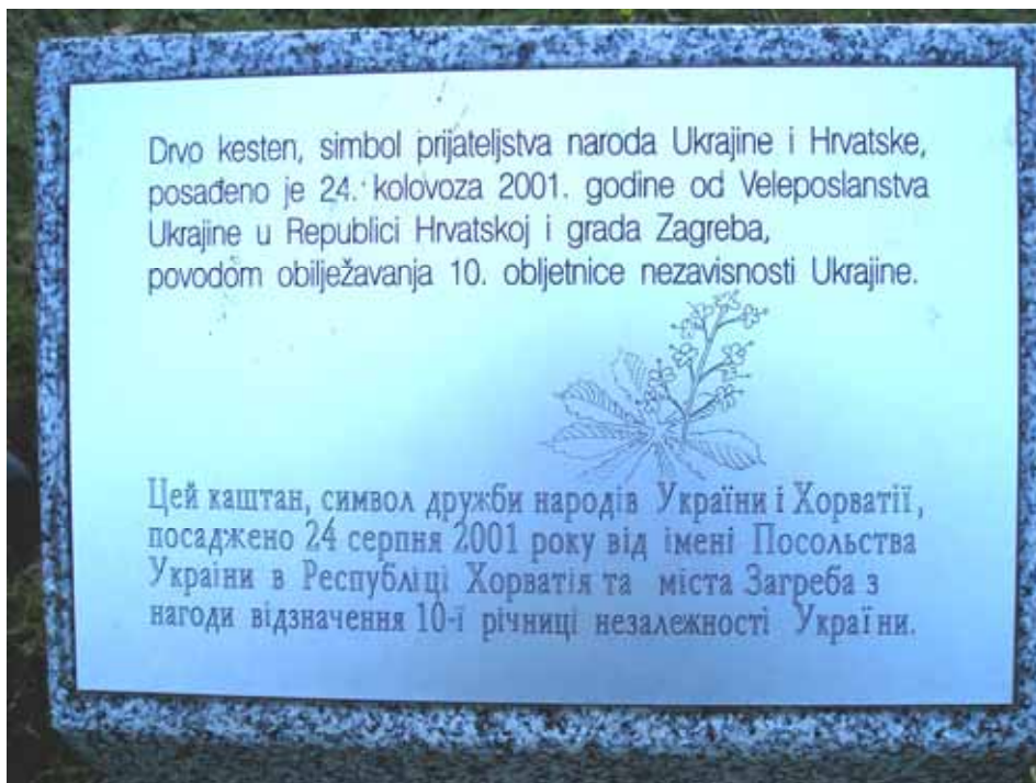
Пам'ятна дошка поряд каштана на Українській вулиці у Загребі