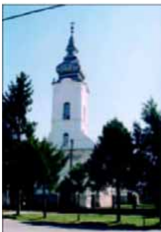
Обновена церква у Петровцох

На концу одшпиване многолітствис, а по Архиерейскей Служби Божей шицки ше розишли гу богатим кирбайским столом. Не виостала ані дзецинска радосц, бо на Кирбай поприходзели и велї цукраре, бависка и рингишпили.