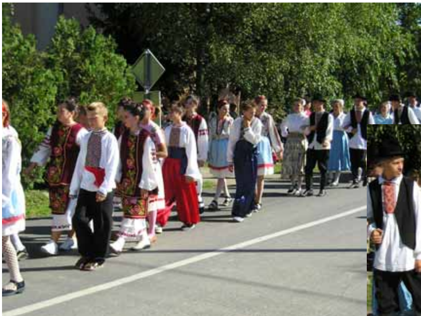
У Пишкоревцох наступели и наймладши