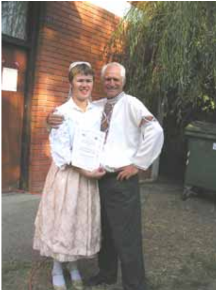
Члени дружтва "Рушняк" на Миклошевским лєту

Дружтво ма вельки плани за тот и идуци рок. У децембру рихтаю ше прадки, а у януару ше плануе вистава "Руснаци и Украинци у Приморско-горанскей жупаниї". Концепция вистави шлідуюца: у главней сали буду виложени етнографични експоненти, у другей сали видавательство, а трецей сали галерия подобовей творчосци дружтва. 15. януара будзе бал Руснацох и Украинцох, а у маю плановани "Дні