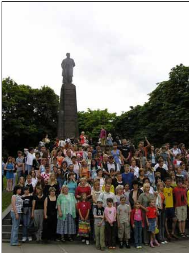
Липовлянци біля пам'ятника Т. Шевченка на Чернечій