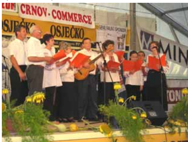
Шпивацка група зоз Осеку