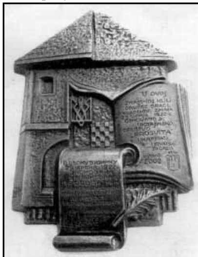
Пам'ятна дошка товариству "Просвіта"

Перед святковою програмою та після неї учасники могли послухати українську народну та сучасну музику, також і популярну пісню Руслани, що отримала нагороду на Євробаченні цього року.