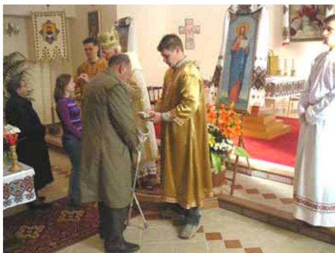
Владика дава мирванє