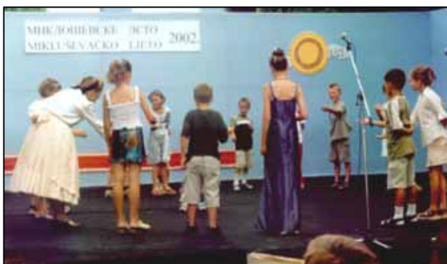
Наступ наших наймладших

Воспитане и образоване на тих наших просторох ма длугу и богату традицию. Школи иновали у велїх местох и пред приселеньом Руснацох до Сриму. На приклад: Латинска школа иснує у Вуковаре од 1734. року, греко – восточна у Петровцох од 1756. року, у Миклошевцох тиж греко – восточна од 1825. року 2 . А же бизме ше здогадли спомнем лем на кратко. Руска школа у Петровцох почала з роботу 1834. року, а у Миклошевцох 1851. року, такой по приселеню Руснацох до тих наших местох. 3