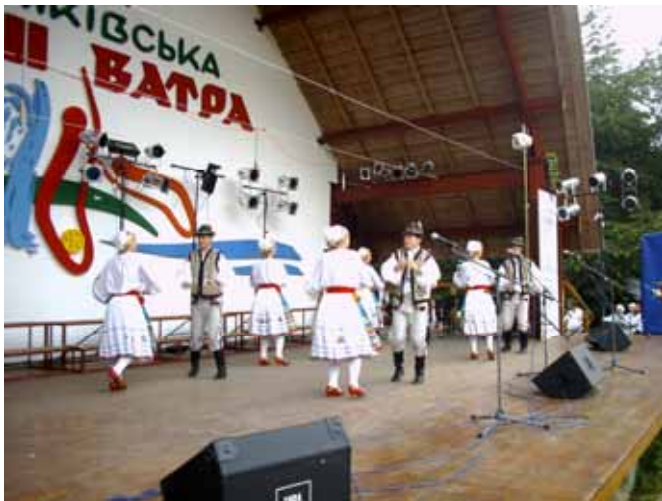
Петровски танцоше у Ждині