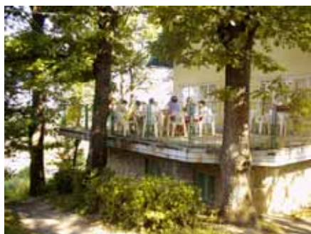
Škola u "prirodi"