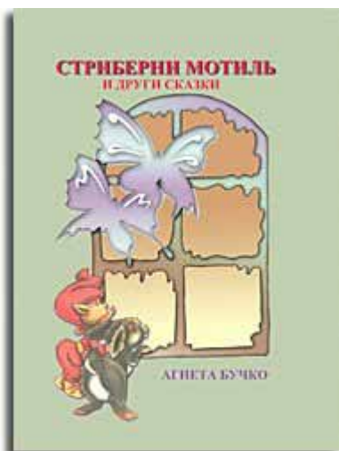
Насловни бок кніжки