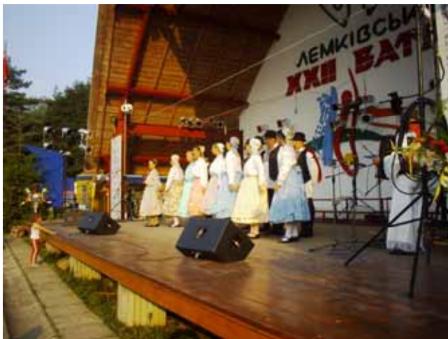
КУД "Я. Говля" и КУД "О. Костелник"