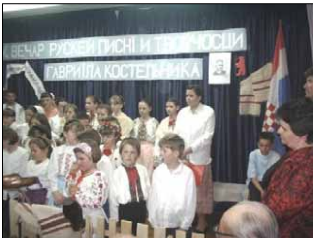
Школски кніжовни вечар у Петровцох