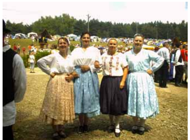
За памятку зоз Ждині