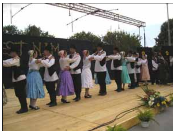
КМТ "Яким Гарді" Петрівці