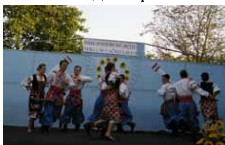
КПД "Україна" Славонски Брод