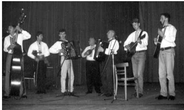
У Винковцох 1994. року