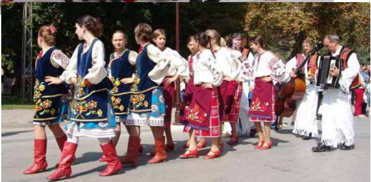
Младша група Петровчанох у дефилеу през Винковци