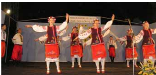
КУД "Яким Гарди" зоз Петровцох