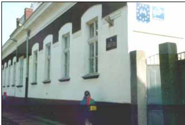
Школа у Петровцох

Образовно – воспитна діялносц у тих наших крайох доживйовала велї пременки, а вони були вше вязани за географске, економске и насампредз дружтвенно – политичне положене нашего народу. Нігда зме себе не могли виробити таки наставни плани и програми хтори би одвитовали нашим потребом, але зме вше мушели „танцовац” так як нам други надумали грац. Часто зме ше мушели и скривац кед зме сцели бешедовац, читац и писац по руски. Заш лем, дзекуюци нашим предняком, насампредз учительом и священству, на тих просторох зме ше розвили у шицких напрамох и маме зоз чим висц пред швет, нешка у чаше и у процесу взагальней глобализації.