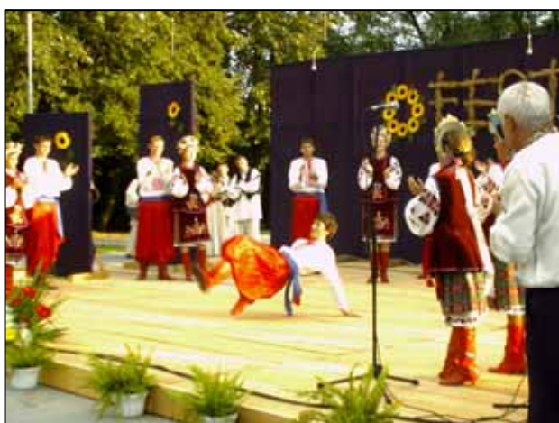
Завжди атрактивний гопак