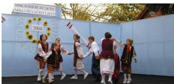
КУД "Осиф Костелник"