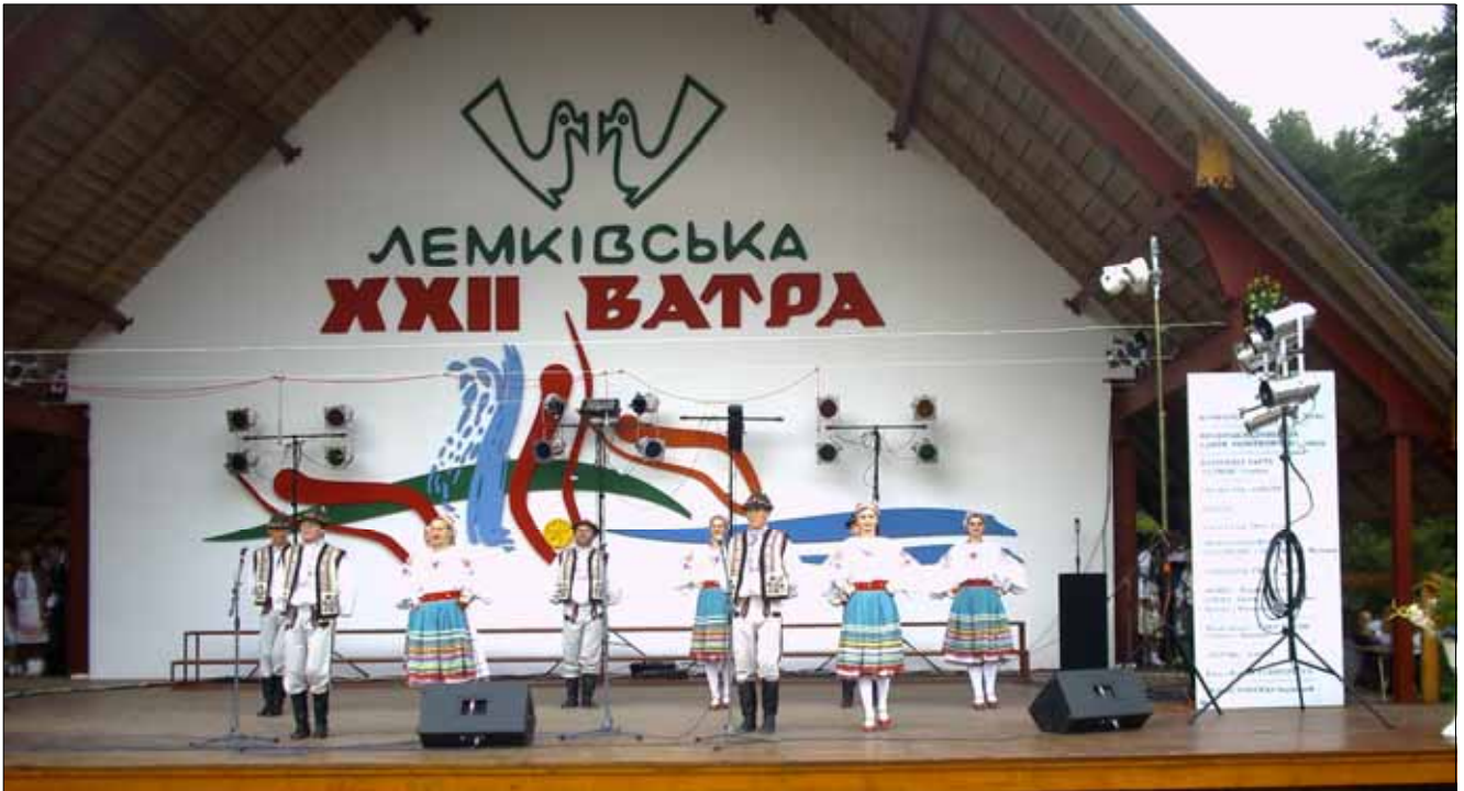
КУД "Яким Гарди" Петровци