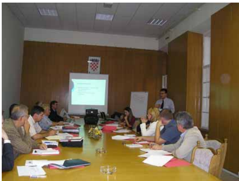
Medijska radionica u Osijeku

predstavnika i članova vijeća nacionalnih manjina.