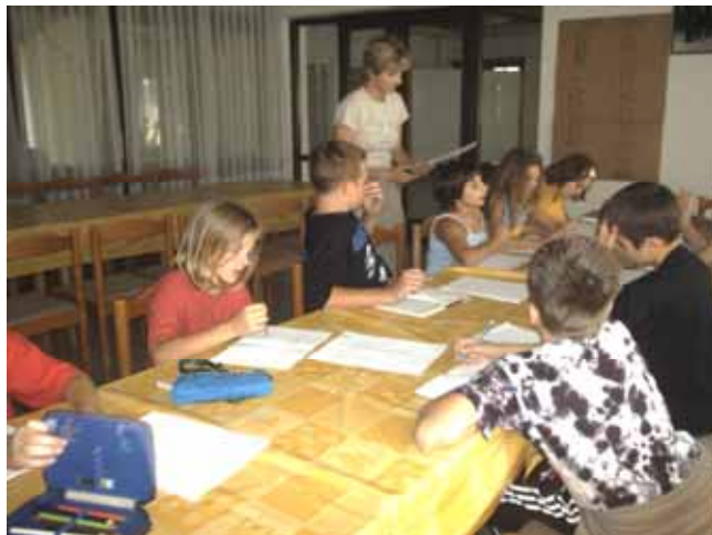
На Лєтней школи у Ораховици

Тоти два алинеї 6. члена сами за себе не гуторя вельо, медзитим кед ше погледа ширши толкованя и кед ше окончи ширша анализа значеня вец приходзимо до обсяжного толкованя вкупней активносци хтору би требала водзиц наша Рада. Конечно, и у плану роботи зарисане же ше Рада будзе намагац за цо швидше и успишнейше ришованє нагромадзених проблемох кед слово о пестованю руского языка и култури взагалї.