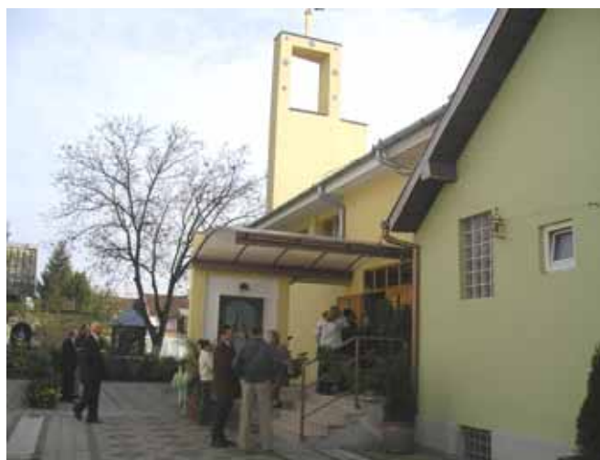
Пред церкву у Осієку