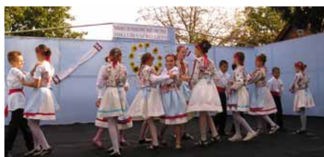
КУД "Яким Говля"