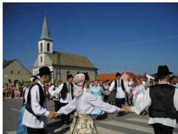
Руски танци у центру Пишкоревцох