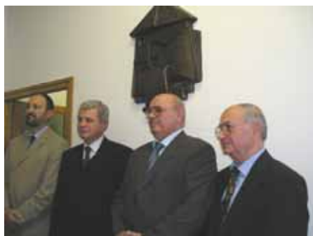
Після відкриття пам'ятної дошки

культурної ідентичності українців на просторах Хорватії.