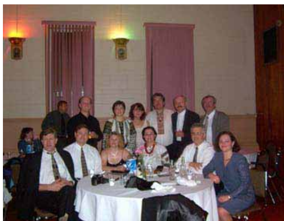
Частина учасників зустрічі