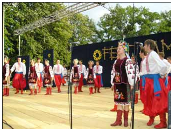
КПТ "Карпати" перед виступом і на сцені