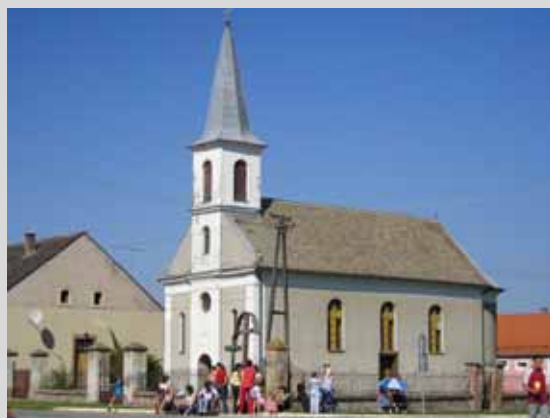
Церква св. Димитрія у Пішкоровцях