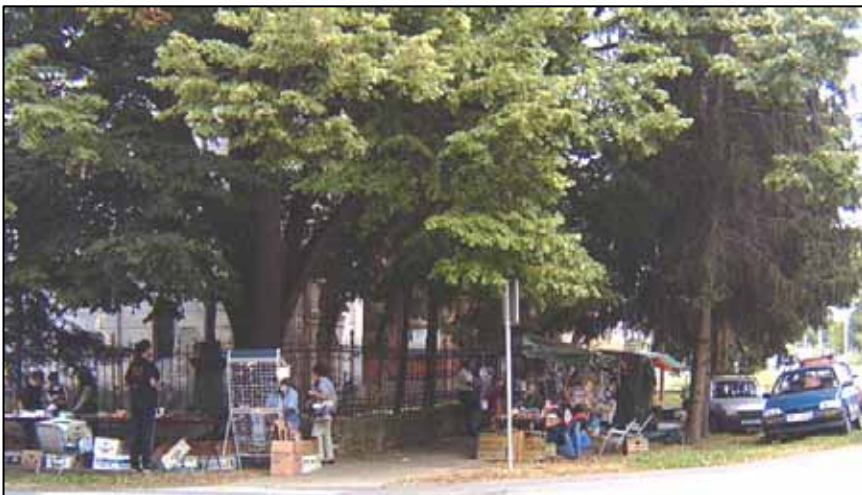
Кирбай у Миклошевцох