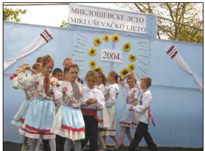
На Миклошевским лету того року