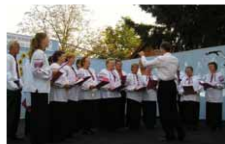
КПД "Иван Франко" Вуковар