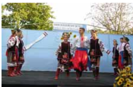
КПД "Карпати" зоз Липовлянох