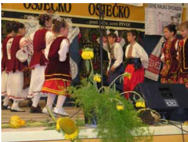
Нашо дзеци зоз Вуковару и Миклошевцох