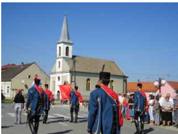
"Горватски сокол" и наша грекокатолицка церква у Пишкоревцох