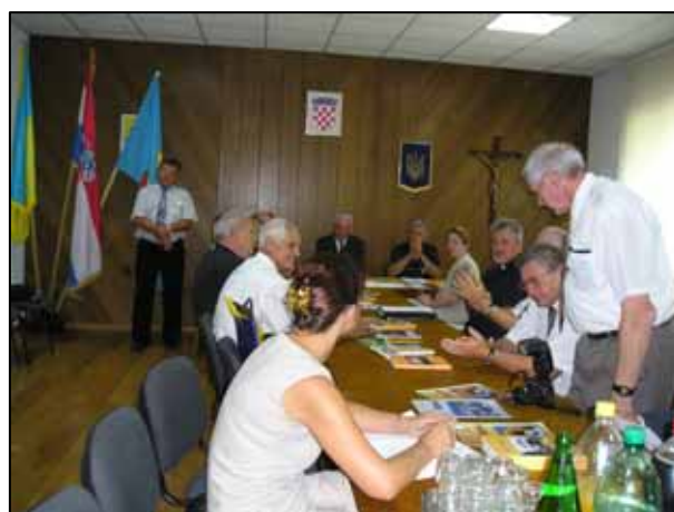
Круглий стіл "110-а річниця переселення українців до Липовлян"