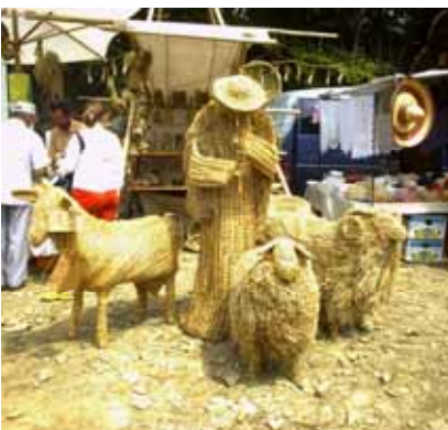
Сувенири зоз слами