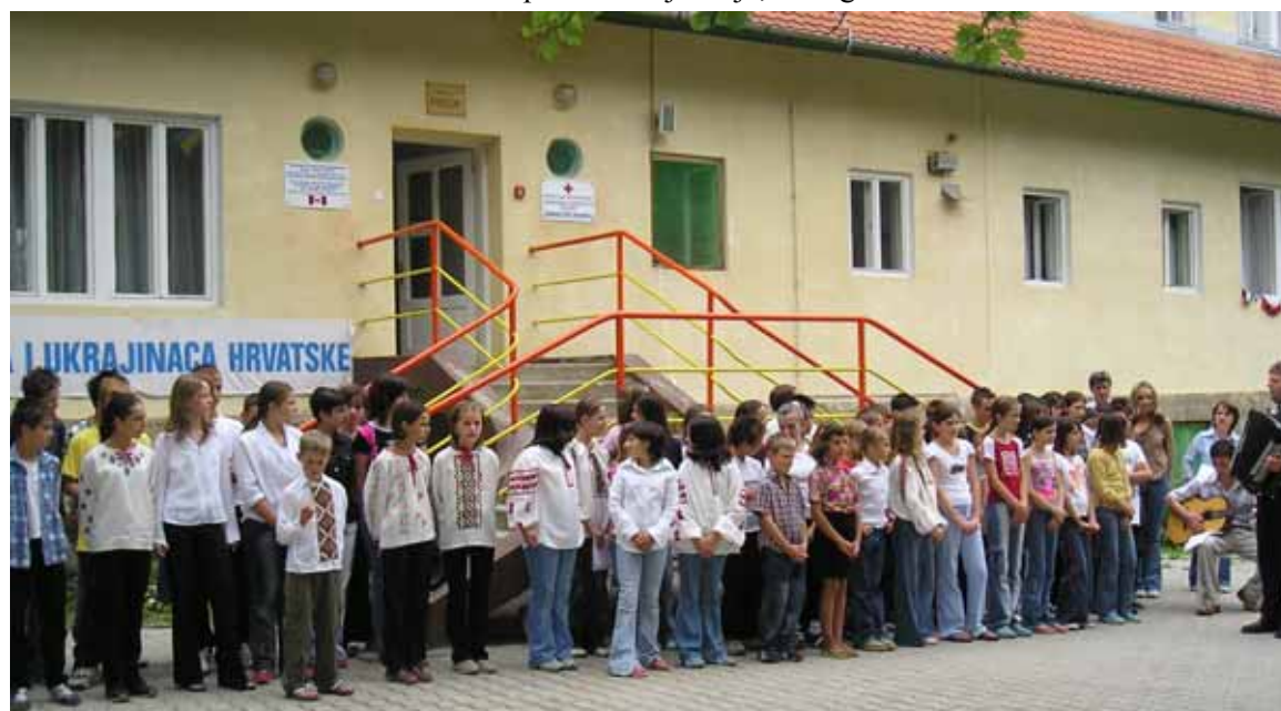
Sudionici Ljetne škole na svečanom programu

Ljetna škola održala se u organizaciji Saveza Rusina i Ukrajinaca RH, uz materijalnu potporu Ministarstva znanosti,