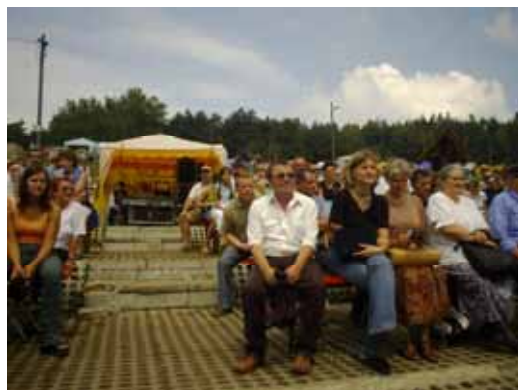
Публика зацікавлено провадзи програму