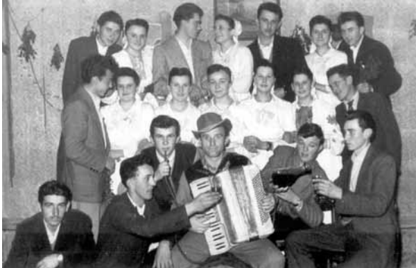
На прадкох, початком 50-тих рокох