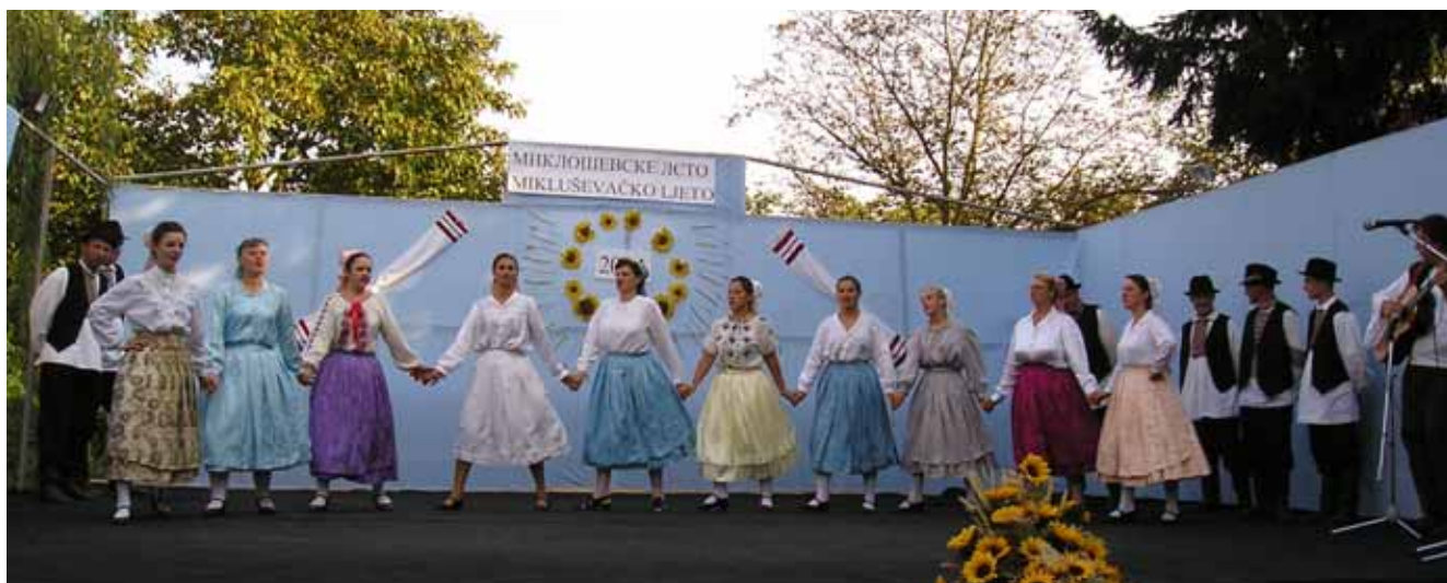
Ведно: КУД "Яким Говля" и КУД "Осиф Костелник"