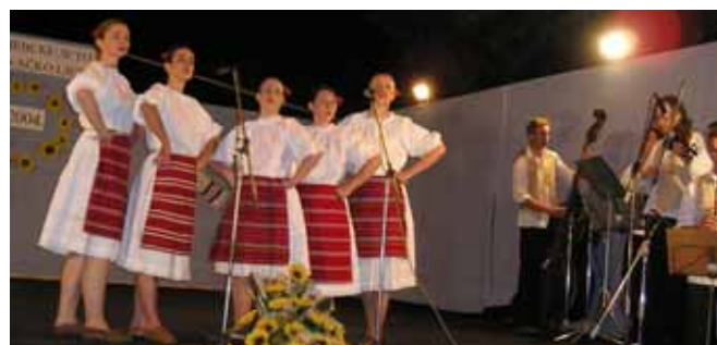
Шпивацка група РКПД зоз Нового Саду