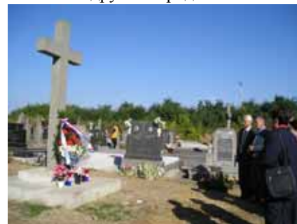
Покладанє венцох на миклошевским темєтовє

нє завадзало жє би зоз щирим кляпканьом наградзовали вредних аматєрох. На концу найповєме и тото. Тогорочна, трєца по шорє, культурна манифестация „Миклошевске лето ” у организационим поглядзє задоволєла, посцигло ше одредзєни уметніцки уровєнь. Вєлкє число патрачох було задоволєнє з виводзєньом, алє ше пред Организациони одбор наклада питанє чи то досц и цо трєба зробиц идущого року жє би вона задоволєла ширше пасмо любитєлєох культурного скарбу, насампредз Руснацох, а тиж так и других народох.