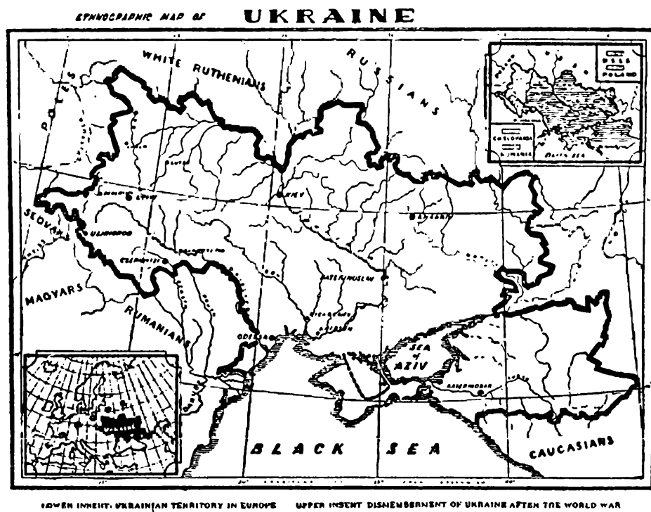
LOWER INSET: UKRAINIAN TERRITORY IN EUROPE UPPER INSET: DISMEMBERMENT OF UKRAINE AFTER THE WORLD WAR

Закінчення 1918. року і настання другого героїчного 1919. Нового Року зустрічав увесь український Нарід на сливе цілій своїй етнографічній території, у Вільній, справді Незалежній і Суверенній УКРАЇНСЬКІЙ ДЕРЖАВІ.