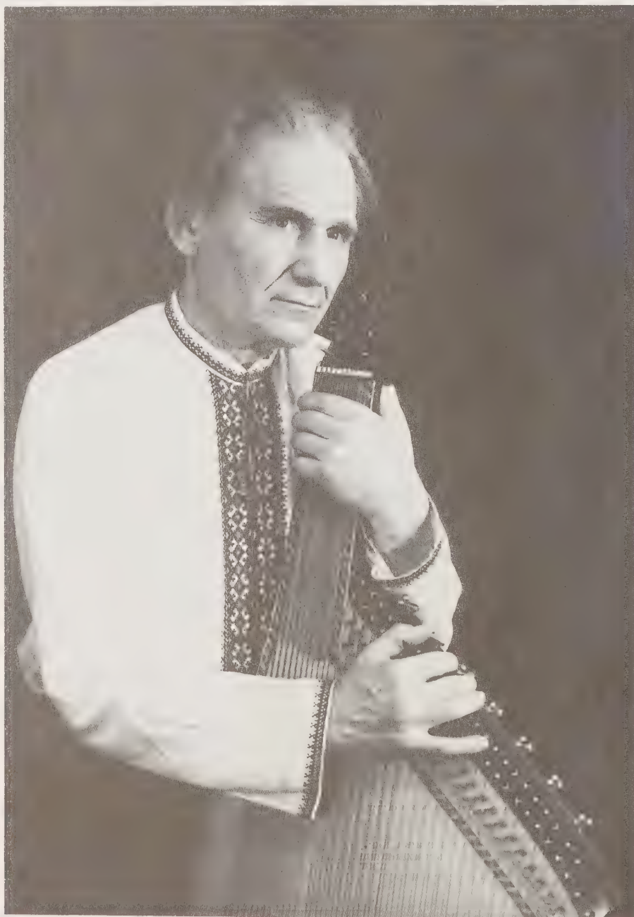
Заслужений кобзар Олексій Нирко. Ялта, Крим.

світського інструменту, а найголовніше, вони будили суспільну думку, своїми думками, казаннями і піснями, доходили до серця і розуму кожного, хто їх слухав, а, отже, підносили патріотичну самосвідомість народу більше, ніж будь хто. Як бачимо кобза-бандура була такою ж неодмінною супутницею козаків на Кубані, як раніше шабля, а кобзарські традиції, успадковані від Запорізької Січі і в новому краї не перевелися. Що правда, під впливом сильного імперського тиску, жорстокої асиміляторської політики кобзарська діяльність була на якийсь час пригальмована. Залишається лише дивуватися, як це мистецтво та його творці вижили за таких умов. Певно, мали в душі щось таке, що не вмирало. Такою великою, глибокою була їхня внутрішня творча енергія, таким неперборним було бажання бачити рідний край і свій народ вільним, що попри всі перешкоди і заборони, ризикуючи своїм спокоєм, а часто густо їм життям, вони несли своє мистецтво людям, підносили їхній дух, вселяли надію, відроджували і відроджувалися.