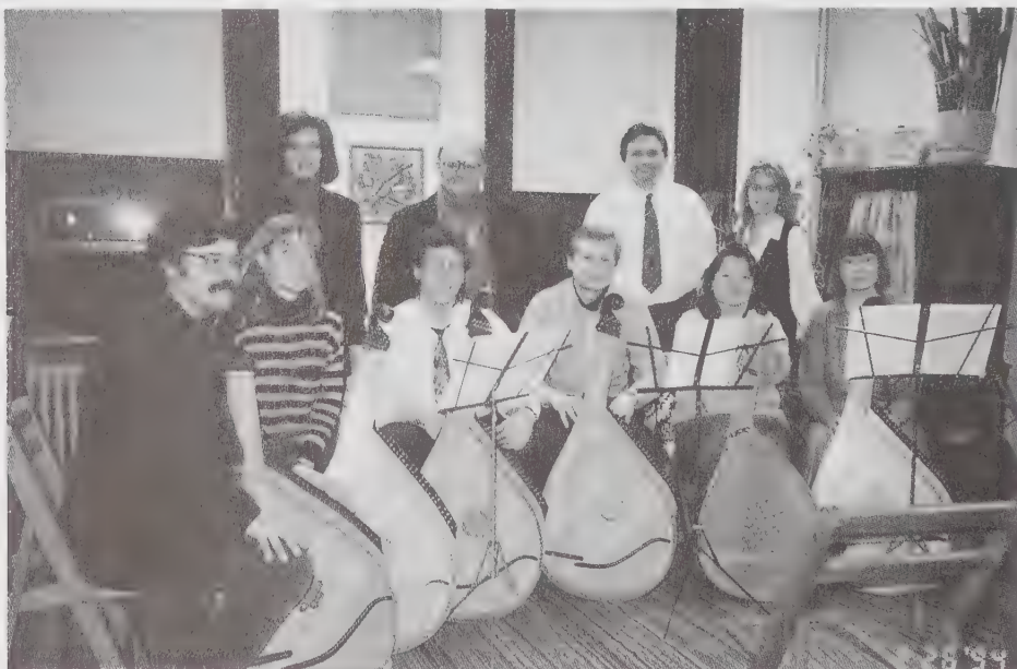
The Steppes BAndura Ensemble in performance.

These programs were made possible, in part, by a grant from the New York State Council on the Arts.