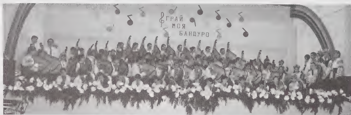
Юні бандуристи з Прудентополя вітали посла Бразилії в Україні українськими піснями.