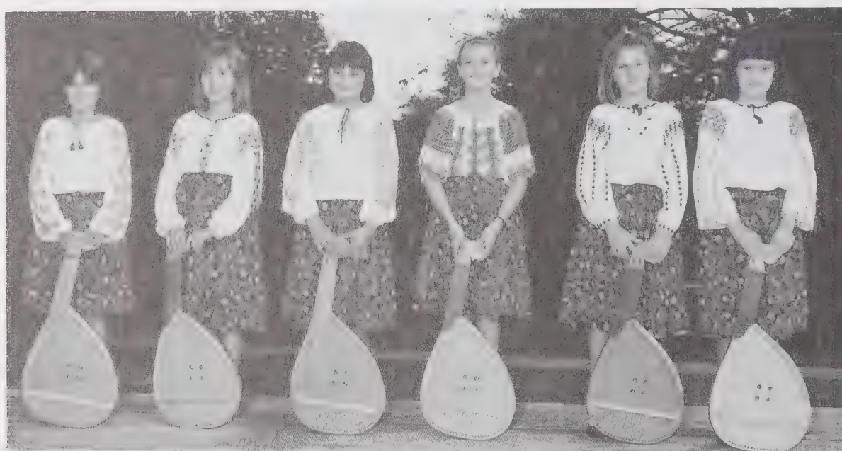
Частина ансамблю інтернату в Прудентополь, Бразилія.