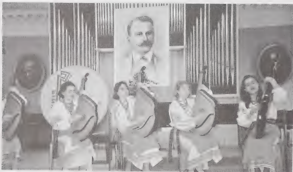
Ансамбль бандуристок з Польщі.