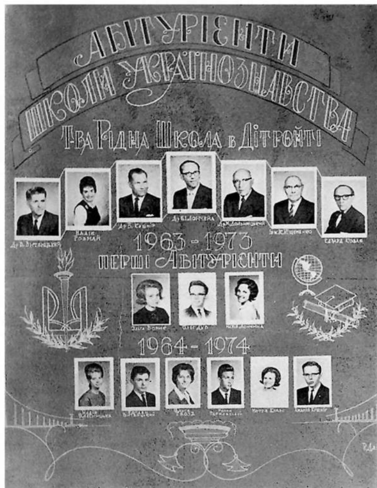
Абітуріенти Школи Українознавства Т-ва "Рідна Школа" в Дітройті 1963 і 1964 р.