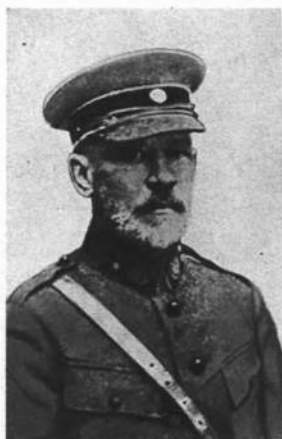
Начальник штабу, отаман (генерал) М. Юнаків.