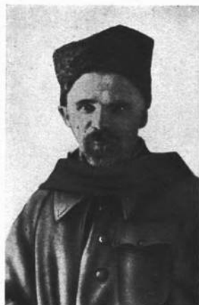
Командуючий Армією, отаман (генерал) М. Омелянович-Павленко.