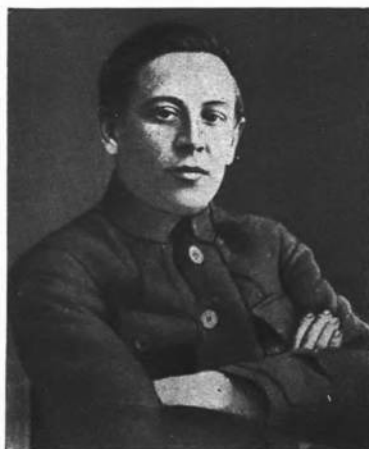
Голова Директорії і Головний Отаман військ У. Н. Р. Симон Петлюра.