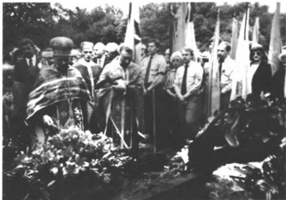
Духовенство православне і католицьке молиться за спокій душі сп.п. Ярослава

Вістку цю передав засобом масової інформації Провід ОУН. Німецьке Пресове Агентство ДПА повідомило, що "помер колишній прем'єр-міністр України, котрий був також головою Організації Українських Націоналістів і Президентом Антибольшевицького Бльоку Народів, проживши 74 роки. Згідно з інформаціями АБН, Стецько очолював Український Визвольний Рух, будучи близьким співробітником і майбутнім наступником Степана Бандери, котрий в 1959 році із доручення советського уряду був замордований советським агентом у Мюнхені". Текст пресового повідомлення ДПА перебрали німецькі газети "Зюддойче Цайтунг" і "Ді Вельт" з 7. 7. 86 і "Мюнхенер Меркур" з 8. 7. 86 р. Вони також підкреслили факт, що Ярослав Стецько карався в нацистському концтаборі Саксенгаузен за проголошення УССД Актом 30 червня 1941 р. Лондонський "Таймс" з 10. 7. 86 р. помістив поминальну статтю під заголовком "Ярослав Стецько, український екзильний провідник", де в яскравий спосіб представлено історично-державницьку постать Провідника. Повідомлення про смерть Ярослава Стецька подало теж агентство "Ассосієтєд Прес".