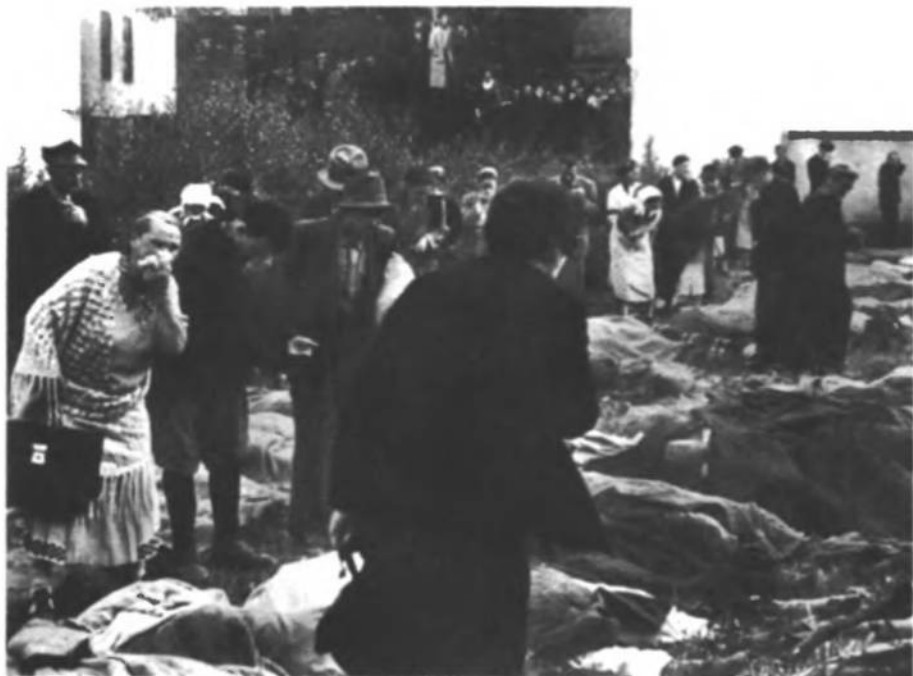
Львів. Після відходу московських військ в 1941 р. оціпілі шукають за рідними.

горій... Це було становище українських патріотів ієрархів і оборонців Церкви у справі Чину нації , який у той час революційна ОУН унаявлювала, мала відвагу взяти за нього відповідальність на себе. Це не наш капітал, це капітал усього українства, бо за нього вся українська спільнота-нація стояла, отже і Ієрархія, яка йшла з народом, записавши світлі сторінки культурного, а й національно-політичного розвитку нації. Нації, а не революційній ОУН вони віддавали свою дань.