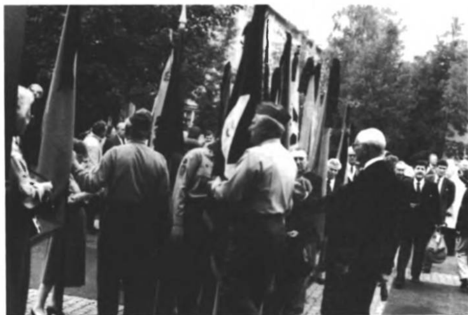
Сумівці готуються до походу на цвинтар