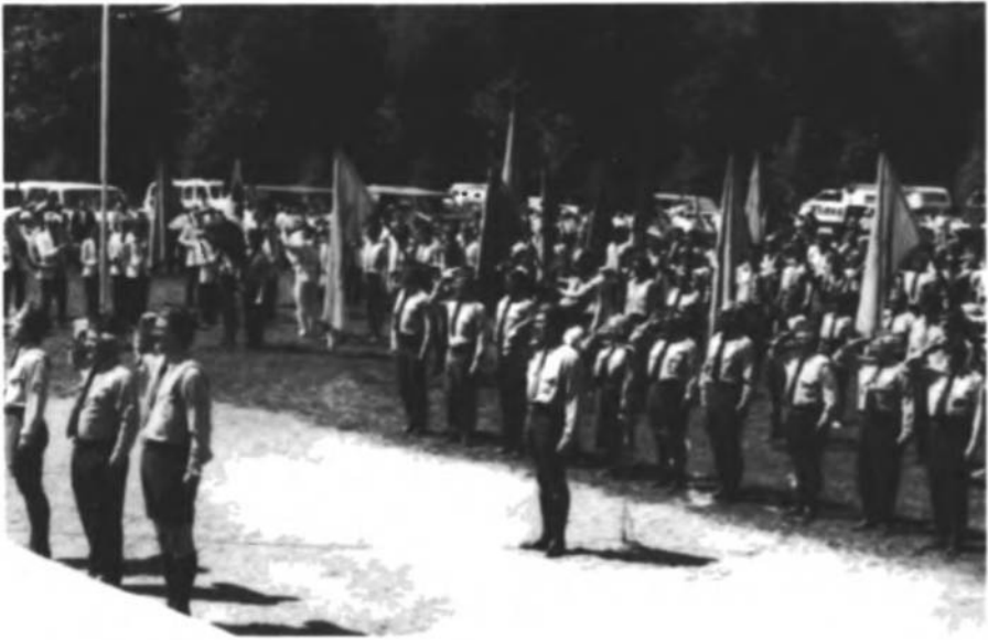
Салют синьо-жовтому прапорові.