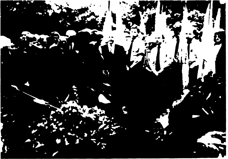
Дост. п-і Слава пращає вірного друга життя

гістю. В день похорону прояснилося і соняшне проміння райдужним світлом наповнило цвинтар-парк "Вальдфрідгоф", що в своєму лоні дав притулок тлінним останкам Провідників Степана Бандери і Степана Ленкавського, а тепер у цей соняшний день тисячна жалобна громада відпровожувала на вічний спочинок свого незабутнього Провідника, Державного-Мужа-Револуціонера й Людину-Мислителя, що все своє життя віддав на вівтар служіння Богові і своєму Народові. З хрестом на чолі походу залопотіли десятки прапорів на вітрі, а 120 вінків викликали подив у чужинців, які запитували, чи то ховають "генерала". Численні сумівці в одностроях і сивоволосі комбатанти в своїх військових шапках, котрі займалися порядковою службою і творили почот при домовині, мабуть, наводили на цю думку.