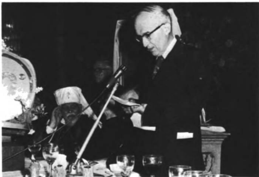
Я. Стецько промовляє на честь Патріярха Йосифа

умовах неволі, експлоатована сила боротьби молоді поневолення націй необчислима. Коли час дозріє й ріст революційних процесів досягне зеніту — експлозія революції розірве російську імперію і комуністичну систему і на руїнах їх запанує кожна нація зі своєю вірою в Єдиного Бога і таким соціально-політичним та внутрішньо-державним ладом, як це вирішать демократичним способом самі народи. Новий справедливий лад у світі буде побудований на мережі національних держав в їхніх етнографічних кордонах без загарбання чужих земель. Час імперій минув, прийшов час національних держав. Свідомством цього є ОН, де маємо понад півтора сотні нових членів. Це процес диференціації світу, а не насильної уніфікації. Це мозаїка різних націй, народів, держав, це мозаїка різних культур, бо лише той шлях допровадить до всесвітньої культури людства — коли будуть вільні від імперіяльного гніту народи-нації у своїх власних демократичних державах, а вільні творці розбудовуватимуть національні культури, з яких складається культура людства.