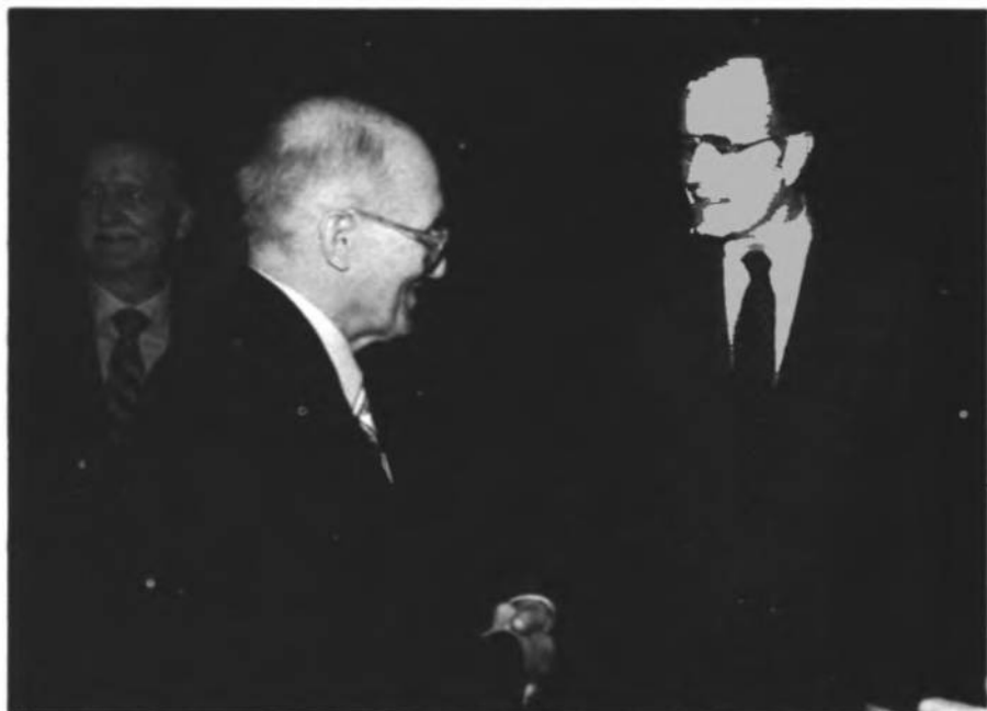
Дост. Я. Стецько в Білому Домі вітається з Джорджем Бушем