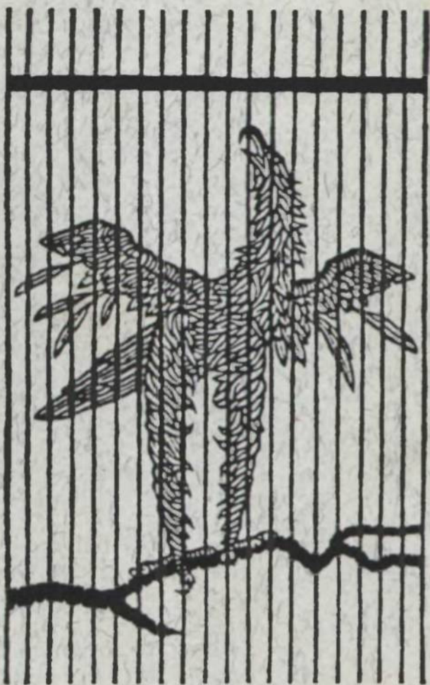
Гніздовський: Орел в клітці