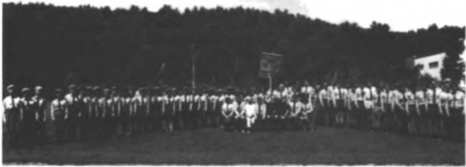
Вишкільний табір 1986 з Владикою Василем Лостенем.

Духовий вимір був представлений офіційною маніфестаційною програмою з Архиерейською Службою Божою та Панахидою за Поляглих Героїв, як і центральною доповіддю про цьогорічні річниці. Проповідь, промова Голови КУ СУМ-А, та привітання гостей мали в собі зерна патріотичного усвідомлення і унапрявлення, які дали досить духової поживи для кожного зацікавленого. Сама присутність Владики і численних гостей були визначним для Східної Української Мислі, що вона знаходиться на черговому етапі росту, засвідченому цього літа великим зростом сумівських таборів та великою участю уніформованої сумівської молоді, яка прибула з 21 Осередків з ЗСА та з Канади. КУ СУМ-А бажаємо дальших успіхів та бажаємо, щоб чергові Всеамериканські Здвиги бачили ще більш численні лави СУМ та громадянства, як запоруку майбутньої сили громади, об'єднаної і цілеспрямованої в своїй визначеній меті — здобутті УССД.