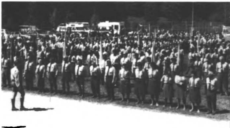
Вид на частину уніформованих учасників XXXV. Всеукраїнського Здвигу.