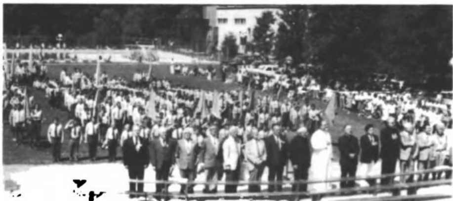
Вид на частину Почесної Президії і уніформованих учасників.