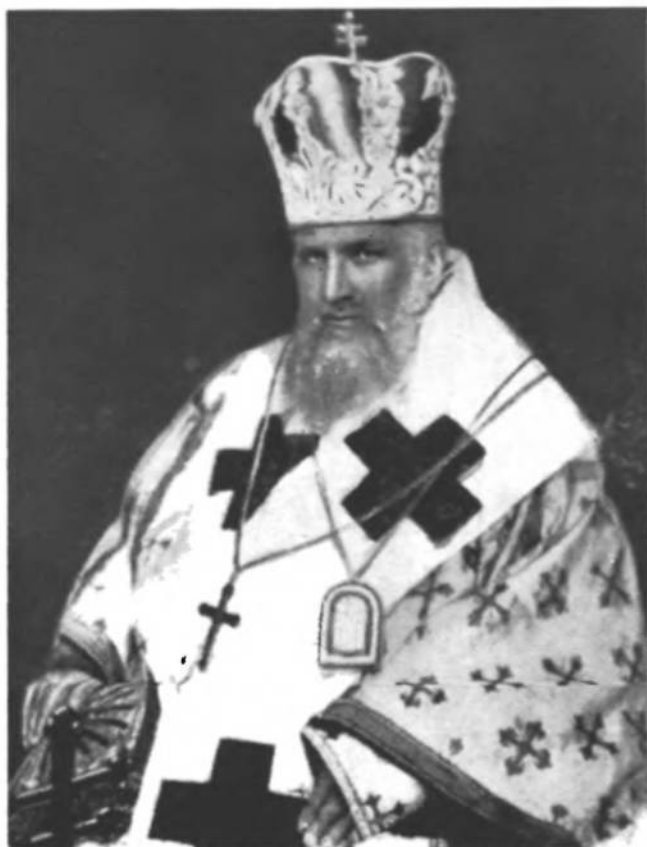
Митр. Андрій Шептицький

Актом 30 червня 1941 р., коли вже німці зайняли виразно негативне становище до Акту. Це був дійсно суверенний, власнопідметний акт нашої православної Ієрархії, нашої Православної Церкви, яка осталася вірною традиціям св. Софії і її захисникові — "Запорізькій Січі", — цієї Української Мілітарної Християнської Республіки, єдиного Християнського, Православного Мілітарного Ордену, славнішого за орден Мальтійський! Репрезентанти св. Софії і св. Юра стояли за наш, за нації Чин.