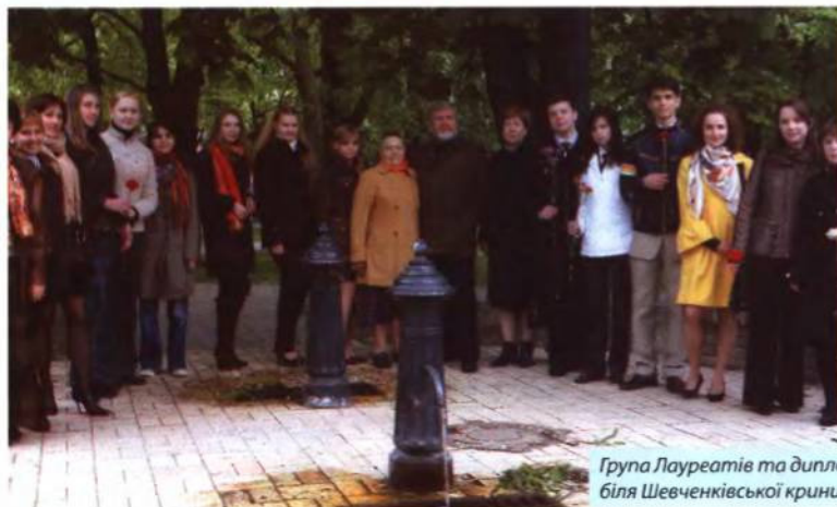
Група Лауреатів та дипломантів біля Шевченківської криниці. Мінськ, 2009 р.