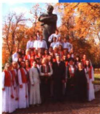
Хор «Світоч» біля пам'ятника Великому Кобзареві. Мінськ, 2008