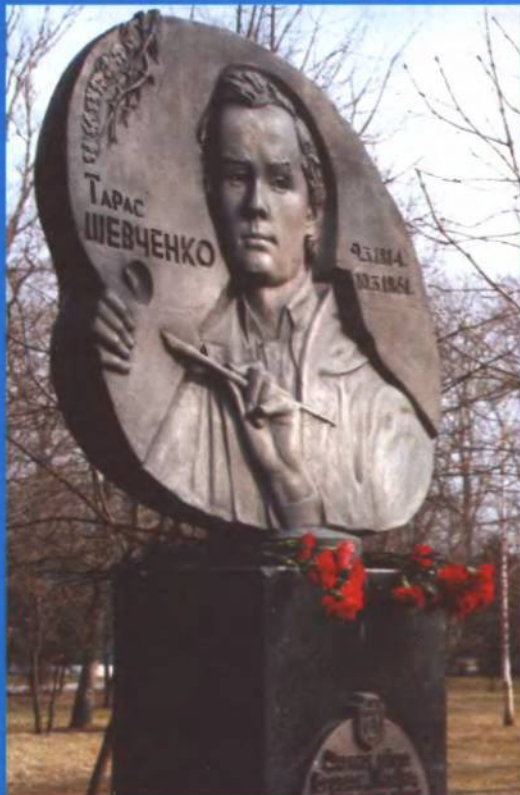
Перше погруддя Т.Г. Шевченку. Встановлене в м. Слуцьк, Білорусь.

БЕЛАРУСКАЕ ГРАМАДСКАЕ АБ'ЯДНАННЕ УКРАЇНЦАЎ «ВАТРА»