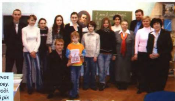
Молодь, котра вивчає українську мову. Палац дітей та молоді. 2008/2009 навчальний рік