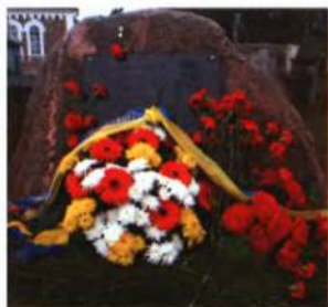
Квіти у пам'ятного знаку Пилипу Орлику від Посольства України в Республіці Білорусь. Село Косу́та, 2007 р.

З 2002 року діє громадська комісія по увічненню пам'яті Пилипа Орлика — творця першої конституції України, коліска якого — село Косу́та Вілейського району. Члени громадської комісії «Заповіту» першими відкрили шлях до села Косу́та. За їх ініціативою, підтримкою та участю Вілейських міського виконкому, районної Ради депутатів, Посольства України в РБ установлено Пилипу Орлику пам'ятний знак в селі Косу́та, відкрито вулицю його імені в місті Вілейка. Проведені історичні читання до 300-річчя ухвалення першої конституції України. Проводяться «Дні українського співу», конкурси, присвячені пам'яті Пилипа Орлика — сина двох братських народів.