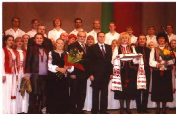
Відкриття «Днів українського співу», присвячених Дню Матері, Покрови присвятої Богородиці та пам'яті П. Орлика. Білоруський державний медуніверситет. Мінськ, 2008 р.