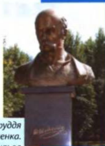
Погруддя Т. Г. Шевченка. Місто Могильов

Книги, підготовлені та видані членами МГОУ «Заповіт» за фінансової підтримки Уповноваженого у справах релігій та національностей, Посольства України в Республіці Білорусь