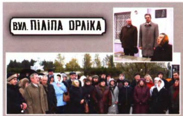
До 335-річчя від дня народження П. Орлика на його честь відкрито вулицю в м. Вілейка. 2007 р.

Під час Великої Відчизняної війни в боях за синьооку Білорусь полягли тисячі воїнів різних національностей, серед них сини і доньки Шевченківської землі. Серед них – 129 героїв, імена яких увічнено в назвах білоруських сіл, міст, вулиць, про їх подвиги видано книгу «В пам'яті народної – навечно».