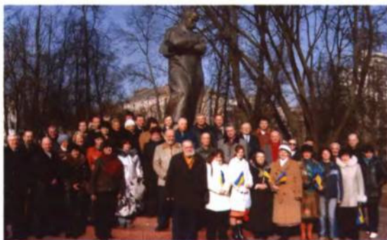
Традиційно в день народження Т. Шевченка українці столиці приходять до пам'ятника великому поетові України