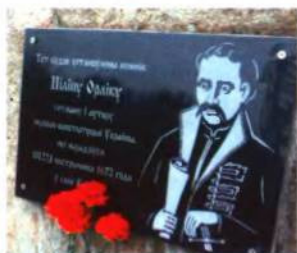
Пам'ятний знак, установлений Пилипу Орлику в с. Косу́та, 2006 р.

З 2002 року діє громадська комісія по увічненню пам'яті Пилипа Орлика — творця першої конституції України, коліска якого — село Косу́та Вілейського району. Члени громадської комісії «Заповіту» першими відкрили шлях до села Косу́та. За їх ініціативою, підтримкою та участю Вілейських міського виконкому, районної Ради депутатів, Посольства України в РБ установлено Пилипу Орлику пам'ятний знак в селі Косу́та, відкрито вулицю його імені в місті Вілейка. Проведені історичні читання до 300-річчя ухвалення першої конституції України. Проводяться «Дні українського співу», конкурси, присвячені пам'яті Пилипа Орлика — сина двох братських народів.