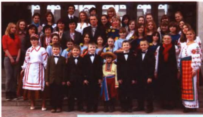
Учасники I Шевченківського конкурсу з Послом України в РБ І. Ліховим. Мінськ, 2009 р.

По ініціативі «Заповіту» був організований I Шевченківський конкурс серед учнів середніх та художніх шкіл, гімназій м. Мінська, який отримав широкий резонанс серед громадськості та молоді столиці. В конкурсі прийняли участь більш ніж 2000 учнів. 47 стали дипломантами, одержали нагороди.