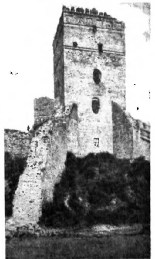
Луцьк. Замок — Східна Башта

живає після Другої світової війни тяжку кризу. Англія має великі борги. Продукція в Англії заслаба, щоб забезпечити Англію достатньо. В цей час прийшла тяжка вугільна криза, що припинила працю в багатьох фабриках. Індійський уряд уже вислав свого дипломатичного представника в Америку. Президент Трумен його прийняв. В Палестині дійшло до дальших заворушень. Жидівські терористи зробили цілий ряд нових атентатів. Причиною для останніх терористичних виступів було перехоплення англійського корабля „Хайм Арлозоров“ з 1.300 нелегальними переселенцями. Корабель їхав з якоїсь пристані в Чорному морі, контрольованої советами. 13. березня в Єрусалимі відбудеться сіоністичний конгрес, що має рішати про дальшу жидівську політику. Щоб якось упорядкувати відносини у Палестині, Англія рішила передати палестинську справу загальному зібранню ООН у вересні.