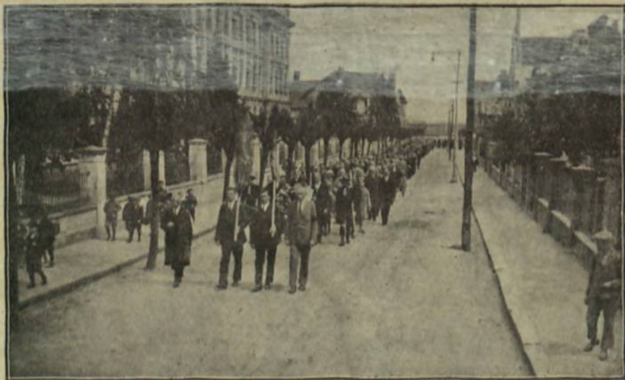
ЖАЛІБНИЙ ПОХІД У ПОДЪБРАДАХ

свідків обвинувачення, цивільної сторони і оборони. Така процедура надзвичайно ускладнила слідство і допит свідків. Адвокати посилаються на документи, яких ще не оголошено, та на свідків, яких ще не допитано, стверджують або відкидають факти і події, які ще не доведено або не відкинуто. В цьому процесі, коли вже й без того цивільна сторона поставлена в тяжке становище, тим, що вбивця обороняється обвинуваченням своєї жертви у погромах, отакі постійні репліки, сварка і зайві промови адвокатів надзвичайно шкодять повному виясненню справи. Особливо зловживає цим оборонець Торес. Він мало не що раз, як робить репліку, потрясає перед суддями і публікою якимись документами і ричить, що С. Петлюра є винний, бо він був диктатором, бо він наказав робити погроми, бо він дякував Самосенка за Проскурівський погром, бо він свої накази про заборону погромів та про кари погромщика писав лише для Європи, а дома наказував робити погроми. Кричить так, ніби все це вже остаточно доведено. Тим часом нічого ще не доказано і не може бути доказано, бо це все є ганебна брехня і наклеп. Не можна не зазначити також тих труднощів, які доводиться поборювати тим з наших свідків, що не знають французької мови та примушені давати свої зізнання через перекладача, не розуміючи навіть, що свідка питають і що з приводу його слів говорять (таких свідків, що нічого не розуміють на щастя наше, всього кілька чоловік).