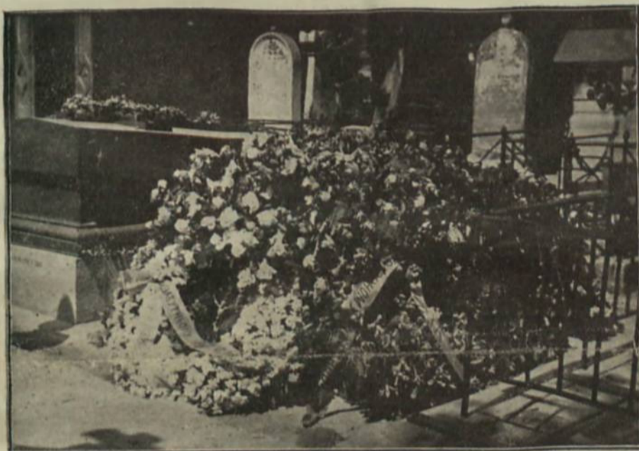
МОГИЛА СИМОНА ПЕТЛЮРИ