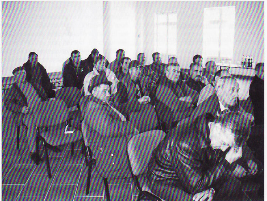
Учаснїки першей схадзки на хторей продукувателе були упознати зоз проєктом системи за наводньованє

восц и перспективу розвою заградкарства, вецейрочних культуροх, ловного и риболовного туризму.