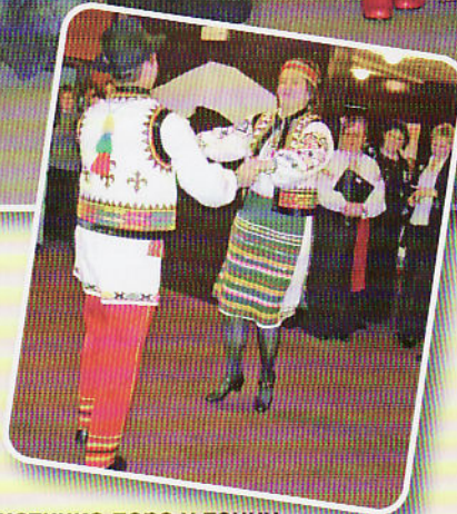
Солистичка пара у танцу – буковински свадзебни