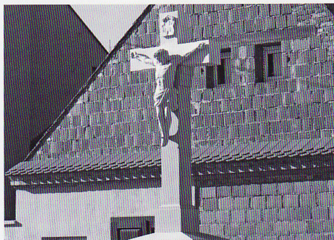
Бетярски криж у Вуковаре