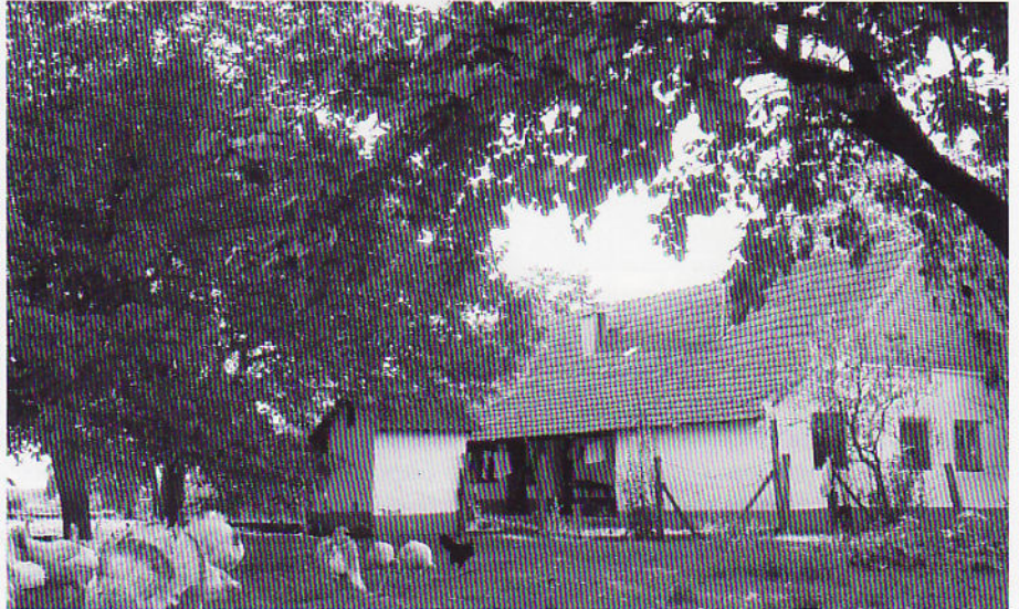
Найвекше число приселених Руснацох ыло по салашох андашевского и роковского хотара

Руснаци у новим штредку свою школу и грекокатолицку парохию нїгда не мали. Ходзели до тедишней штирикласней основней школи дзе ше настава одвивала на горватским або