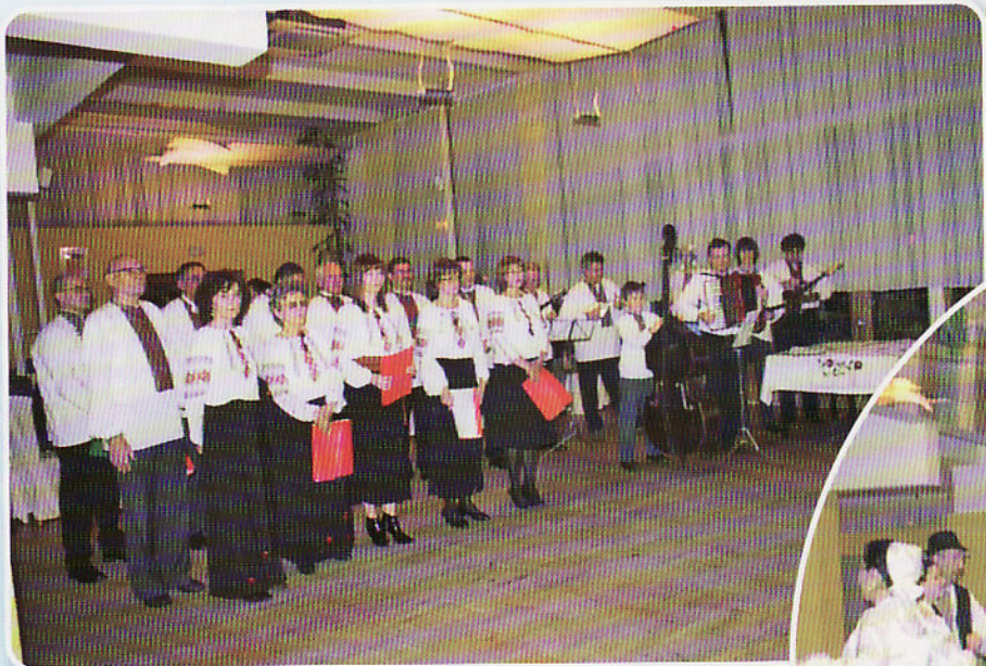
Хор и оркестер КПД Русинох и Украинцох Осек

Попри смачней вечери, богатей томболи и танцу шерца, госци мали нагоду уживац у прекрасней музики „Микс бенду“ зоз Руского Керестура, котри на