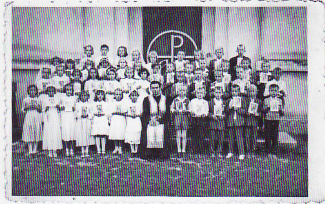
Так було далеких 50-их років минулого століття. Перше Святе Причасття в парафії Козарац.

«Мої дитячі й дівочі роки проходили так, як на той час в усіх наших людей: праця коло хати, в полі, відвідини церкви... Коли ми були малими, ходили на Новий рік засівати, на Різдво колядували, щедрували. Інакші тоді були часи. Запам'яталися різні події, часом дуже прикрі й нещасні. Про деякі розкажу. Гарно було в нашій чатальні при церкві. Люди передплачували «Рідне слово», з Галичини доходили релігійні часописи. Запам'яталася подія, коли, здається, 1933 року, помер Данило Барщевський. Його вважали нашим «патріархом», бо була в нього дуже велика родина. Його шанували, бо був паломником до Святої Землі 1906 року під проводом Митрополита Андрея Шептицького. На похо-