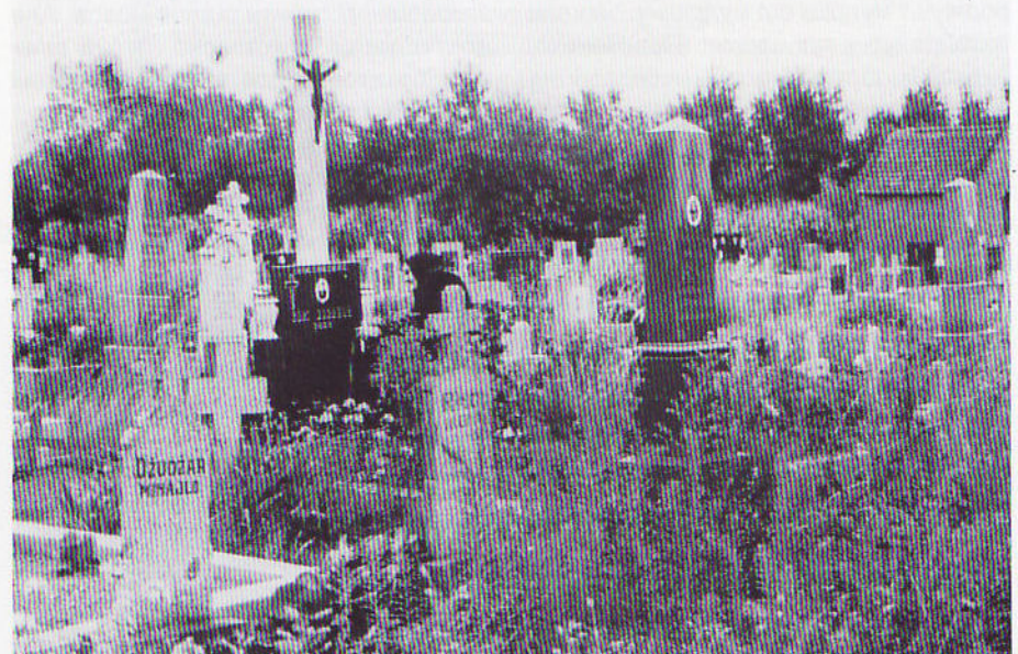
Часц теметова у Андрашевцох дже поховане найвекше число Руснацох