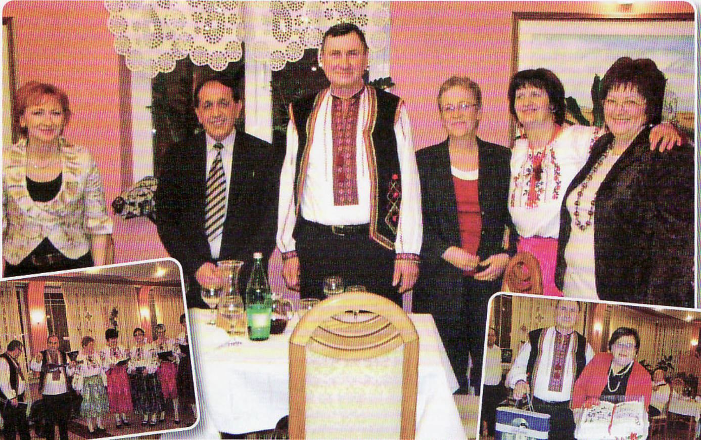
Женска часц ансамблу

госци у розгварки зоз Соборским заступніком