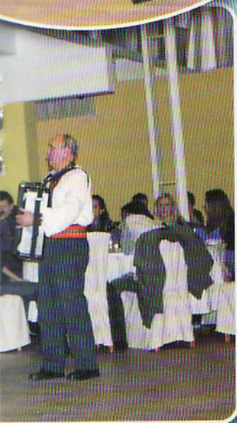
пом фолклорних ансамблех