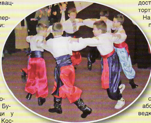
Наймладши танцоше–сами хлапци