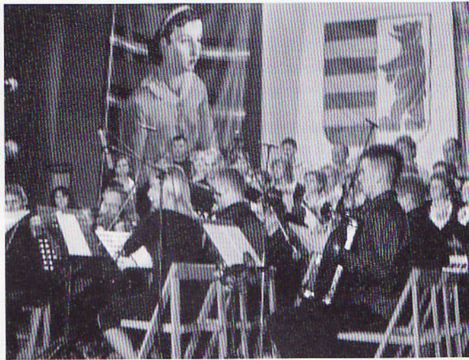
Национални оркестер провадзел шицких учашнікох на академії