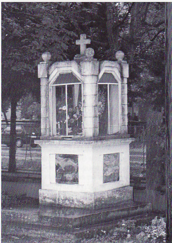
Каплічка у церковним дворе

В истати, стари 2009 рок при концу, а швидко гуньюму крача нови 2010 рок. Так приходза и нашо християнски швета Крачун, Нови рок, Трокралі... Же би шицко прешло у мире зоз Богом, людзми, але и самим собу, було ше потребне висповедац. У Петровцох, остатней недзелі пред Крачуном покончена крачунска споведз. Висповедали ше и Святу причасц прияли векшина рухомих вирнікох. Вирніки хтори пре старосц, або хороту нерухоми, а мали ше дзеку висповедац, паноецц обишол у их доме.