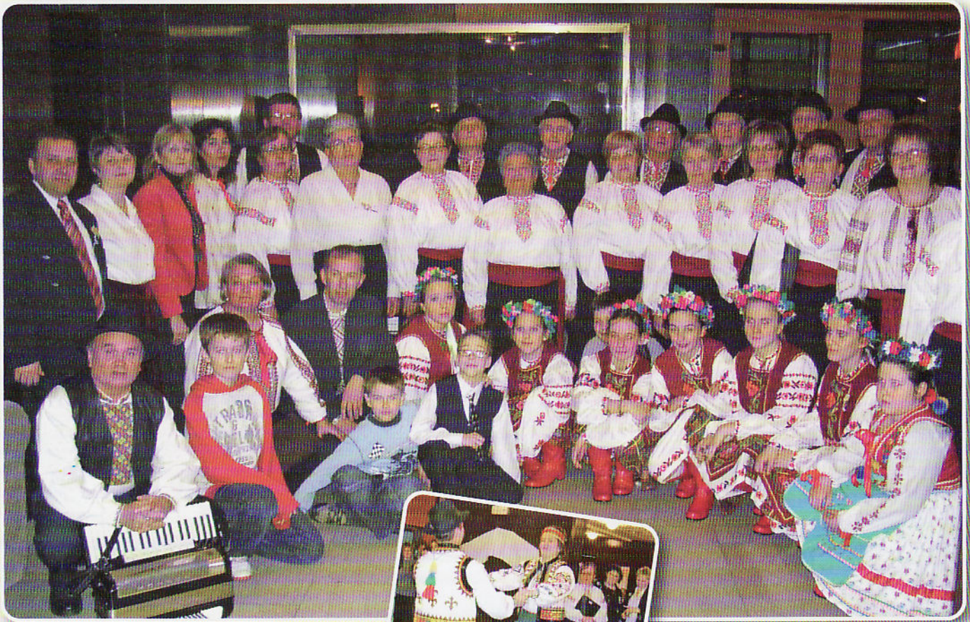
Знімка за паметане