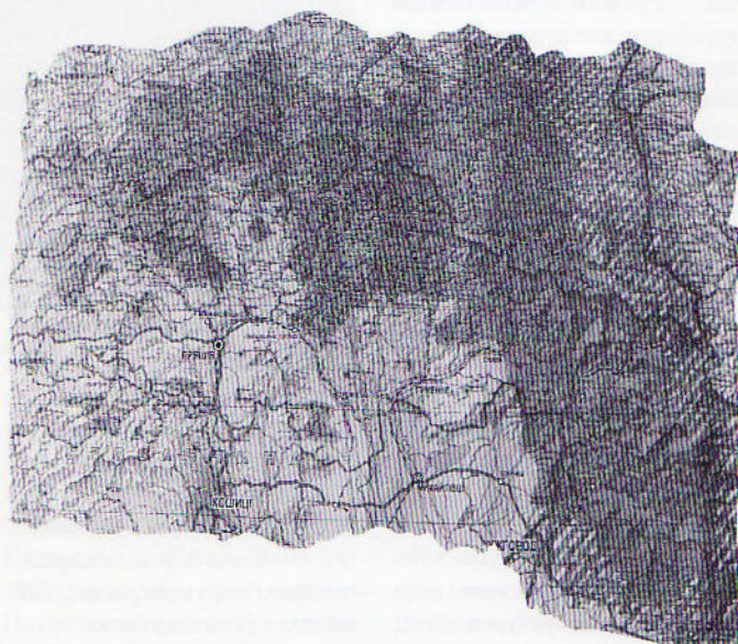
Мапа Лемківщини, Свеукраїнське товариство «Лемківщина», Львов, 2008

Русини найзаходнейших часцох Карпатох, (Нїзких Бескидох) пре свою специфичну славянску бешеду и часте хаснованє словака «лем» у своей бе-