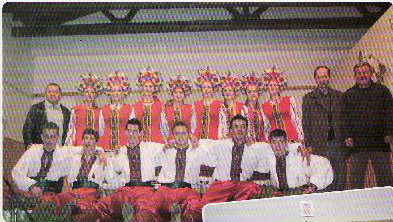
Članovi ansambla KUD "Andrij Pelih" iz Šumeća