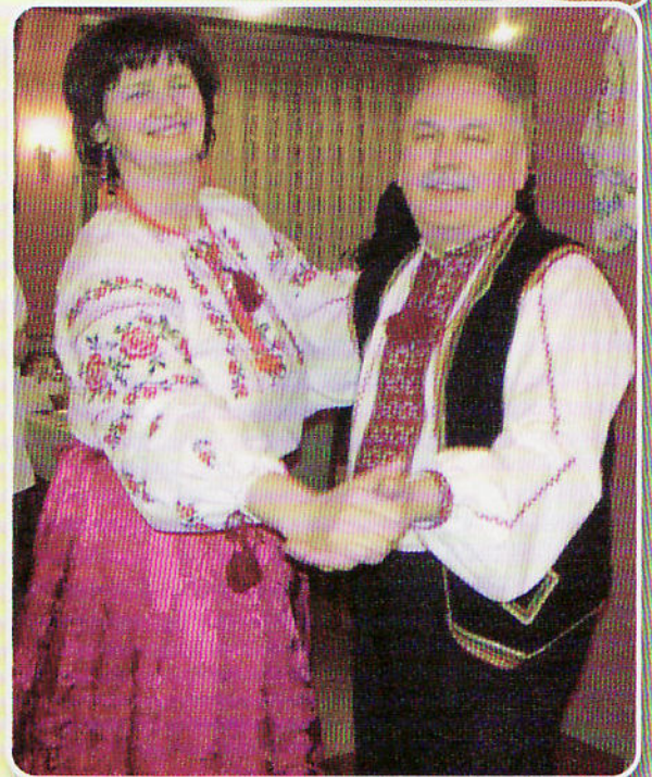
Руске облечиво як чесц