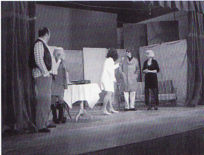
Зоз представи Гайде да ше сексае

После длугошого часу у Петровцох з роботу почала и дзецинска драмска секция. Дзеци през зиму отримовали проби же би 23. януара дали премиеру драмского фалата „Перша любов“. Старша драмска секция уж по традицији робела на пририхтованю нового драмского фалата, так же Петровчане мали нагоду 31. януара видзиц и пре-