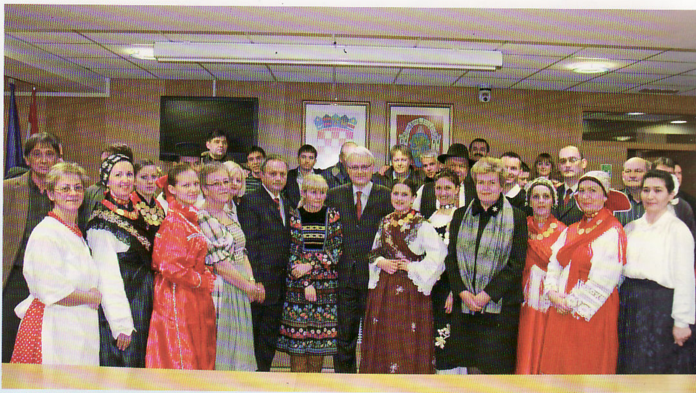
Ivo Josipović s predstavnicim Gradske uprave Vukovar i s predstavnicima GKUD-ova

Predsjednik RH I. Josipović posjetio gradonačelnika Vukovara i bio na kavi s Vukovarcima