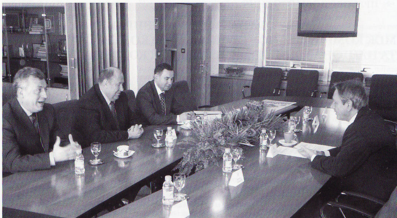
Делагація у Вуковари

Учетвер, 28 січня 2010 року Надзвичайний і Повноважений посол України в Республіці Хорватії Борис Зайчук зі своїм заступником Анатолієм Чернишенком побували у Вуковарі, де зустрілися з міським головою Жельком Сабо і його заступником Жельком Пінюхом та представниками української національної меншини.