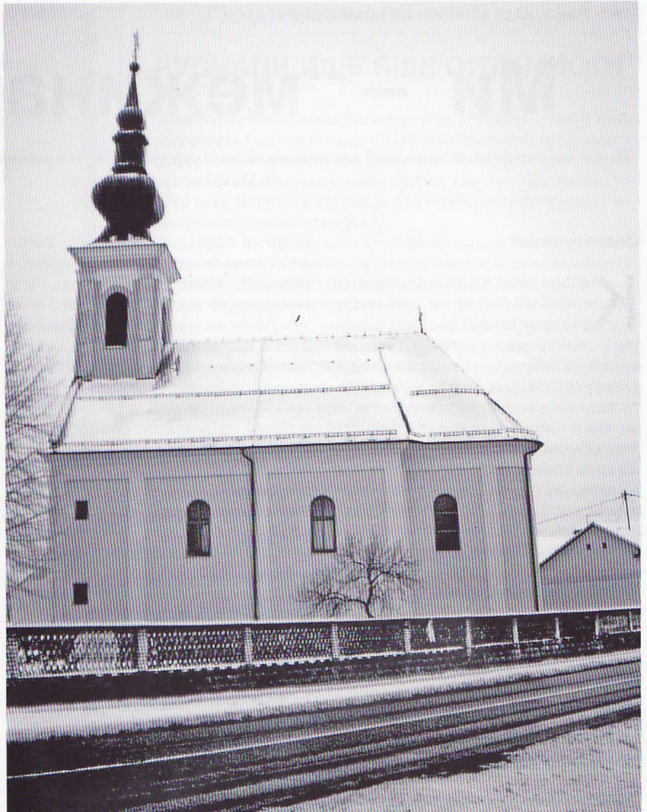
Римокатолицка церква у Роковцох до хторей на Слунбжу Божу одходюели Руснаци ю того подруча