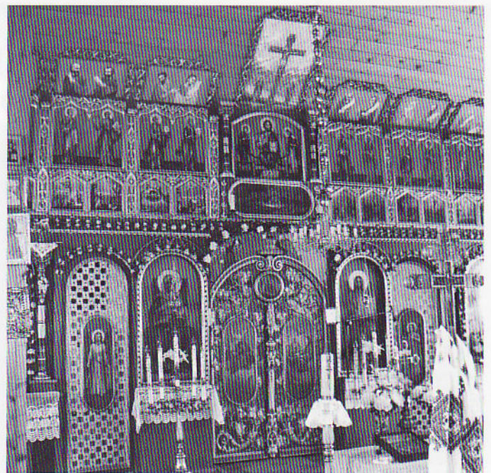
Іконостас Правослацней церкви у Зиндрановє на Лемківщини

На Лемковщини ше не могло жиц од індустрії, бо є у