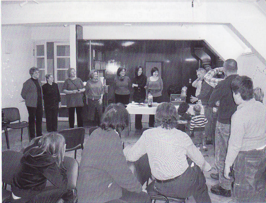
Весела атмосфера святкування Різдва

Кінець 2009 року для товариства „Калина” із Рієки видався напруженим. Початком грудня весь католицький світ почав готуватися до святкування свого Різдва Христового, і як водиться вже роками, в цей час посилюється активність всіх людей які відзначають цю подію. Це час багатий на виставки художників і концерти різноманітних груп, ансамблів і хорів.