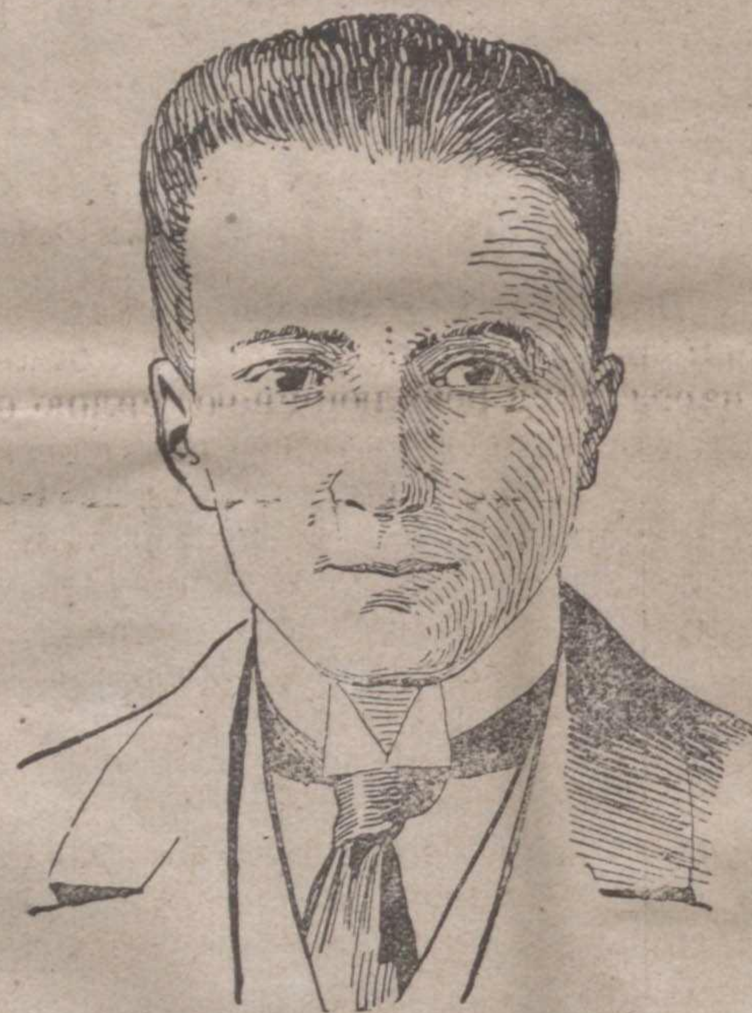
Олександр Керенський. Теперішній міністер справедливості й посол із Саратовщини.

НАША ДОЛЯ, ДОЛЯ НАШИХ ДІТЕЙ В НАШИХ РУКАХ! ХАЙ НІХТО не відмовить ся віддати СВОГО ПІДПISУ!