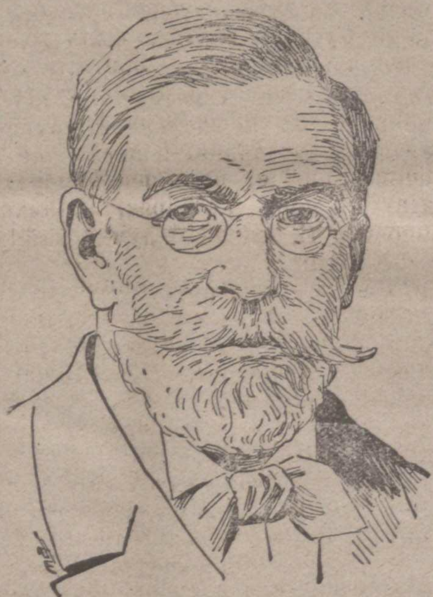
Павло Мілюков. Теперішній міністер заграничних справ і посол із Петербурга.