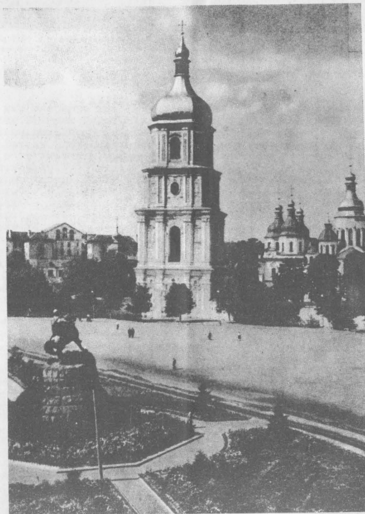
Софійська площа і пам'ятник Богданові Хмельницькому в Києві

Цей собор з площею і пам'ятником Б.Хмельницькому є свідками різних великих і малих історичних подій—маніфестацій, військових парадів та ін.