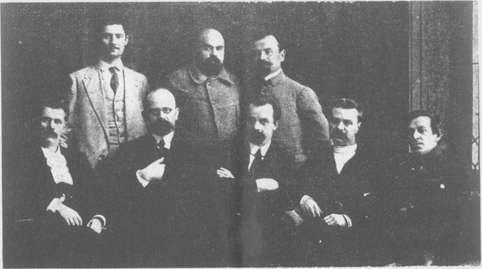
Перший Генеральний Секретаріат (Уряд) Української Центральної Ради в 1917 році. Сидять справа на ліво: Сизон Петлюра, С. Єфремов, В. Вишницько, Х. Барановський, І. Стешенко. Стоять: Б. Мартос, М. Стасюк, П. Христюк.