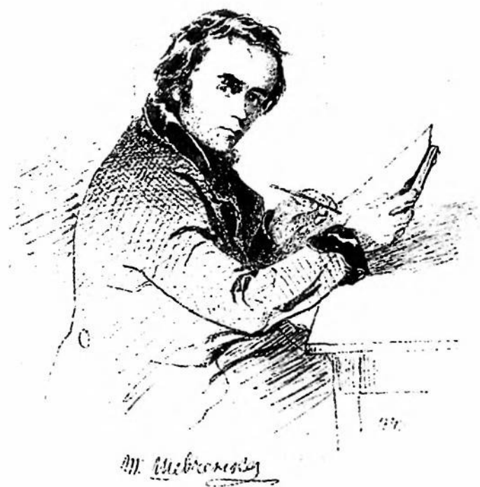
АВТОПОРТРЕТ Т. ШЕВЧЕНКА