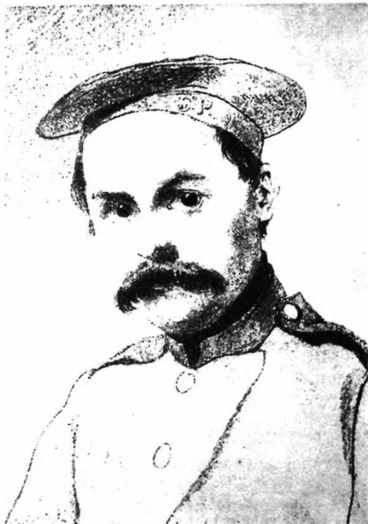
ПРАВДОПОДІБНИЙ АВТОПОРТРЕТ Т. ШЕВЧЕНКА