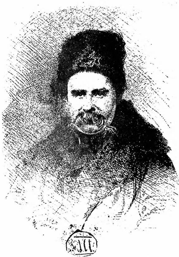
АВТОПОРТРЕТ Т. ШЕВЧЕНКА