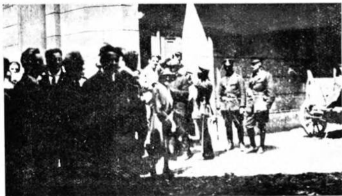
З переслідувань Українського Університету у Львові. Польська поліція розганяє студентів медицини з викладу на медичнім відділі Українського Університету у Львові, в дні 1. VI. 1923.