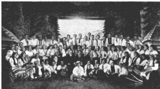
Мистецька група українських студентів Закарпаття.