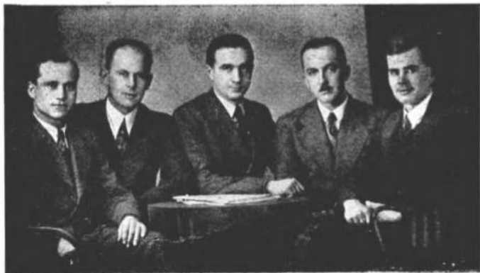
Президія Управи ЦеСУСа в 1936-37 р.р.