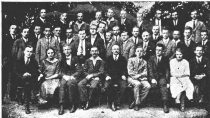
I. звичайний зїзд ЦеСУСа. Липень 1923 в Данцігу. Делегати зїзду.