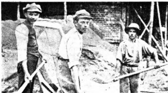
Українські студенти з Праги за фізичною працею підчас ферії.