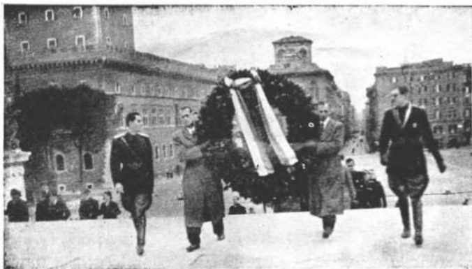
Представництво ЦеСУСа в Римі складає вінець на Могилі Невідомого Воїна в день Свята Української Державности 22. I. 1938.