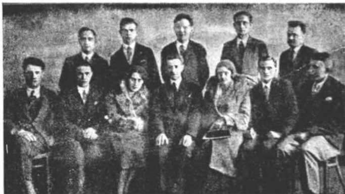
І. Репрезентація СУСОП-у в 1931-32 р.