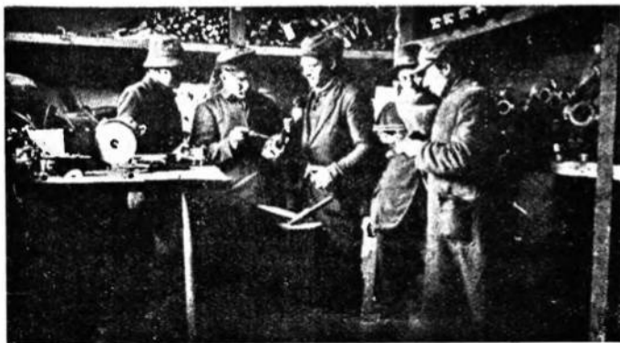
Студенти-робітники на заводі в Данцігу.