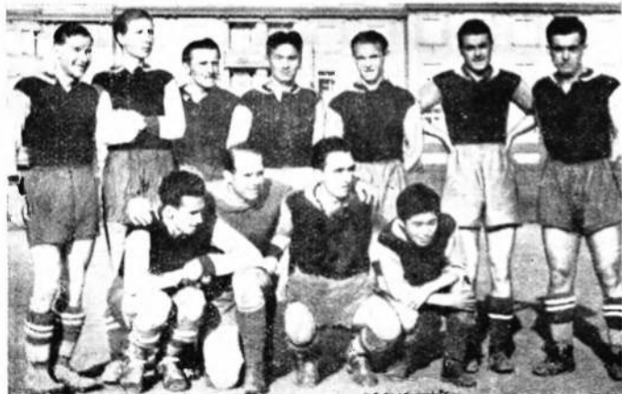
Українська студентська спорт. дружина, яка мала виступати на міжнародній студ. спортивій Олімпіяді в Парижі — 1937 р.