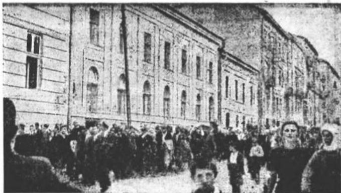
Українське громадянство супроводжає арештованих румунською сигуранцою студентів, членів українського студ. т-ва „Залізник“ у Чернівцях, по дорозі в тюрму — 1937 р.