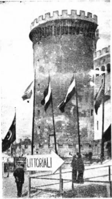
Український прапор(*) перед замком Масчіо Анґоїно в Неаполі, де відбувалася Міжнародна Виставка Студ. Кльтури й Мистецтва — 1937 р. (Образок виїно).