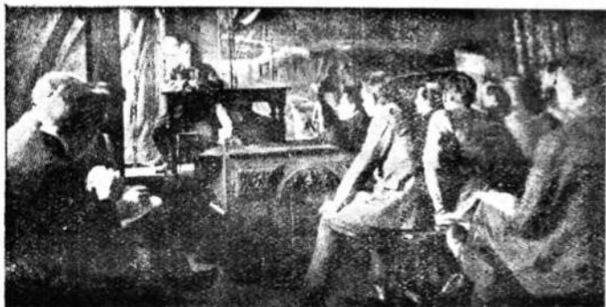
Український університет у катакомбах. Виклад у склепі театральних декорацій, Львів 1922.