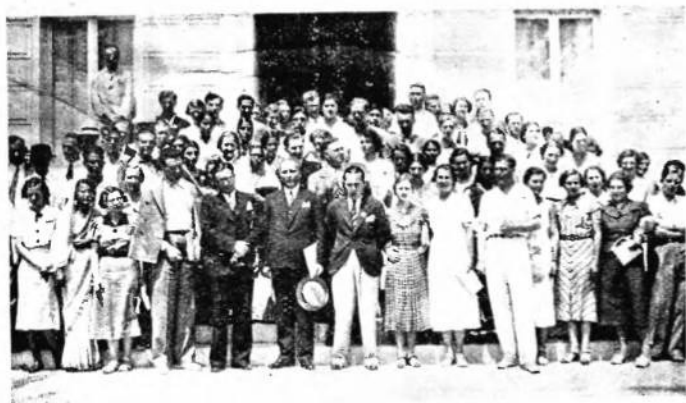
Делегати на Конгрес ISS в Ніщі — 1937 р.