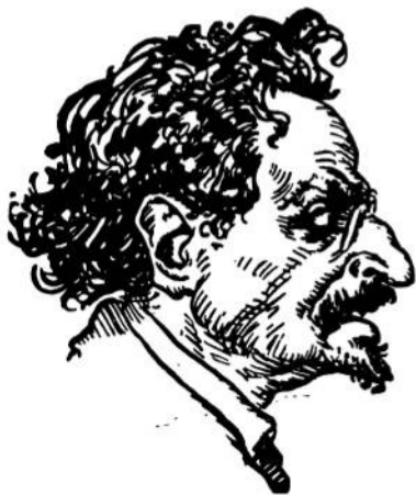
Лейба Бронштайн Троцький Лейба Троцький типовий представник семітських типів.

Але вчені недобачили головної різниці в носах. Носи гіттитів, гиксосів, сумерійців хоч і гіпертрофовані, карикатурно зображені, але вони прямі, спадають рівною з чолом лінією, а з лінією вуха творять кут 90°. Жидівські носи від лінії чола висунені великою каблучкою вперед.