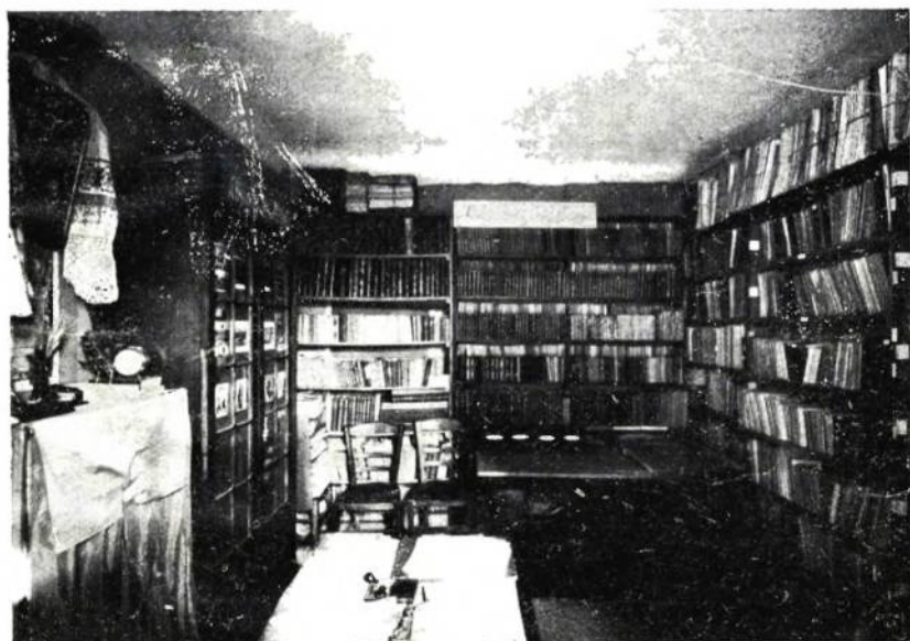
Загальний відділ Бібліотеки