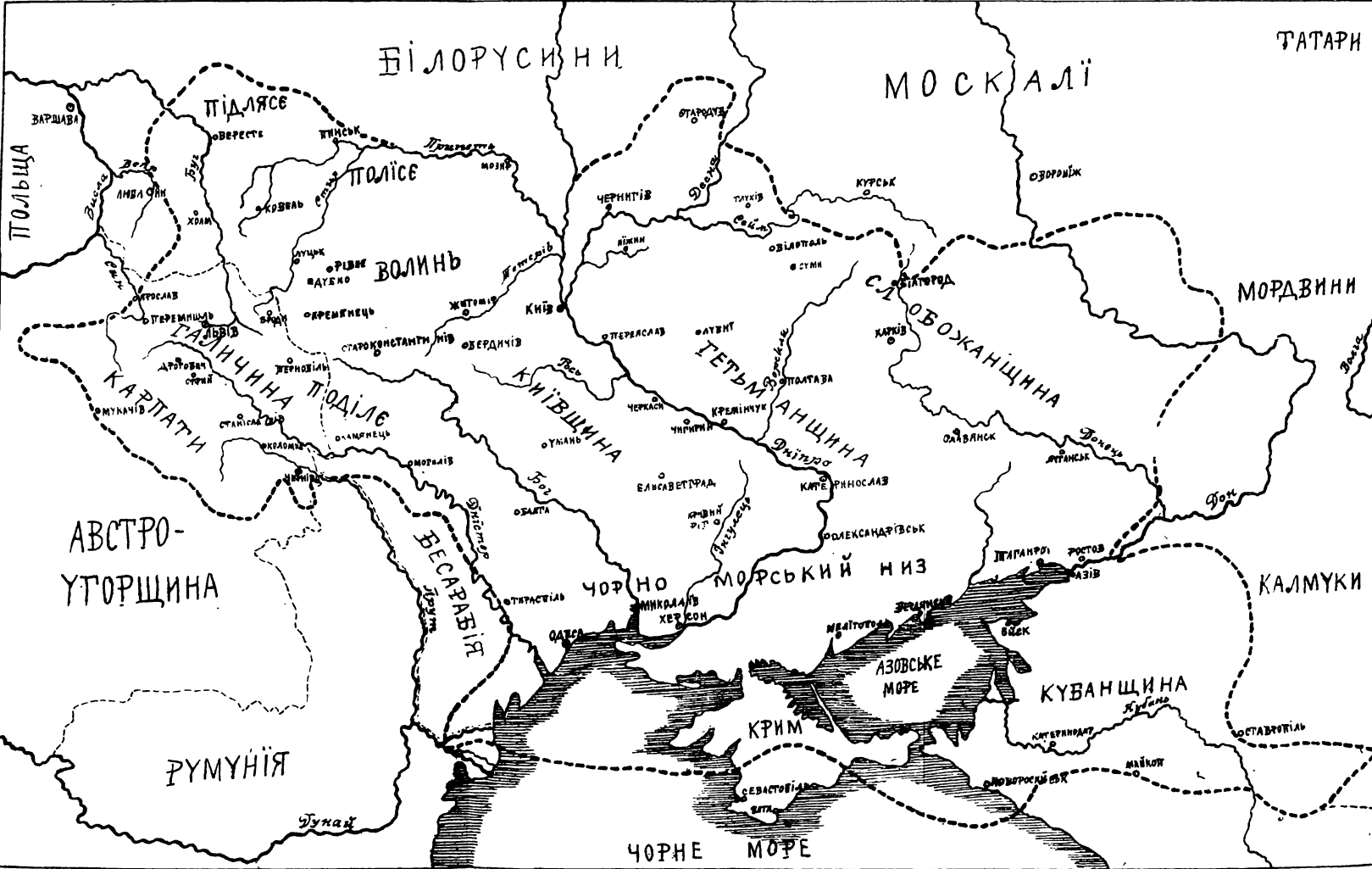
ЗЕМЛІ ЗАСЕЛЕНІ УКРАЇНЦЯМИ.