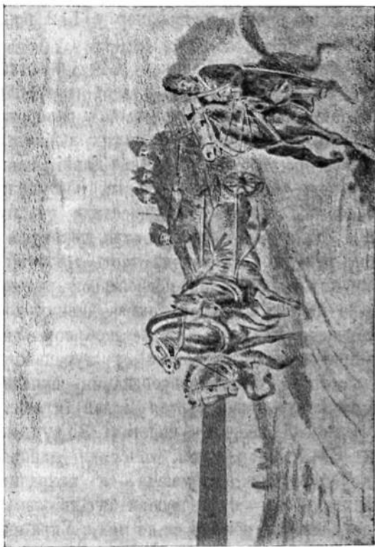
Кальнишевського вивозять Москалі з України.

нишевського зі старшиною. Та послів арештовано і вислано до Петербурґа, а від-