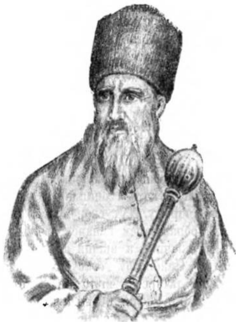
Петро Ковашевич Сагайдачний.

будучність козацтва. Сі угодові козаки старали ся заслужити собі у уряду признанє і поширене козацьких прав. Тому козаки на