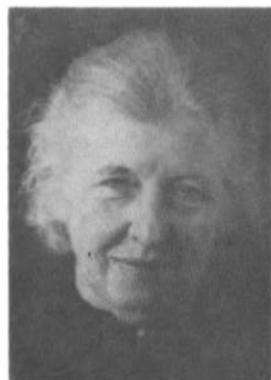
Катруся Зарицька-Сорока. 1976