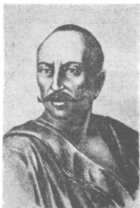
Г о н т а

Колективізація сільського господарства була подумана як підвалина, на якій тримається імперська будівля з вивіскою ССРСР. Багато разів її підправляли, поліпшували різними змінами. Кожна зміна в Кремлі, а їх було багато, починала з реформи сільського господарства. А життя доводить, що та підвалина, як і система імперська, гнила і нежиттєва.