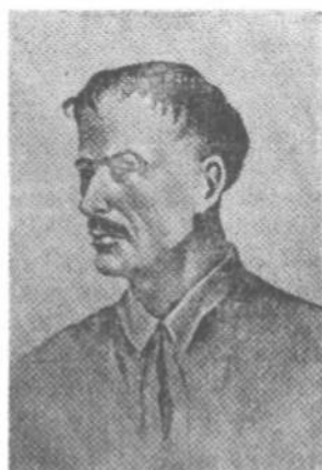
З а л і з н я к