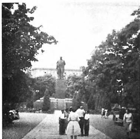
Пам'ятник Великому Українському Кобзареві Т. Г. Шевченкові в Києві