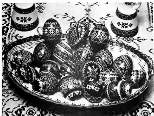
Українські писанки. (Привячую кошечок писанок української жінці. Писанки і фото виконані авторкою)