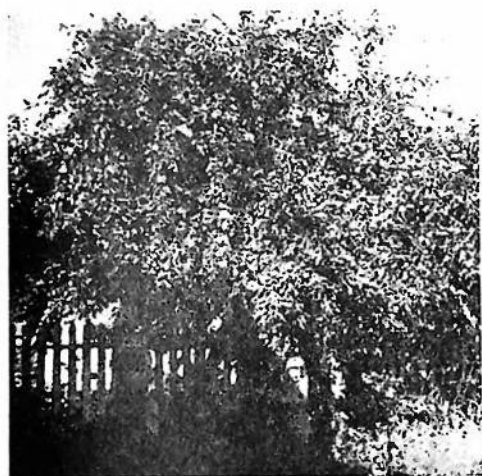
Фото з родинної яблунки