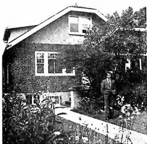
Дім авторки, на фото наймолодший син, Володимир