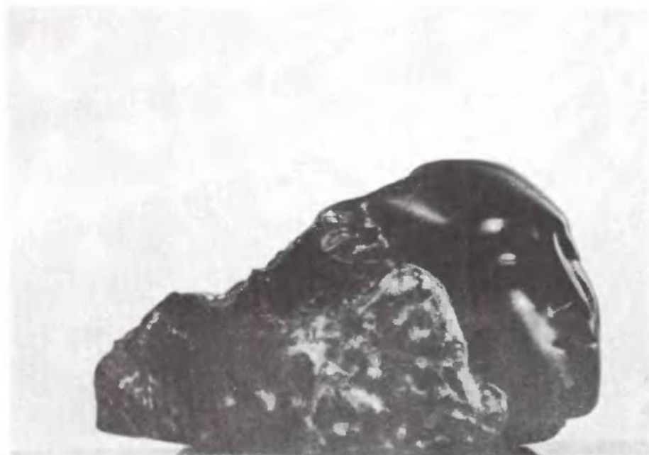
Трансформація , різьба 27 x 27 x 17 см.