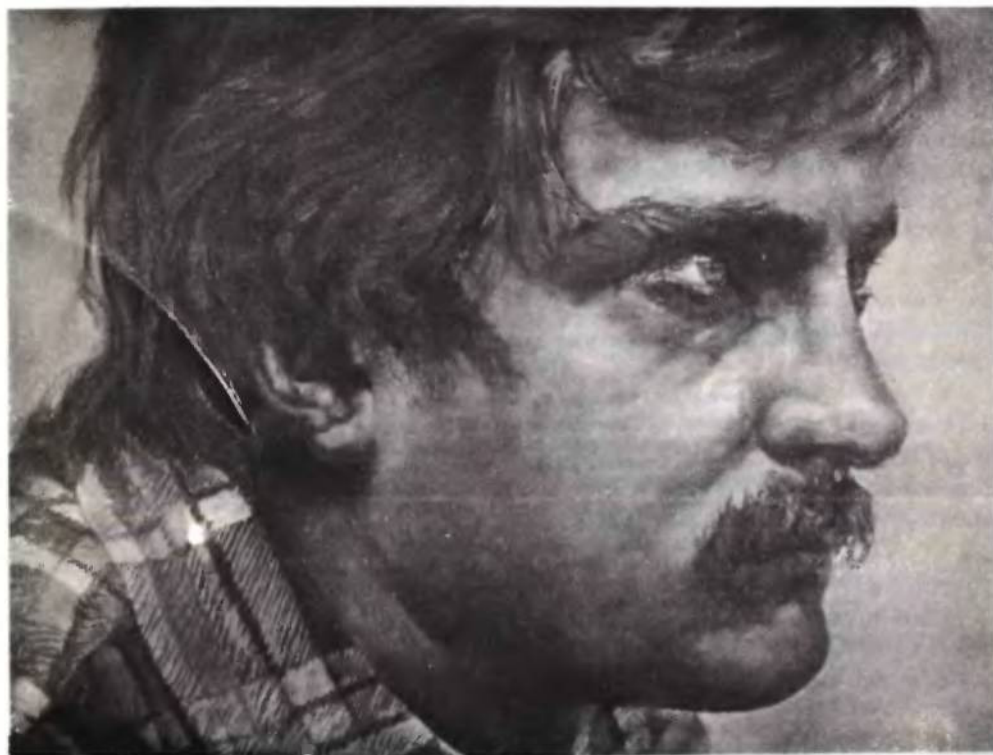
Студія лиця , олія 52 x 69 см.