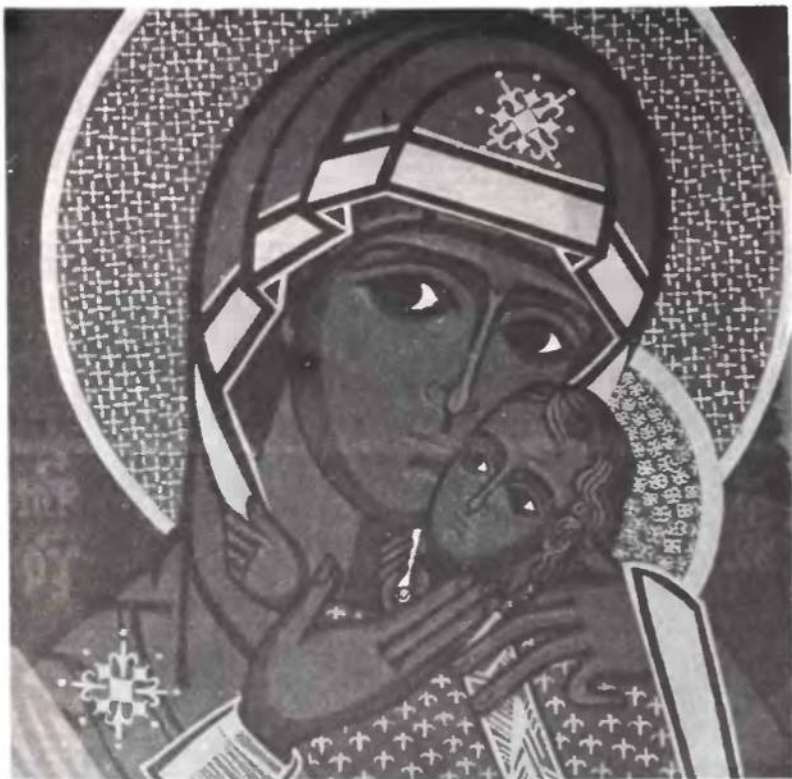
Матір Божа з Ісусинком , ікона, акриліка на дереві, 38 x 38 см