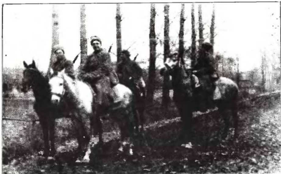
Кінна стежа УПА

Як приклад для кращого зображення відношення сил у терені подаємо деякі дані про ворожі нам сили в місті Луцьку (на підставі звідомлення від 22.У.1943). При тому виступить на яв силовий потенціал третього нашого противника на ПЗУЗ — поляків: