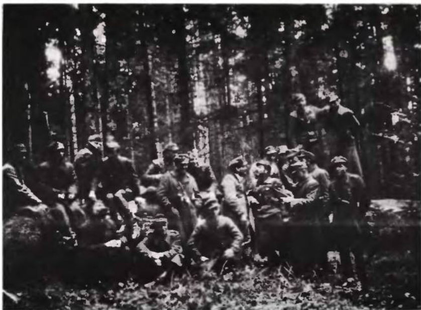
Один з відділів УПА в Карпатах на передищі.