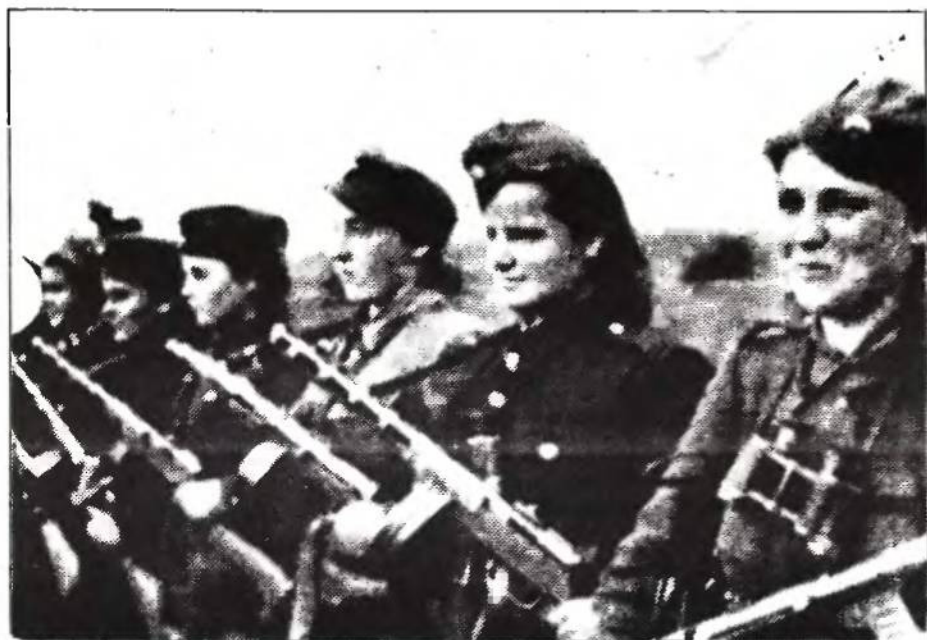
Дівочий відділ УПА на збірці.

з німцями в терен палити села й мордувати українське населення. Розважніші намагаються стримувати гарячих, предбачуючи страшну помсту з боку українців. Загрозу «жезі гайдамацкей» («вирізання» поляків українцями) вони бачать над собою безупину. Їхнім духовним об'єднуючим центром є, як завжди, костел. Виходячи з Богослуження, вони своєю маєю вщерть заповнюють вулиці. На ПЗУЗ є кілька осередків, де поляки замкнулися зі зброєю й укріпилися, (напр., Іванова Долина). Німці не примінують до них репресій і не відбирають зброї, хоч знають, що поляки переховують між собою також большевицьких партизан.