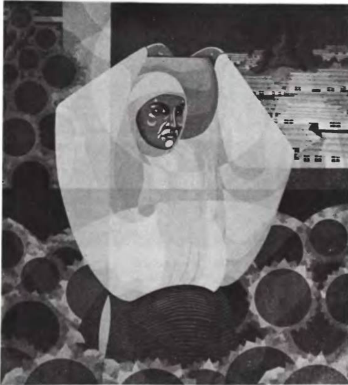
Між квітами , г'ваш, 51 x 47 см.

Орест ПОЛИЩУК , нар. 1942 р. у Львові. Від 1949 р. у ЗСА. Студіював на мистецькому відділі Мерілендського Університету. Від 1969 р. викладає в Монтгомері Коледжі в Роквілі, Мд. ЗСА. Працює в ділянках малярства, скульптури і графіки. Влаштовував кілька індивідуальних виставок.