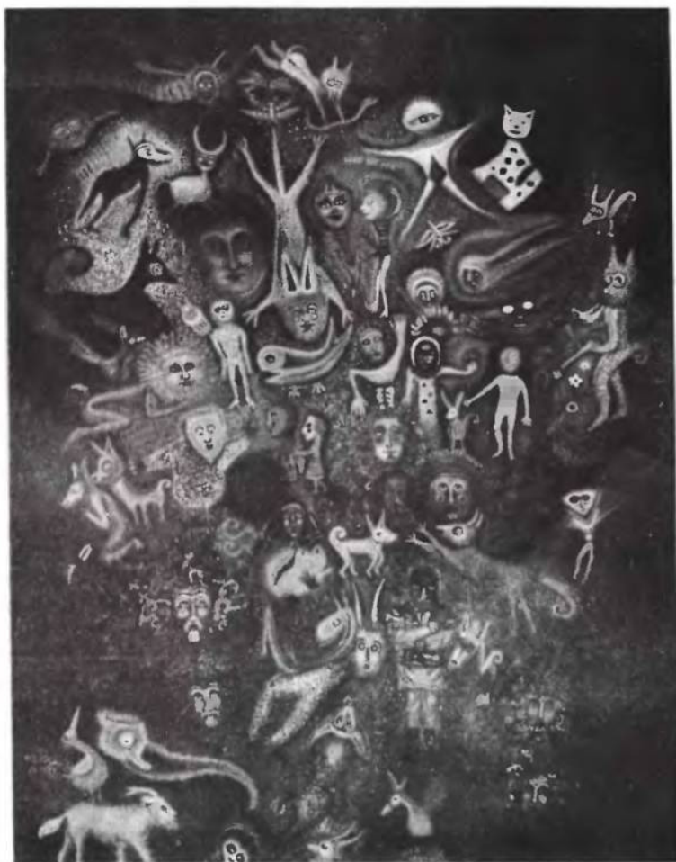
Дивовижі гуцувського світу , мішана техніка, 89 x 68 см.