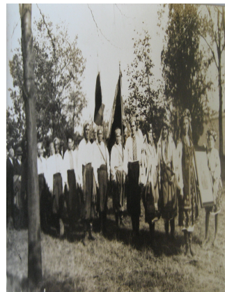
Публіч на хода українських емігрантів і болгарських громадян до могили М. Драгоманова, Софія, 30(16) жовтня 1932 р.