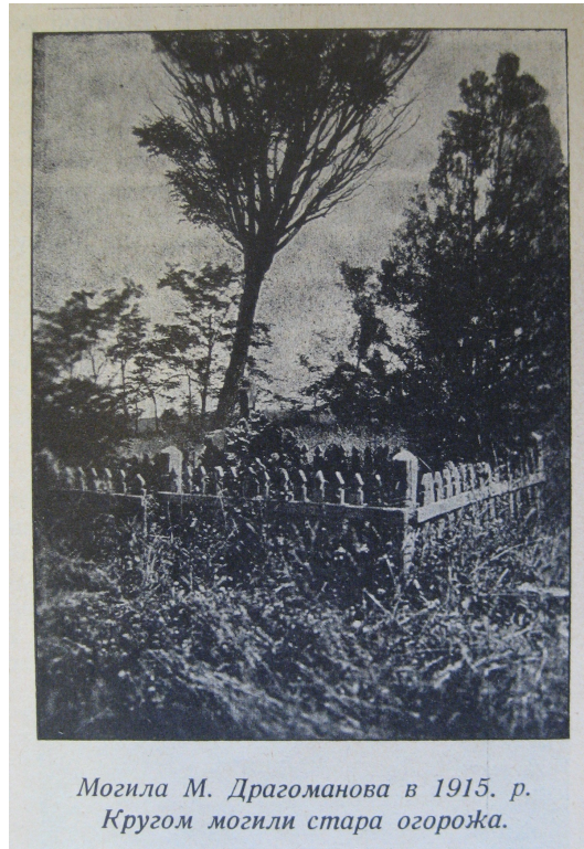
Могила М. Драгоманова в 1915. р. Кругом могили стара огорожа.

Союзу українських журналістів і письменників на чужині, видавцем і співредактором (разом з Миколою Битинським) журналу «Гуртуймося», що виходив у 1929-1938 рр. у Празі та Софії. На його сторінках публікувалися праці В. Филоновича. Серед них – стаття «До історії будови пам'ятника на могилі М. Драгоманова в Софії». Написана на основі документів Комітету з будівництва пам'ятника вченому, до складу якого він свого часу заочно входив, вона містить цікаві матеріали з історії цієї інституції.