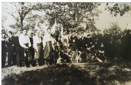
Українські емігранти і болгарські громадяни під час освячення пам'ятника на могилі М. Драгоманова, Софія, 30(16) жовтня 1932 р.

Отже, від висловлення ідеї про встановлення пам'ятника на могилі Михайла Петровича Драгоманова до її реалізації пройшло більше десяти років. Незважаючи на