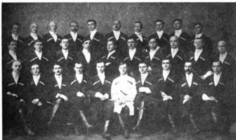
Хор Кубанських козаків

Коли в об. Отамана перебував у США, там виступав Кубанський хор у кількості 30 осіб, які були добре зіспівані. Серед них були й добрі танцюристи. Декілька з них приїздили й до Бейону, бачилися з в. об. Отамана. То були здебільшого наймолодші представники першого ісходу. Цей хор побував і в Мексичі та в м. Міямі, де їм влашто-