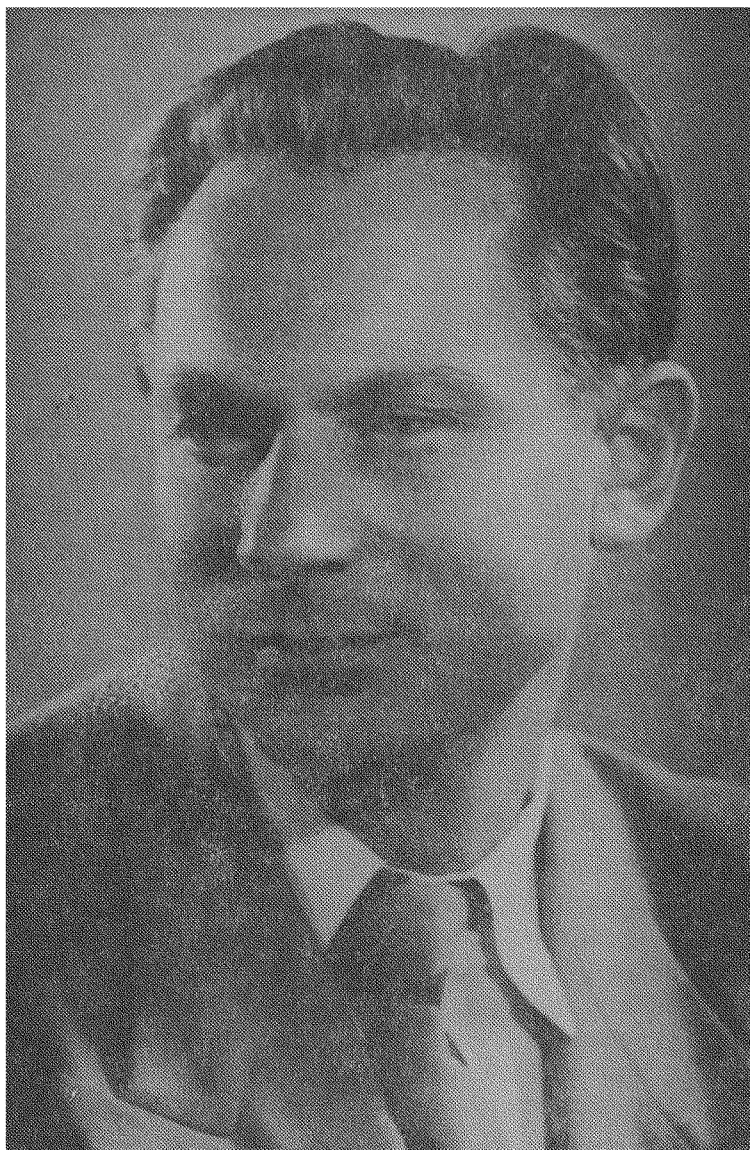
Тарас Бульба-Боровець Світлина з 1941 р.