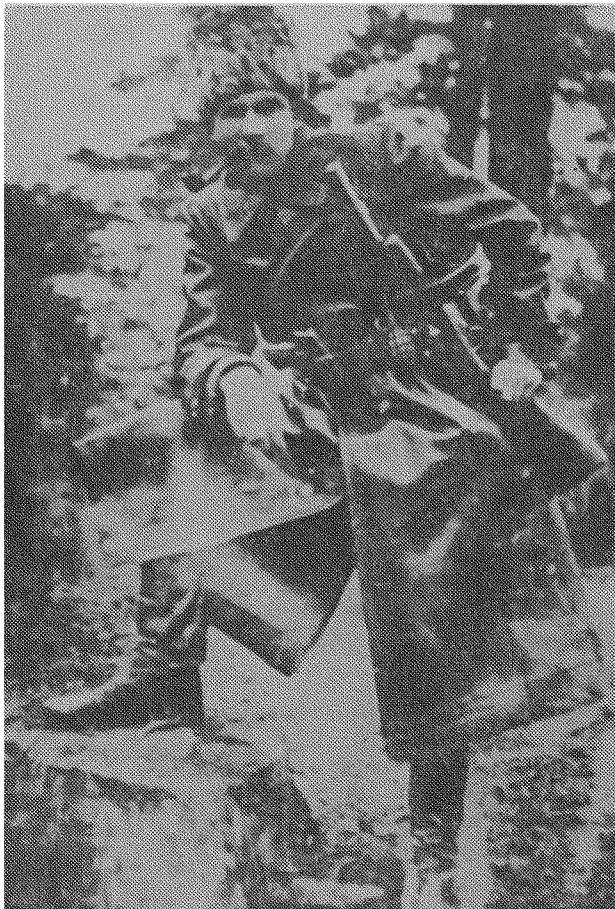
Отаман Тарас Бульба Боровець в поліських лісах Світлина з 1942 р.