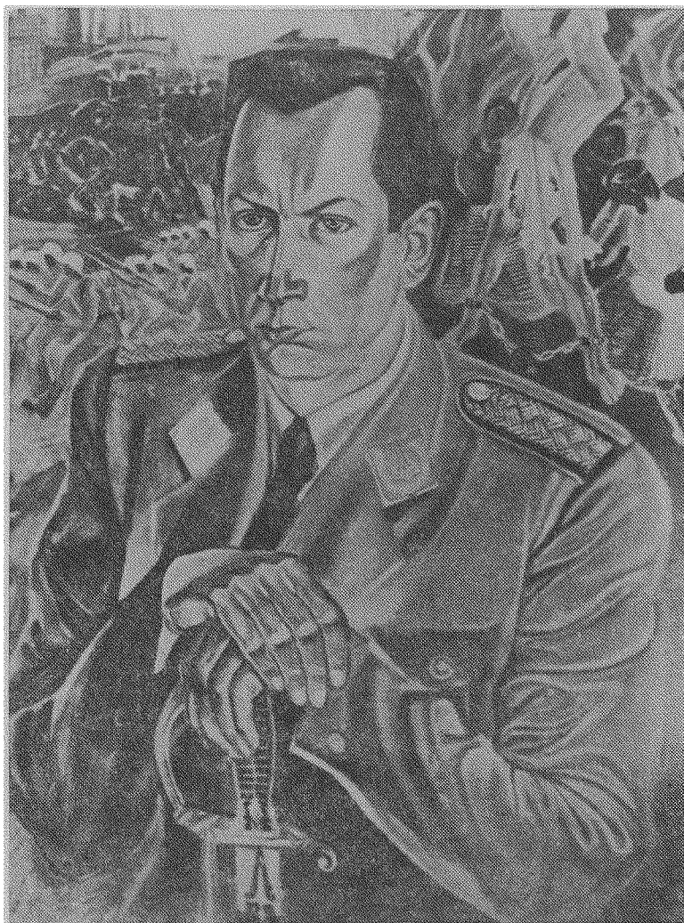
Генерал-хорунжий Тарас Бульба-Боровець, Отаман „Поліської Січі”