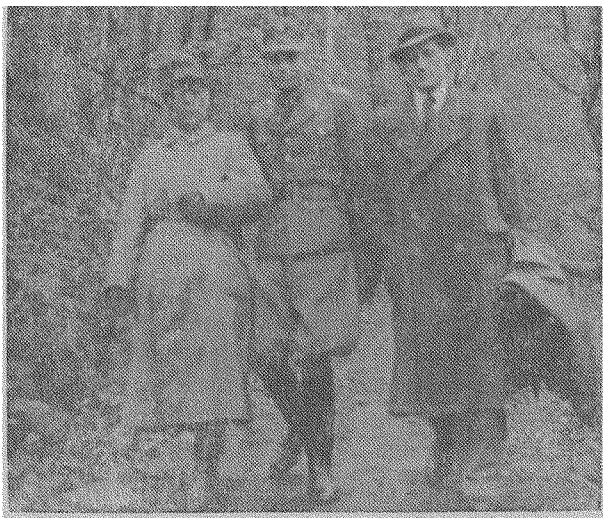
Отаман Бульба-Боровець з адьютантами

Полковника Дяченка я особисто мало знав. Я знав цю людину тільки з історії наших визвольних змагань