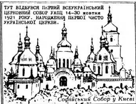
ТУТ ВІДБУВСЯ ПЕРШИЙ ВСЕУКРАЇНСЬКИЙ ЦЕРКОВНИЙ СОБОР УАПЦ 14-30 ЖОВТНЯ 1921 РОКУ. НАРОДЖЕННЯ ПЕРШОЇ ЧИСТО УКРАЇНСЬКОЇ ЦЕРКВИ.