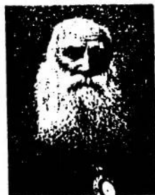
Митрополит В Липківський