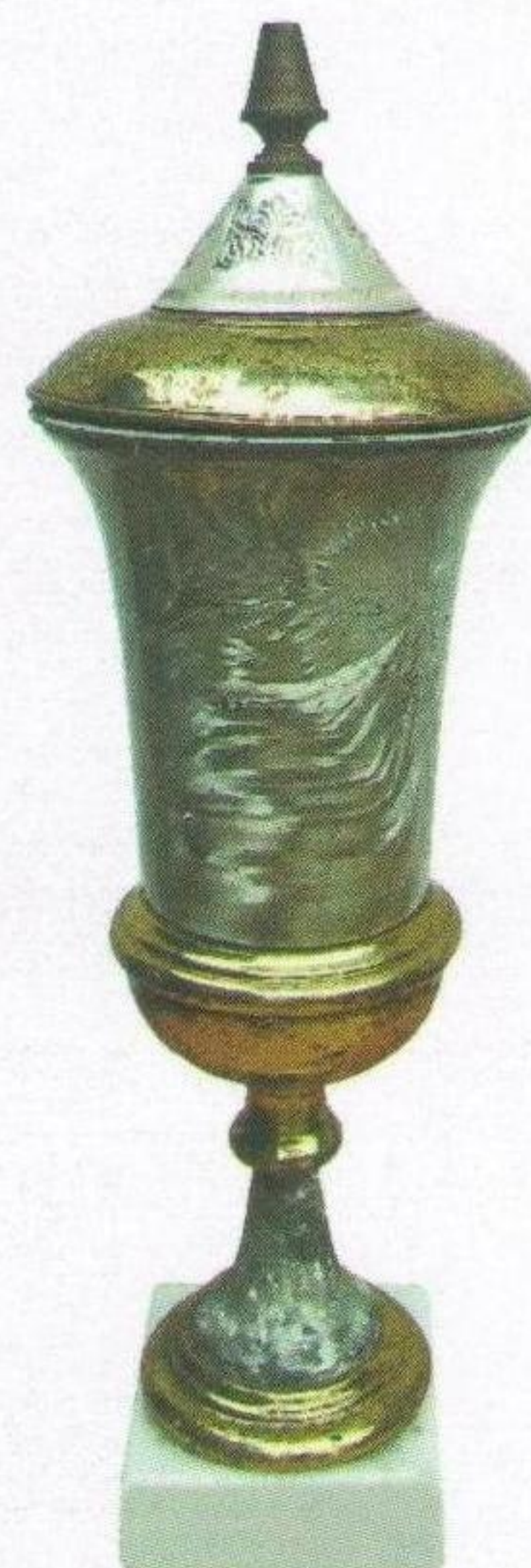
Приз фіналіста Всеукраїнської Чаші 1925 року.