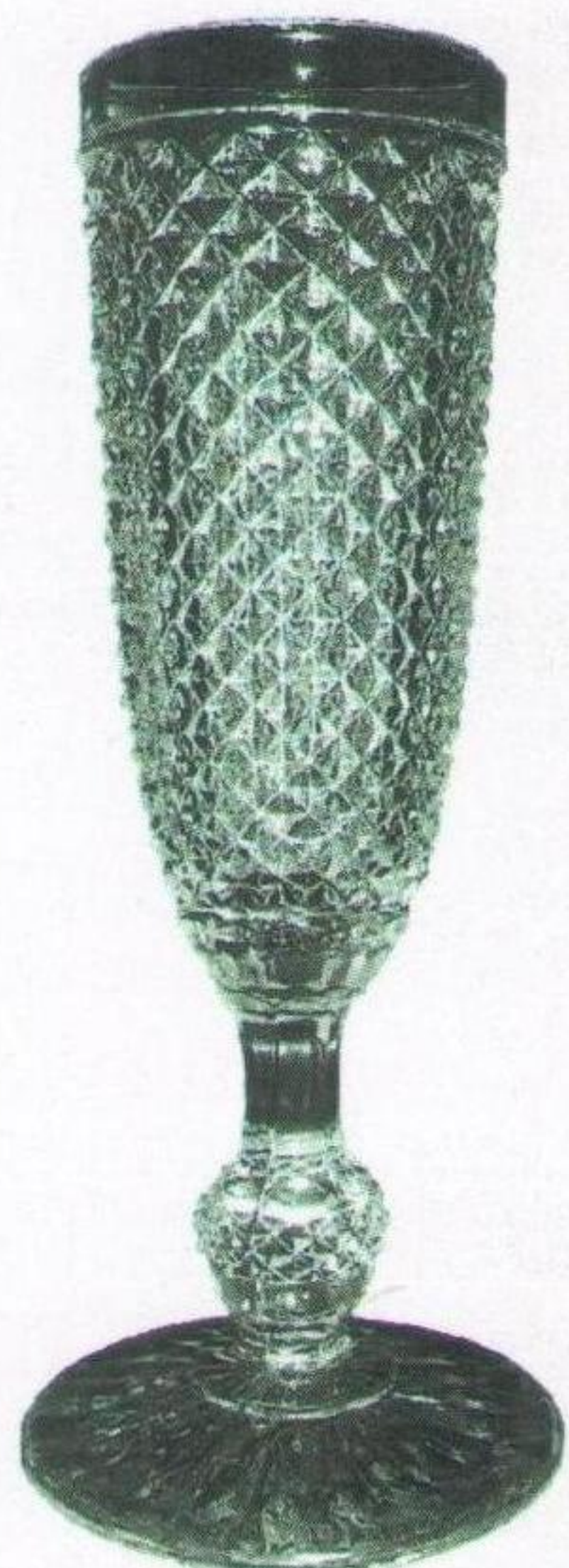
Приз переможця Всеукраїнської Чаші.

Скінчився змаг за футбольну «Всеукраїнську Чашу». Побідником є УСТ «Довбуш». У фіналі буковинці виграли СТ «Україна» Львів. Перед тим у напівфінальнім колі зі змагу вибули УСТ «Сокіл» Ровно і УСТ «Поділля» Тарнопіль. («Свобода» (Львів) — 20.11.1925).