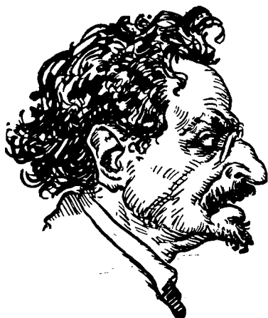
Лейба Бронштайн Троцький

царської палати відмовився від прийняття тих домагань, "революціонери" почали жакливу демонстрацію і намагалися штурмувати палату. Покликано тоді військо, яке силою зброї здушило в зародку цю першу революцію в Петербургу, а вслід за тим провалилися подібні революційні намагання в інших містах бувшої Росії.