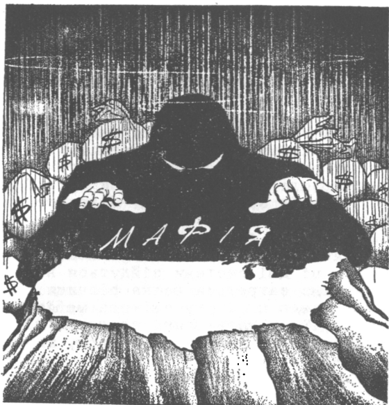
Над Америкою простягнула свої лапища темна мафія, за якою стоять капітали

черепки. Роблячи це, вони лише точка за точкою виконують вже давно накреслені свої плани, згідно з якими комунізм має бути лише переходною стадією на шляху до повного підкорення собі світу. А поки він триває, він виконує роботу в їхньому інтересі: винищує фізично та збиває духово народи, нищить серед них усе, що є сильне, відважне, здібне до спротиву насиллю, збиває всякий ідеалізм, нівечить духовість, віру в Бога, гідність людини як твору Божого, а зводить її до становища покірного раба, без власної волі, без принципів, який без найменшого спротиву та ще "ентузіастично" прийме всяку тиранію. Комуністичний режим, захоплення якнайбільше народів у сильця цього режиму, нищення окремішності поміж поодинокими народами, касування кордонів і т.п. -- це вимріяний якраз ґрунт для експериментів тих темних сил, тієї мафії міжнародніх заговорників. Ось чому вона -- оця мафія є така прокомуністична, така промосковська чи як треба, прокастровська, протітовська і навіть прокитайська, а така проти-українська і так сильно побоює анти-комуністів і патріотів усіх народів, які є