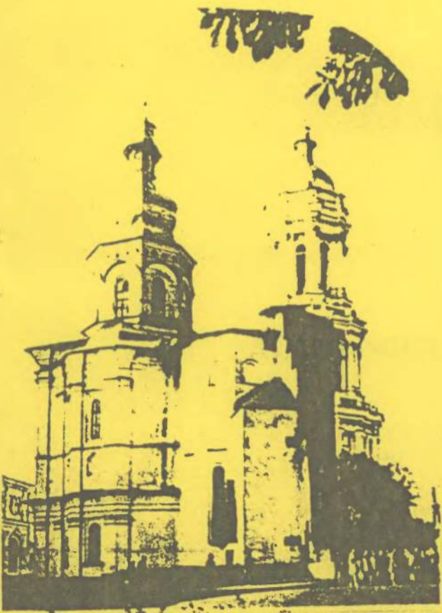
Києво-Печерський державний історико-культурний заповідник. Залишки Успенського собору (XI–XVIII ст.) та Велика дзвіниця (XVIII ст.)