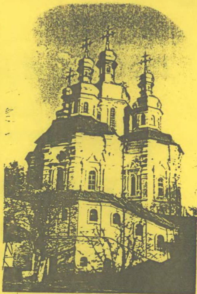
Києво-Печерський державний історико-культурний заповідник. Всіхсвятська церква (XVII ст.)