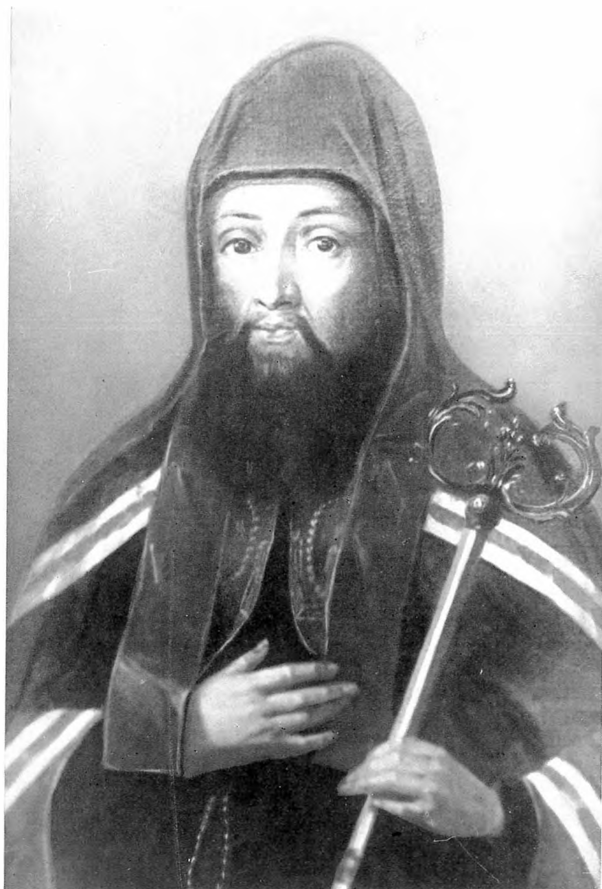
VETUS IMAGO S. JOSAPHAT VILNENSIS