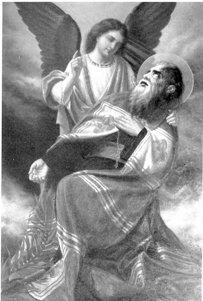
IMAGO S. JOSAPHAT CRYPTOFERRATENSIS AN. 1867