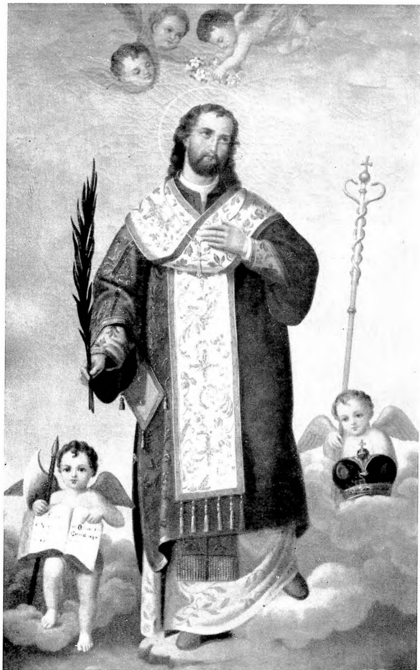
IMAGO S. JOSAPHAT TEMPORE CANONIZATIONIS ОБРАЗ СВ. ЙОСАФАТА З ЧАСІВ КАНОНІЗАЦІЇ