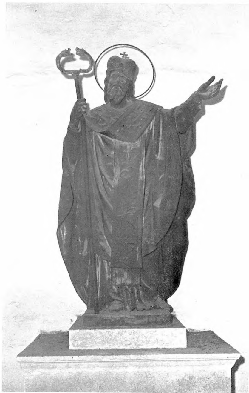
STATUA S. JOSAPHAT IN ARCHIMANDRIA CRYPTAE FERRATAE an. 1867