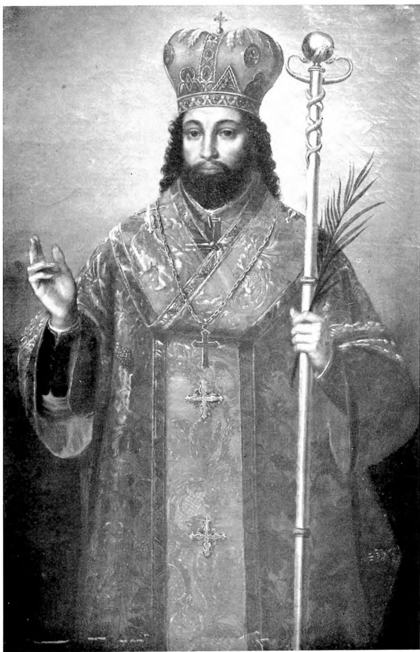
IMAGO S. JOSAPHAT ROMANA ANTE CANONIZATIONEM