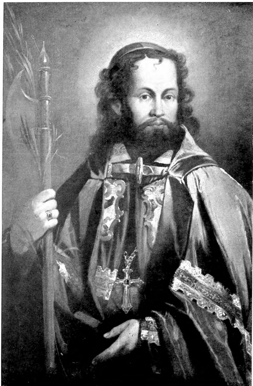
IMAGO S. JOSAPHAT IN ECCLESIA S. ANDREAE IN VALLE ROMAE