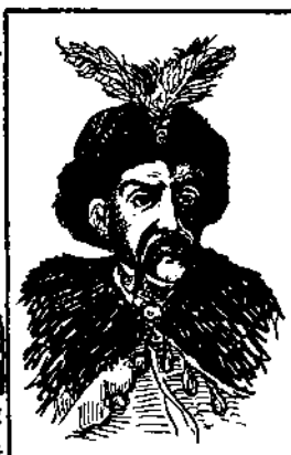
6 Творець держави Козацької Гетьман Богдан Хмельницький.