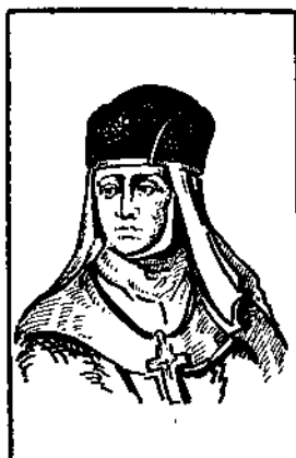
1 Княгиня Ольга- перша прийняла християнство.