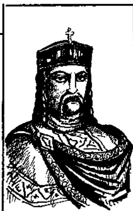
2 Князь Володимир- Великий. Могутній Володар України-Русі. Охрестив Україну.