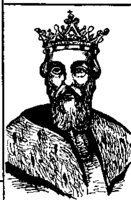
5 Король Данило- Володар Галицько- Волинський.