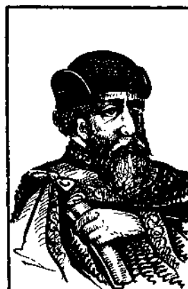
4 Князь Ярослав Мудрий. Упорядку- вав право.