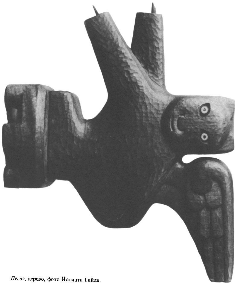
Пегаз, дерево, фото Йоланта Гайда.