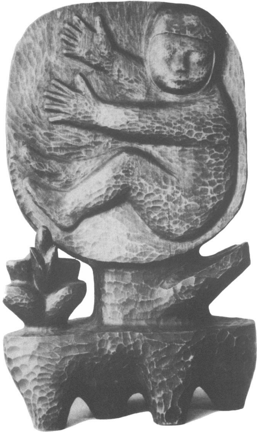
Drewno życia, drewno, fot. Jolanta Gajda