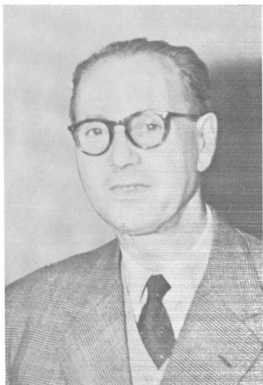
Микола Кричевський (1898 — 1961)