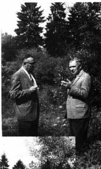
Фотографії зроблені в час прогулянки над річкою Ельб. Листопад 1962 року.