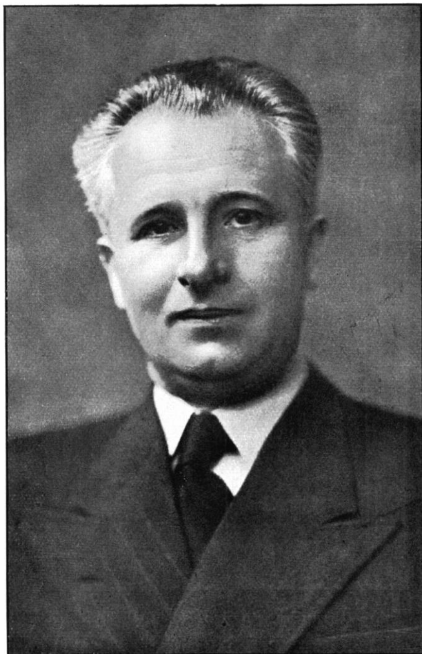
ПРОФЕСОР Д-Р ІВАН БОРКОВСЬКИЙ РЕКТОР В Р. 1939/40.