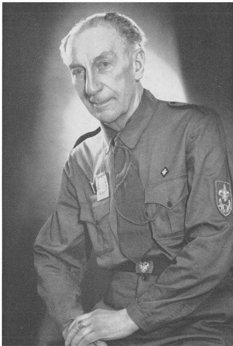
Основоположник Пласту проф. д-р Олександр Тисовський — Дрот