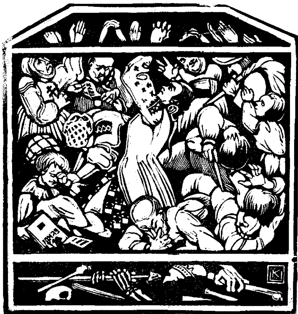
Олена Л. Кульчицька: Картина з циклю «ЛИХОЛІТТЯ УКРАЇНСЬКОГО НАРОДУ», лінорит.