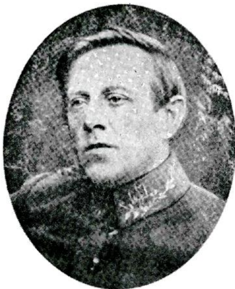
СИМОН ПЕТЛЮРА (23.5.1879 — 25.5.1926) Головний Отаман Військ і Голова Директорії УНР