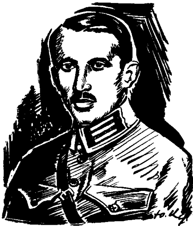
ЄВГЕН КИНОВАЛЕЦЬ (14.6.1891 — 23.5.1938) Командир Корпусу Січових Стрільців, та основоположник УВО і ОУН