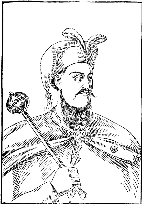
Гетьман Петро Дорошенко.

турецький союз і зложив булаву. Він попав у руки Москалям і покінчив життя в Московщині. По Дорошенку не було вже визначних гетьманів на