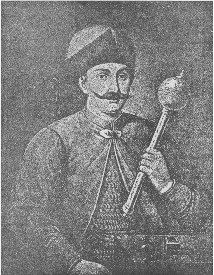
Гетьман Іван Вигівський.