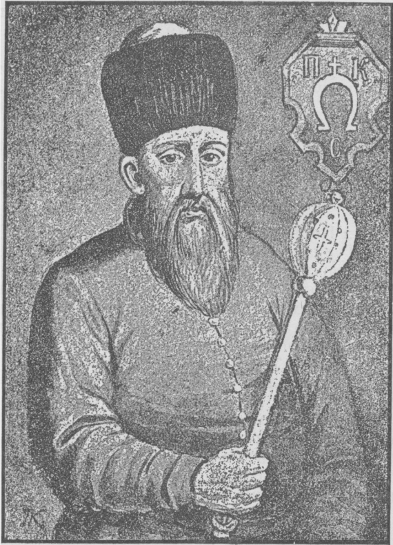
Петро Конашевич Сагайдачний.

Косинський 1596 р., Федір Лобода і Семерій Наливайко 1596 р. пробували робити повстання проти Польщі. Але їхнє військо не витримало у