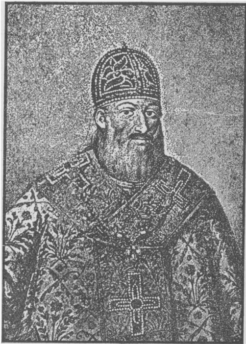
Київський митрополит Петро Могила.

села, руйнували все та брали народ у неволю. Польська шляхта знала панувати на Україні, але не знала її боронити. Тому український народ сам взявся за оборону рідної землі. Молоді відважні люде збиралися у ватаги та йшли у степи, за Дніпрові пороги, на Запорозжя. Там вони проживали