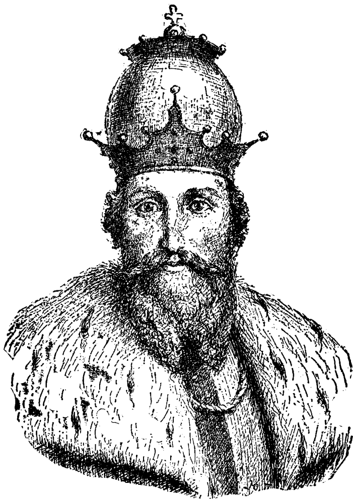
Князь Данило, король Руси.