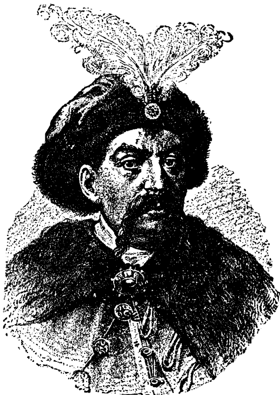
Гетьман Зеновій Богдан Хмельницький.

козаків. Гетманська столиця була в Чигирині коло Дніпра. Вся Україна ділилася на полки, — київський, подільський, чернігівський і інші. Управу полку вів полковник. Полк ділився на сотні з со-