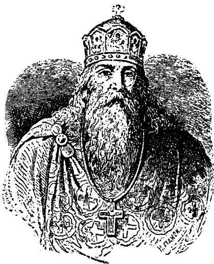
Св. Володимир Великий.

Печеніги, що жили у степах. Князь забезпечив границю від них сильними валами та городами. Потім настали спокійніші часи. В 988 р. Володимир охрестився і приказав всьому народові прийняти Христову віру. На місцях, де стояли давні боги, ставлено християнські церкви. У Києві князь побудував величаву церкву св. Богородиці, яку звали Десятинною, бо Володимир дав на неї десятю частину свого майна. Володимир узяв за жінку грецьку царівну. З Греції приїхало до нас і багато