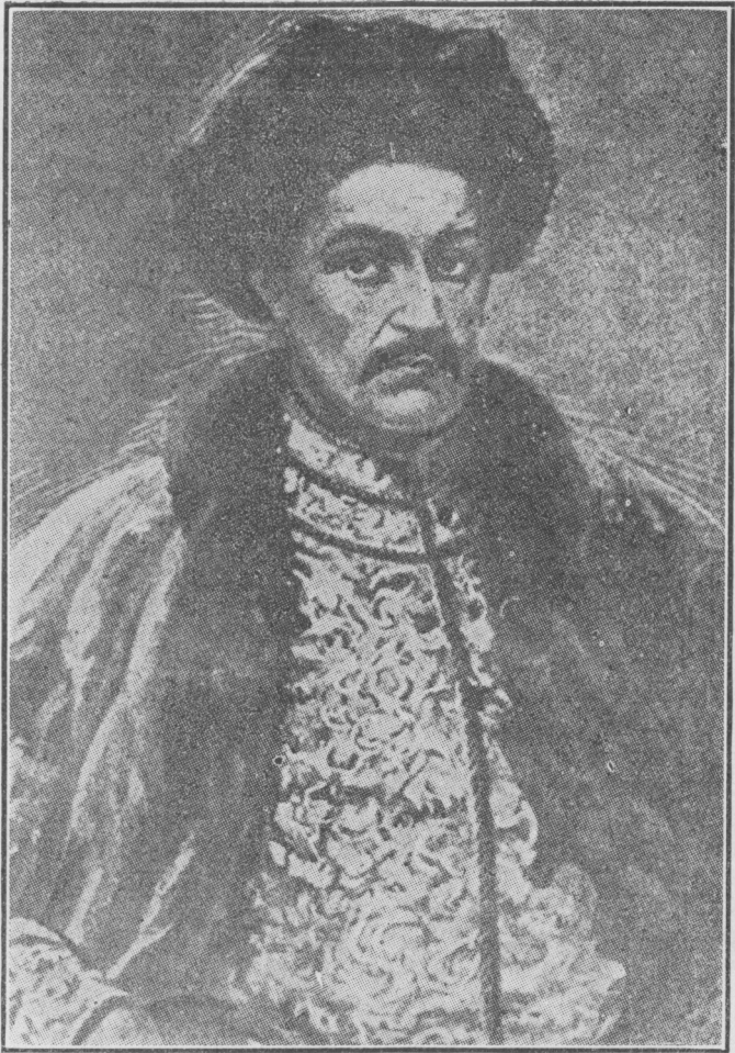
Гетьман Іван Мазепа.