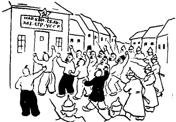
— Ми українські робітники і селяне добровільно жадаємо зліквідування цієї останньої ознаки, контрреволюційного сепаратизму!..