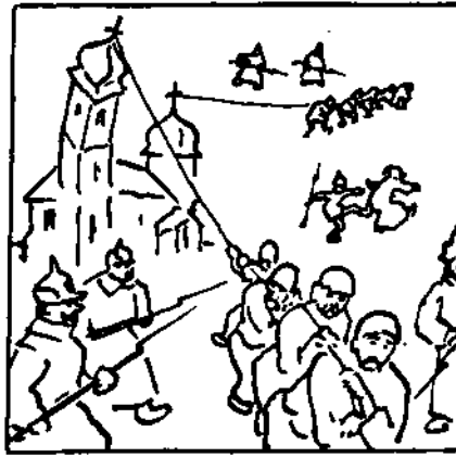
Самі віруучі добровільно валять церкву.