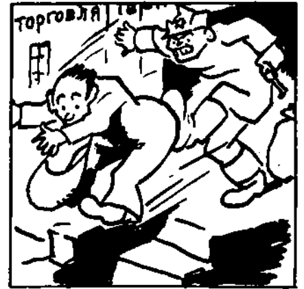
Непман сам добровільно залишає торговлію.