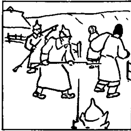
Селяне самі добровільно залишають приватне віками насильжене господарство.