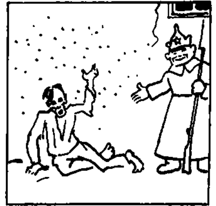
— Нестерплю контрреволюційної брехні! Перед цілим світом заявляю, що я сам жадав, аби мене ГПУ розстріляло!..