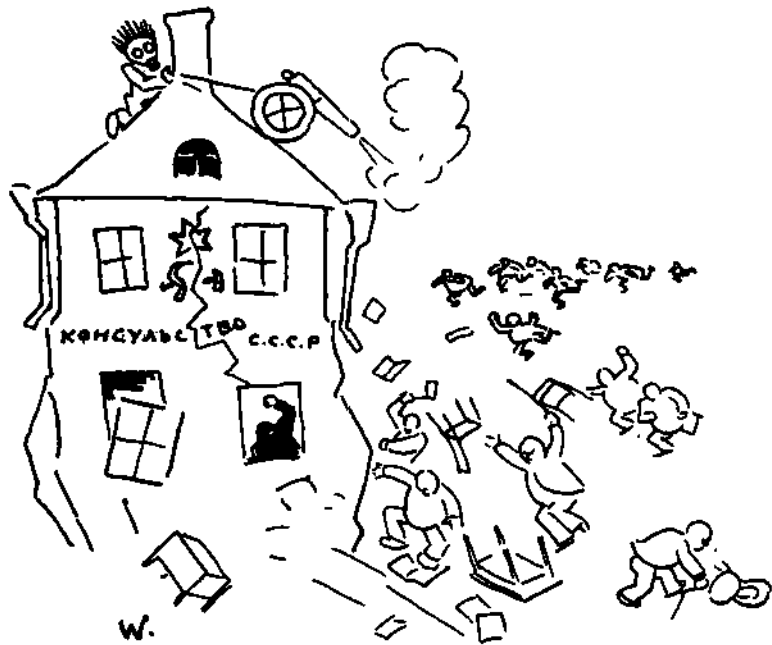
Так сини платять за погощення їх батьків ікрою??!

Певно... «Лицарі абсурду» — Наша молодь і селянство. «Хлібоїди»... «Ікродіди»... Це вже «старше громадянство».