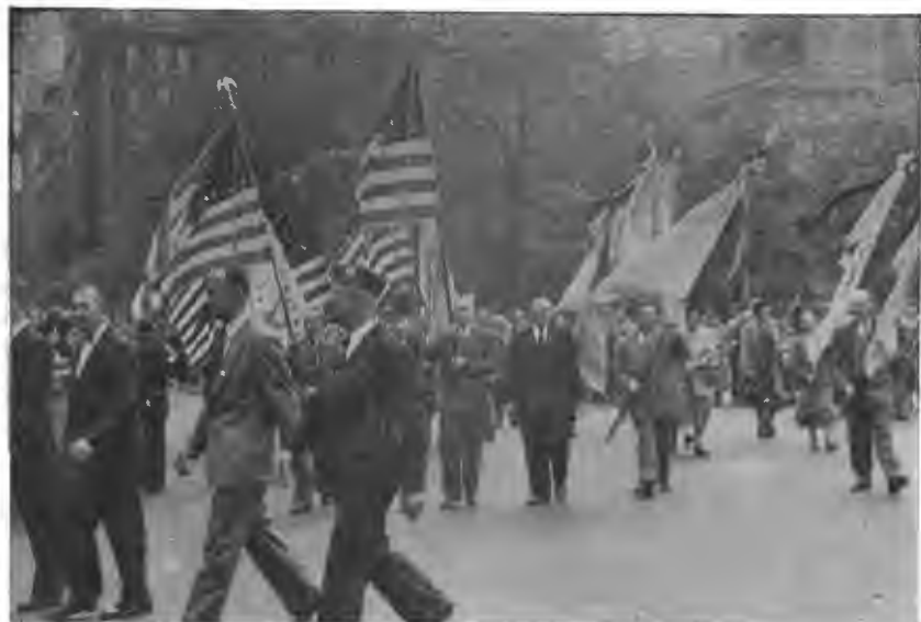
Американсько-українські ветерани м. Нью Йорку та околиць маніфестують під прапорами.