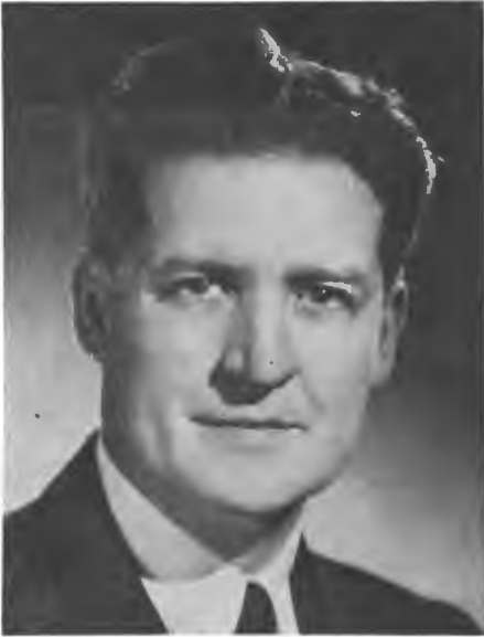
REPRESENTATIVE CHARLES J. KERSTEN of Wisconsin

"... The underground Ukrainian, Lithuanian, Georgian, and other resistance groups are already an active force against the Communists... The American people have always been ready to assist the downrodden and oppressed..."