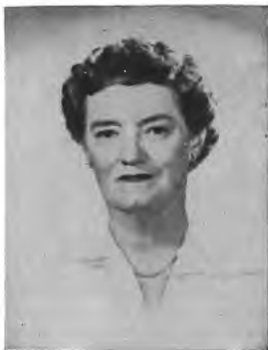
Пані ІНДІЯ ЕДВАРДС, віце-през. Нац. Комітету Аме- риканської Демократ. Партії.

Конгрес був великим політичним успіхом українців.