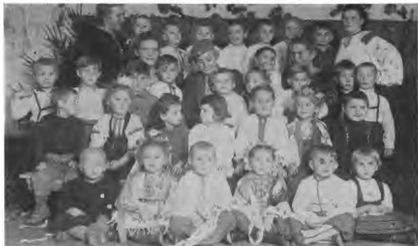
Новий Ульм. Дитячий садок — наша мила дівтора. Ще багато її розкидано по закутках Німеччини...