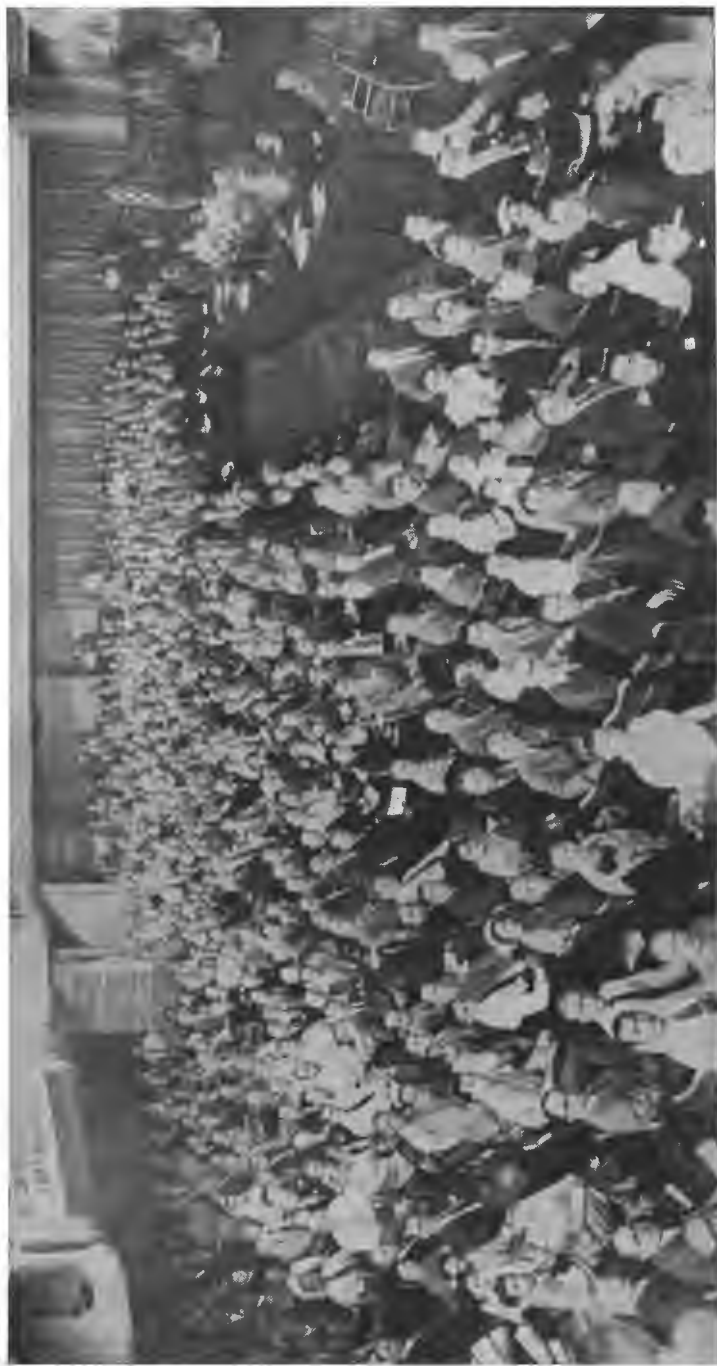
5-й КОНГРЕС АМЕРИКАНСЬКИХ УКРАЇНЦІВ У НЬЮ ЙОРКУ, 4-6 ЛИПНЯ 1952 Р.