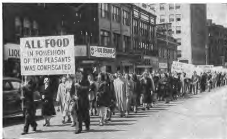
Українці м. Омаха розгромадно маніфестують.

Нижче подаємо світлини деяких маніфестацій.