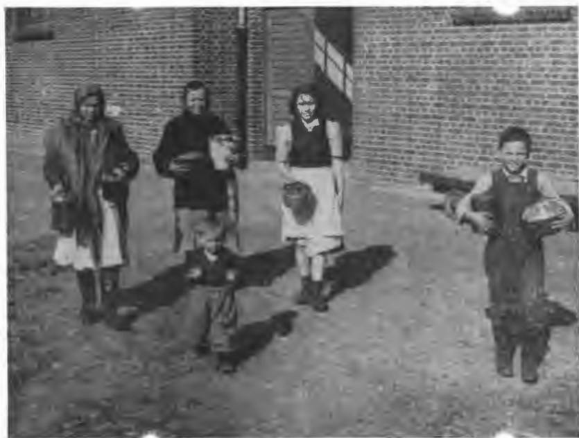
І на чужині хочеться справити Великдень... Напекли пасок...