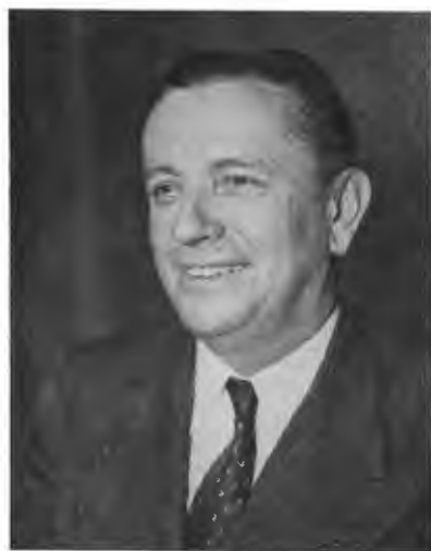
ОСКАР ЧЕПМЕН, Секретар (Міністр) Внут- рішніх Справ ЗДА.

Конгрес був направду величавий. Відбуваючи свої наради три дні, обговорив багато справ і прийняв низку важливих постанов та резолюцій.