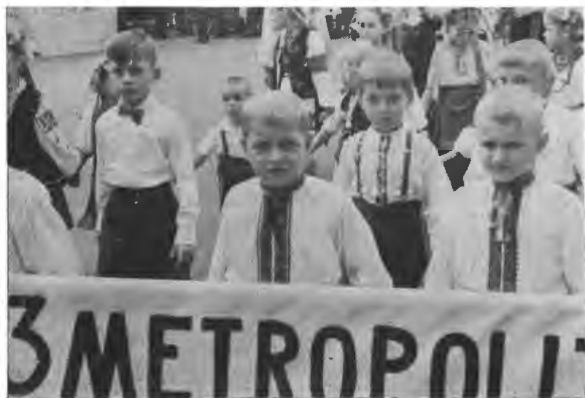
Українські діти також взяли участь в протиголодовій маніфестації.