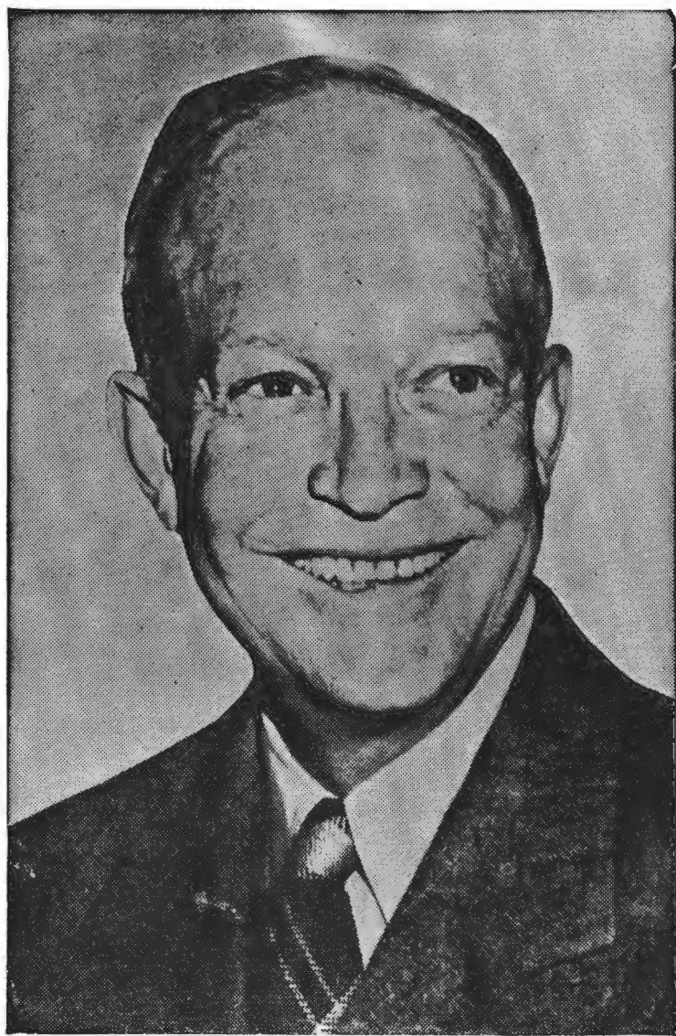
ДВАЙТ Д. АЙЗЕНГАВЕР Президент З'єдинених Штатів Америки