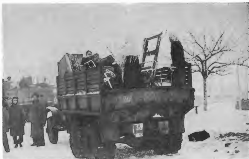
До нового табору, на нове життя...