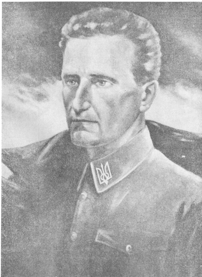
ROMAN SHUJEVYCH (1907—1950) COMANDANTE EN JEFE DEL EJERCITO DE LIBERACION UCRANIO Y JEFE DE LA ORGANIZACION DE NACIONALISTAS UCRANIOS EN TERRITORIO PATRIO