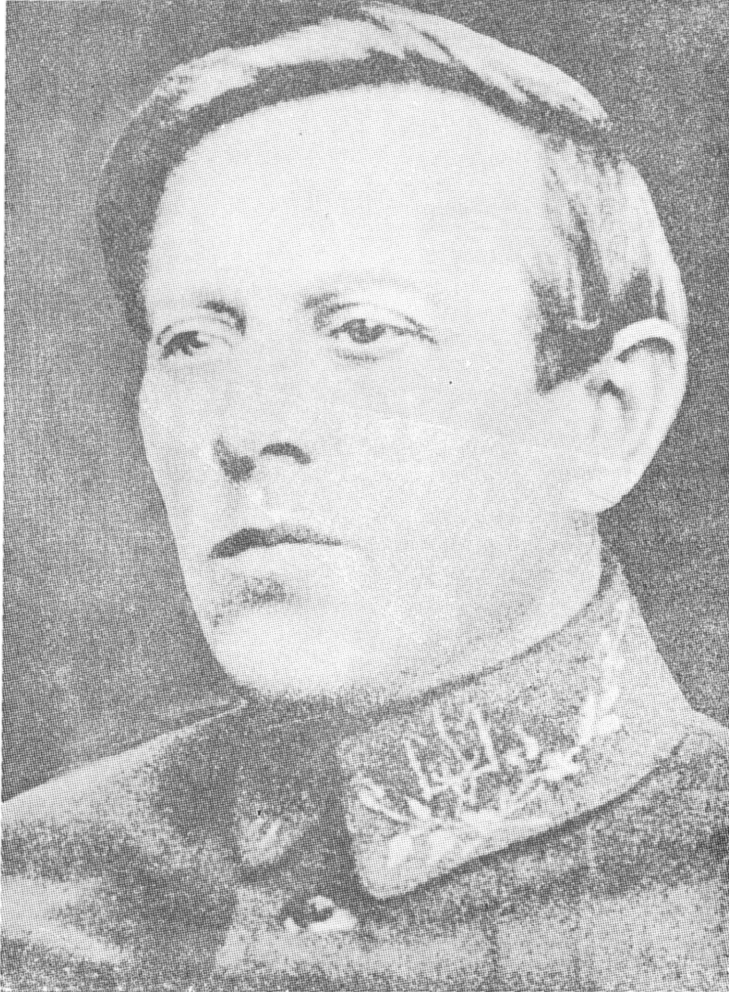
SIMON PETLURA (1879—1926) PRESIDENTE DE LA REPUBLICA NACIONAL UCRANIA Y COMANDANTE EN JEFE DE SUS FUERZAS ARMADAS