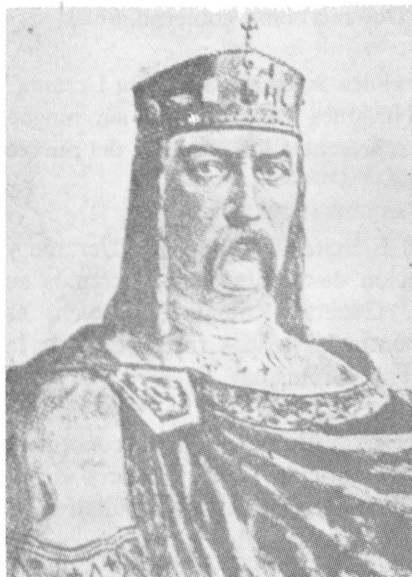
EL REY VOLODYMYR EL GRANDE (980—1015) ESTABILIZADOR DE LA FUERZA Y DEL PODERIO DEL PRIMER ESTADO MEDIEVAL UCRANIO