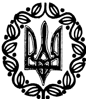
ESCUDO NACIONAL UCRANIO