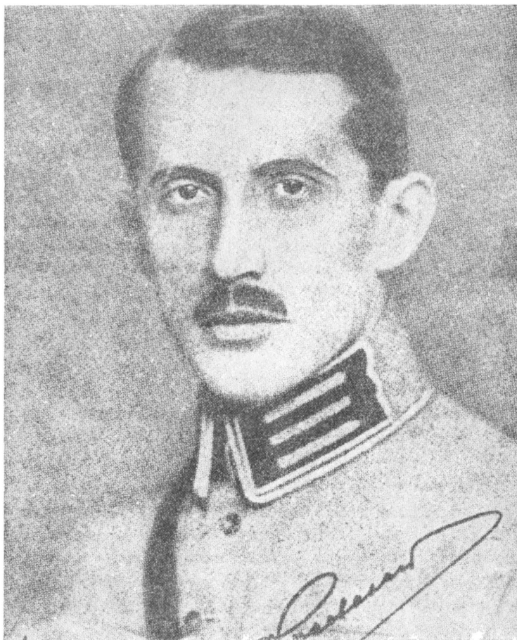
EUGEN KONOVALETS (1891—1938) PRIMER JEFE DE LA ORGANIZACION DE NACIONALISTAS UCRANIOS (MOVIMIENTO REVOLUCIONARIO UCRANIO PRO LIBERACION)