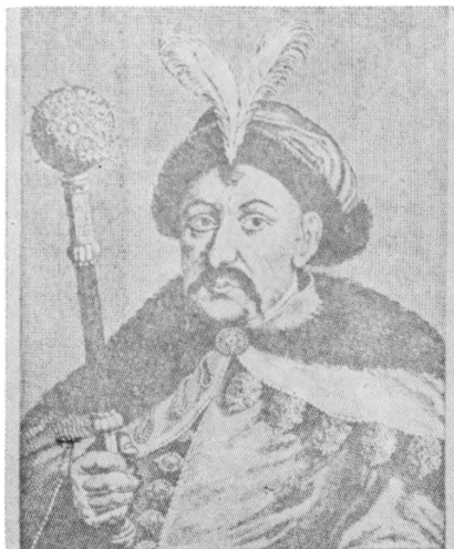
BOHDAN JMELNYTSKY (1648—1657) FUNDADOR Y GOBERNANTE DEL ESTADO COSACO UCRANIO