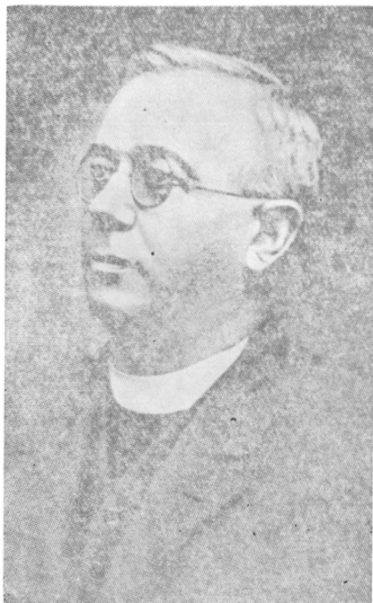
AUGUSTIN VOLOSHYN (1874—1946) PRESIDENTE DEL ESTADO DE LA UCRANIA CARPÁTICA