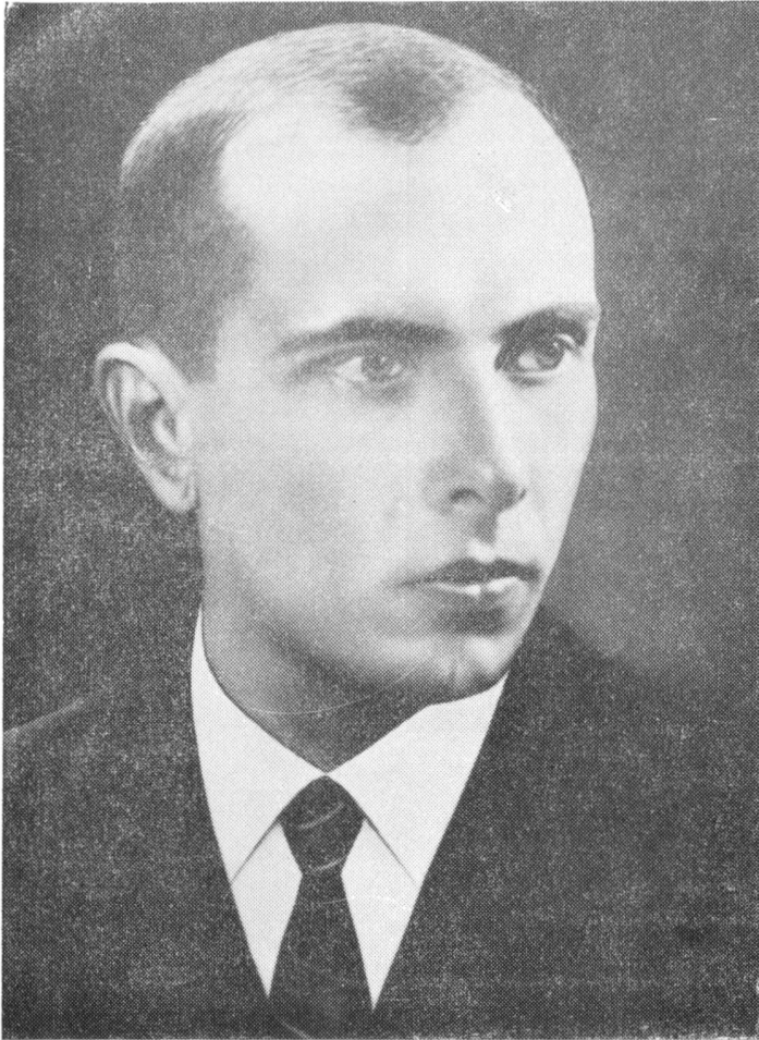
STEPAN BANDERA (1909—1959) JEFE DE LA ORGANIZACION DE NACIONALISTAS UCRANIOS Y SIMBOLO DE LA LUCHA REVOLUCIONARIA PRO LIBERACION