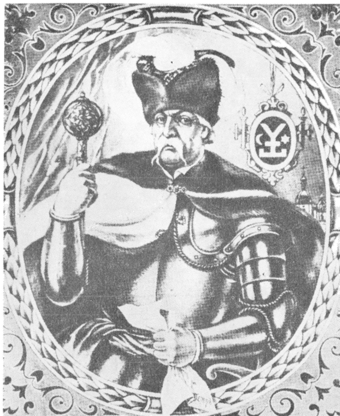
IVAN MAZEPA GRAN GOBERNANTE DEL ESTADO COSACO UCRANIO QUIEN CIFRABA SU AMBICION EN UNIFICAR A UCRANIA Y ASEGURAR SU INDEPENDENCIA