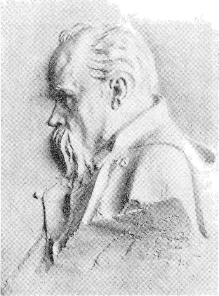
TARAS SHEVCHENKO (1814—1861) EL MAS EMINENTE POETA DE UCRANIA