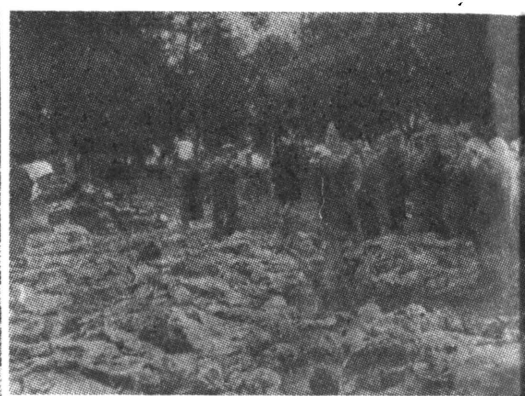
Los familiares buscan sus seres queridos entre los cadáveres desenterrados.

El NKVD, la temida policía secreta rusa, controlaba en dicha ciudad además de la cárcel una gran extensión de terreno junto al Parque Nacional y unos huertos. Fueron estos tapiados con una alta empalizada, una sólida muralla, en marzo de 1938 y se dijo que se iba a construir allí un Hogar Infantil.