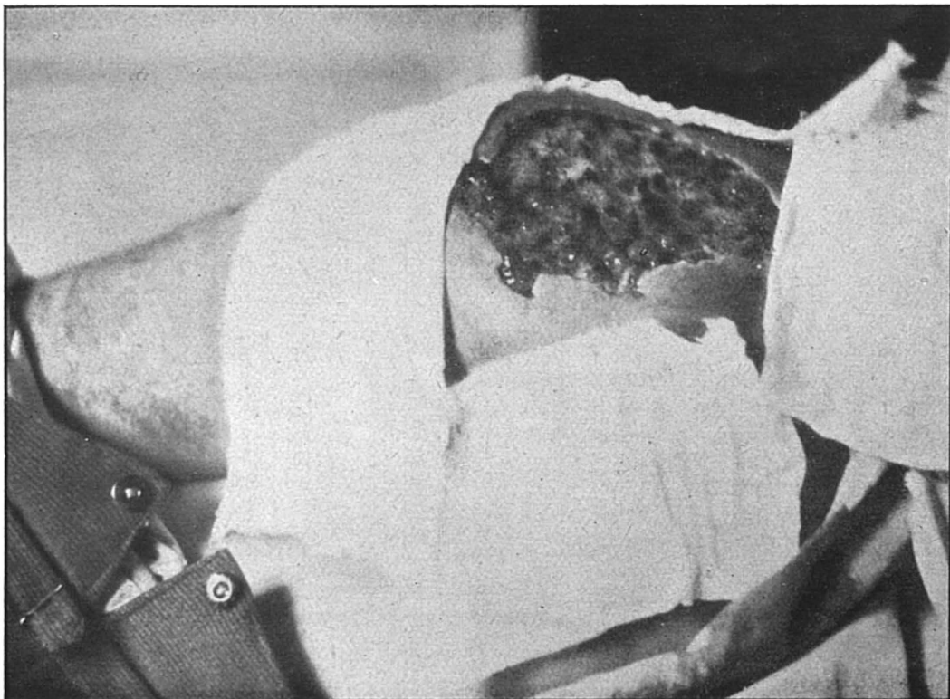
(VII). Pylyp Tantchyne maltraité par la police polonaise au village de Reklunets, distr. Bibrka.