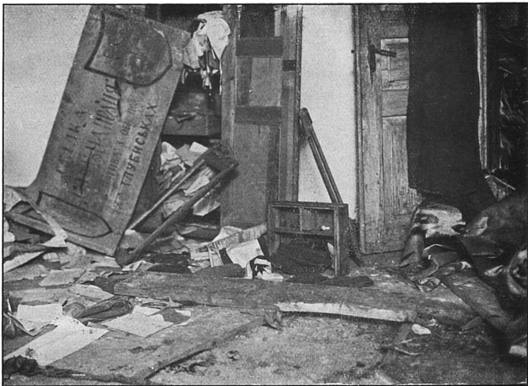
(II). La coopérative »Spilna Pratsia« à Kadloubyska, distr. de Brody après la visite d'une expédition de répression.