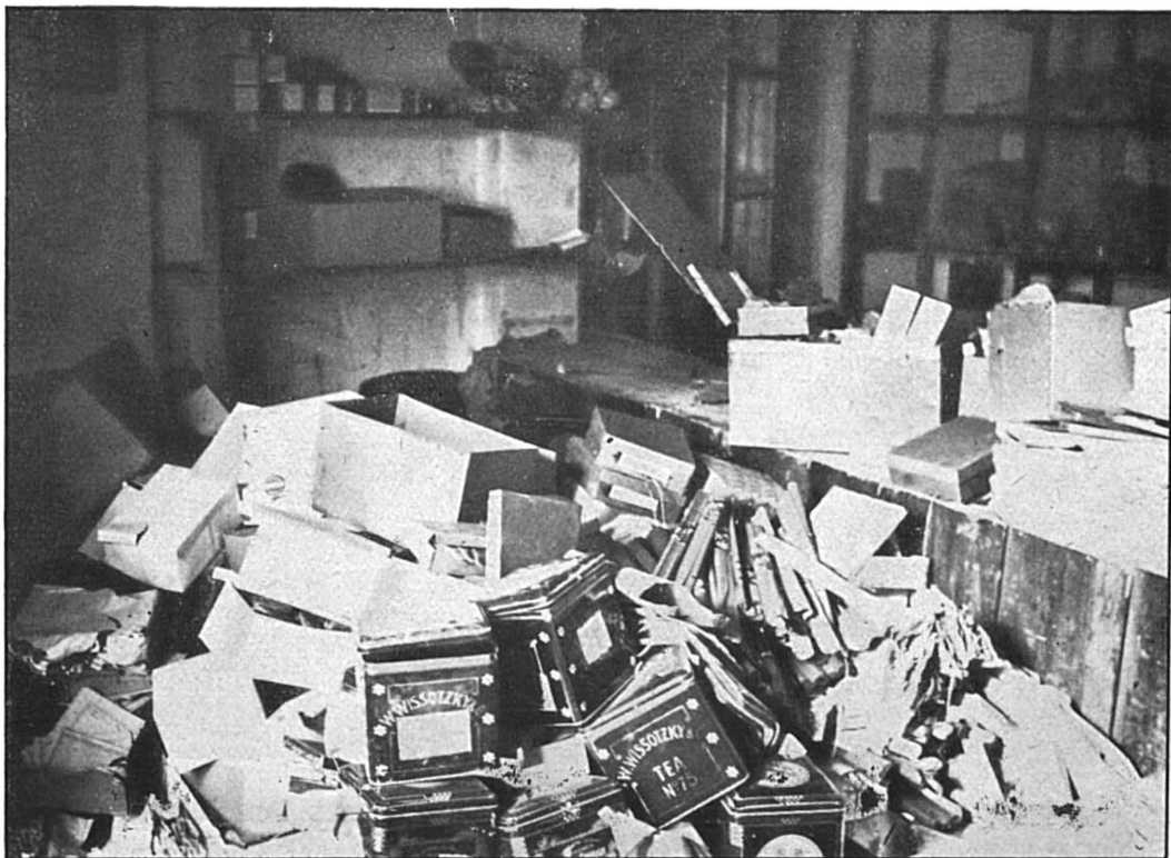
(I). Les magasins de l'Union des coopératives de Podolie à Tarnopol après la »perquisition« faite par la police polonaise.

(Faute de place ne sont reproduites ici que quelques-unes d'entre les milliers d'images pareilles.)