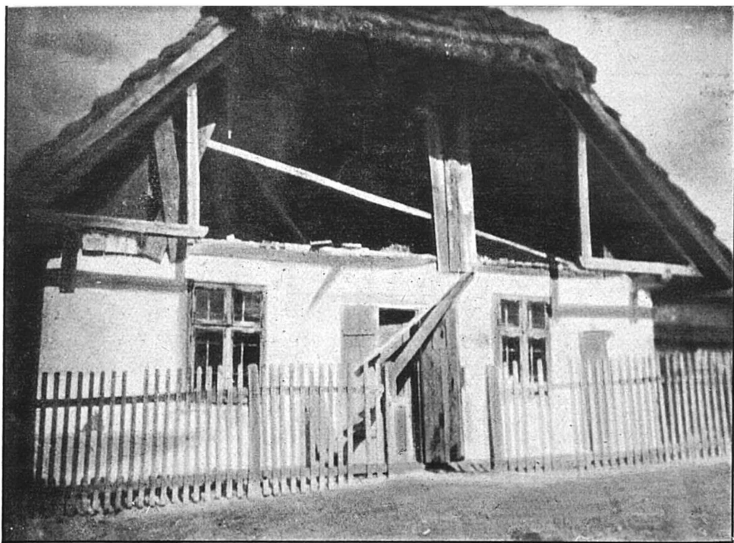
(V). Vue extérieure de la maison »Prosvita« à Haï près Léopol après la perquisition, le 5 octobre 1930.