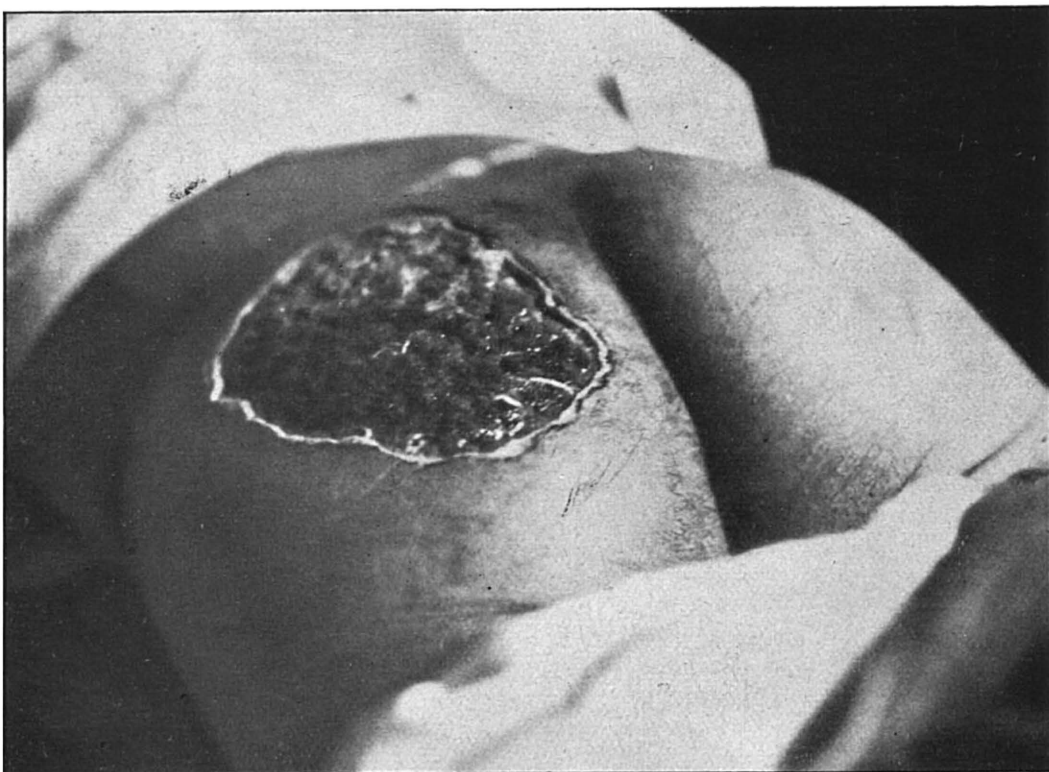
(VIII). Cyrille Chipra de Pidariw, distr. Bibrka, mutilé par les fouets polonais.