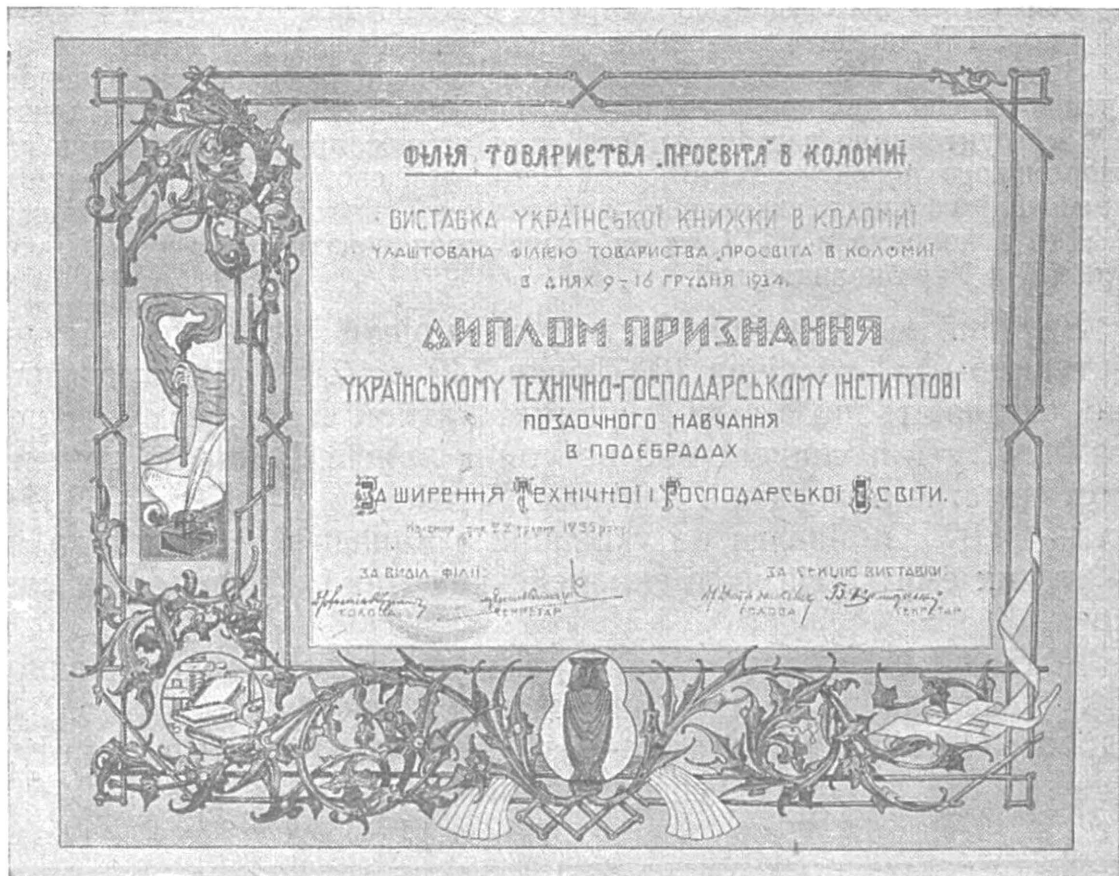
Один з дипломів признання, одержаних УТГІ. на виставці в Краю.

У дійсні студенти Економічно - Кооперативного Відділу, Школи Політичних Наук та Курсів Громадської Агрономії