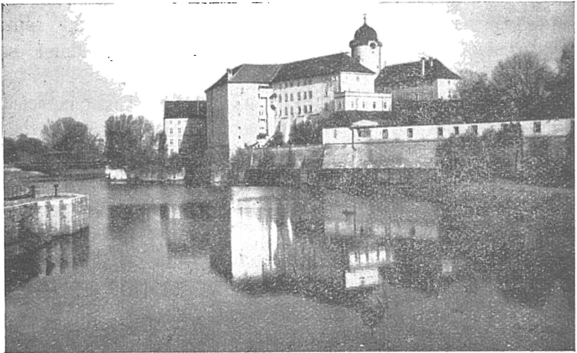
Замок чеського короля XV ст. Юрія Подебрадського, де містяться установи УТГІ.

Українська Господарська Академія повстала в Подебрадах в 1922 році. Вона була заснована Українським Громадським Комітетом в Чехословаччині за участі активних політично-громадсь-