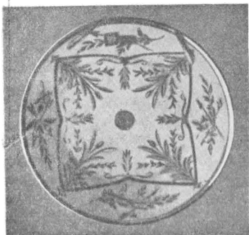
Корсцька порцеляна: тарілка з кавового сервісу

чи цінні поклади полошканської глини, які, до речі кажучи, були не великі, зовсім не вивезені з України вже „модерними, стаханівськими“ засобами комунікації і комунізації?..