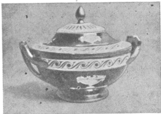
Корення порцеляни: паза

В 1673 р. Louis Porterat винаходить так звану „мяку порцеляну“ (pate tendre). Коло 1708 р., завдяки шуканням Böttger-a і Tschirnhausen-a, з'являється т. зв. „тверда порцеляна“. В 1710 р. повстає перша порцелянова фабрика в Майсені, під проводом Й. Бетгера, а вже в половині XVIII-го століття порцелянове виробництво поширюється в Німеччині, Франції, Англії і загалом в усіх країнах тодішньої Європи.