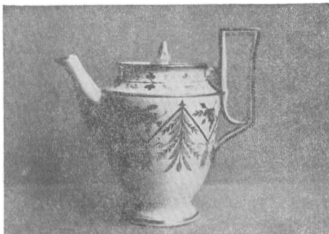
Корецька порцеляна: з кавового сервісу

зей у Варшаві і Кракові, Музей Орд. Замойських у Замостю, Музей Чорториських у Кракові. На українських землях гарну збірку мав Мистецько-Промисловий Музей у Львові, що донедавна був у польській адміністрації. При своїх студіях цих усіх збірок волинської порцеляни, автор особливо скористав із львівських збірок, завдяки ласкавості б. директора музею п. Теслі. Долучені тут фотографії волинської порцеляни, виконував автор безпосередньо з самих музейних експонатів.